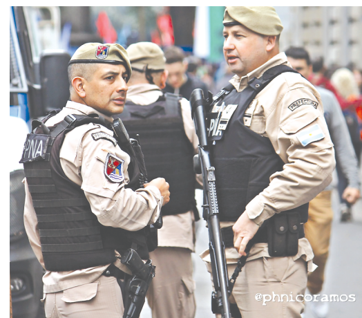
Con armas de fuego.