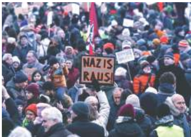
"Nazis fuera", cartel en una manifestación en Alemania.

Y en toda Europa hay continuas manifestaciones contra el genocidio en Palestina, a pesar de la represión y la persecución de los gobiernos. La situación mundial tiene como característica más destacada una creciente polarización política y social que requiere respuestas socialistas y revolucionarias.