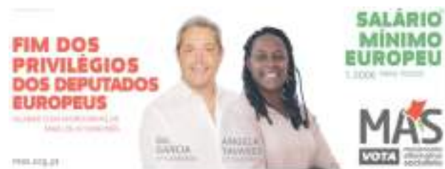
Cartel de campaña del MAS.

Desde la Liga Internacional Socialista (LIS) saludamos la presentación de las listas del NPA-R y del MAS, a las camaradas que las integraron y la disputa que llevaron a cabo.