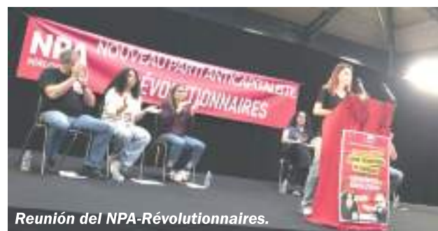
Reunión del NPA-Révolutionnaires.

En las elecciones de algunos países hubo expresiones de la izquierda radical que, aunque modestas, son dignas de destacar. Es el caso de la primera presentación en Francia del NPA-Révolutionnaires, con la consigna "¡Por un mundo sin fronteras ni patrones, urgente revolución!". Además, anunciaron la voluntad de participar en las elecciones anticipadas convocadas por Macron e hicieron un llamado postelectoral: ¡Urge una respuesta social de los trabajadores y los jóvenes!