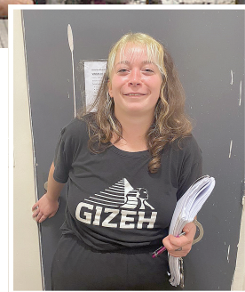
Sasha en la alcaldía.

Seguimos exigiendo la inmediata libertad de las presas y presos por luchar, así como el cierre de las causas penales armadas, en el camino de derrotar el protocolo represivo de Bullrich y el intento de Milei de avasallar todos los derechos y libertades democráticas vigentes.