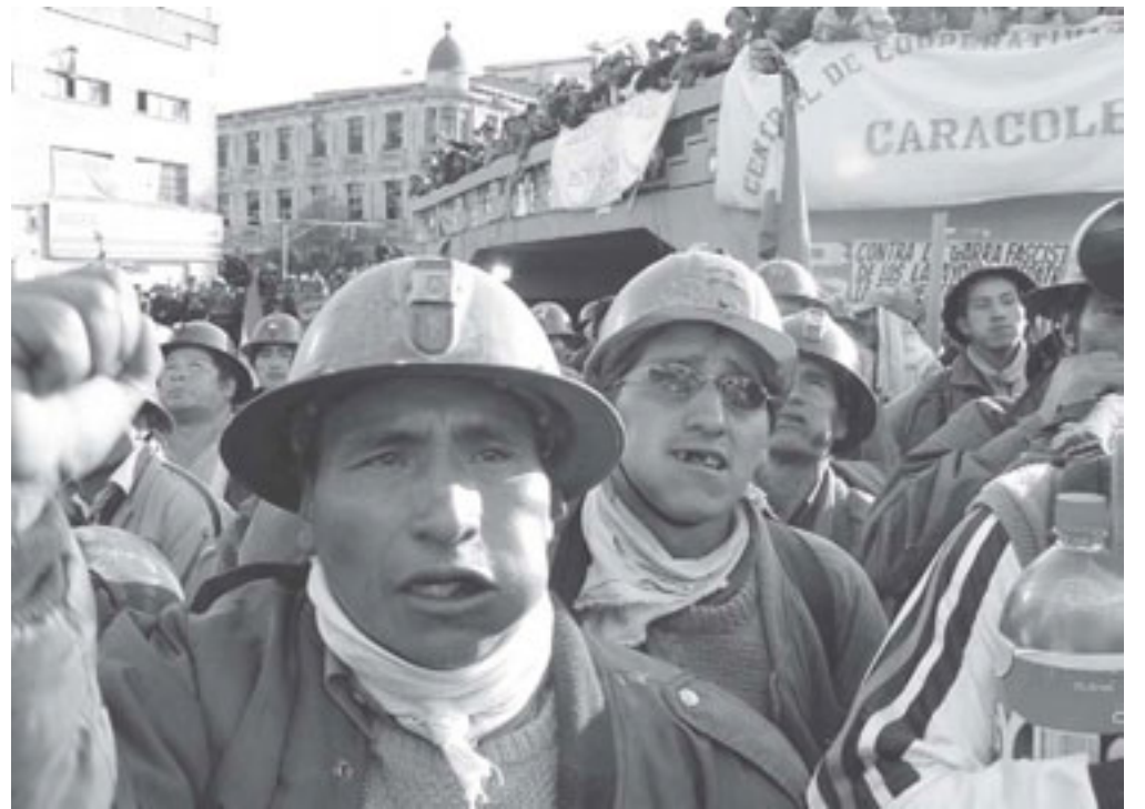
Los mineros marchan sobre La Paz.

“Este gobierno es la misma chola con otra pollera. Evo Morales dijo que hay que darle tiempo al nuevo gobierno. Pero Mesa no inició ningún juicio contra Goni por los asesinatos, defiende las tierras de los ministros de Goni y hace reprimir a los campesinos que las ocupan y sigue teniendo el proyecto de entregar el gas. Es la misma política de Sánchez de