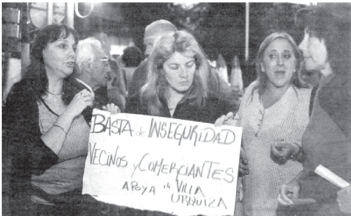
Vecinos de Villa Urquiza en un escrache en la comisaría.

Esto es una muestra palpable de lo que sucede con una jefatura de la fuerza que se siente impune y sin tener que rendir cuentas a nadie. Tanto el anterior comisario, con su red de delito al hombro, como el actual sub a cargo, que se cree que no es su problema explicarle a los vecinos por que viven en una “zona liberada para el delito”, no pueden se-