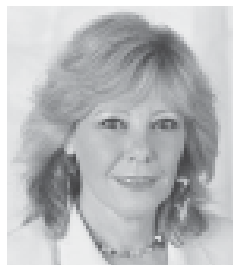
Escribe: Liliana Olivero

Los gobiernos de De la Sota y Kirchner buscan profundizar el ajuste a través de los presupuestos aprobados para el próximo año.