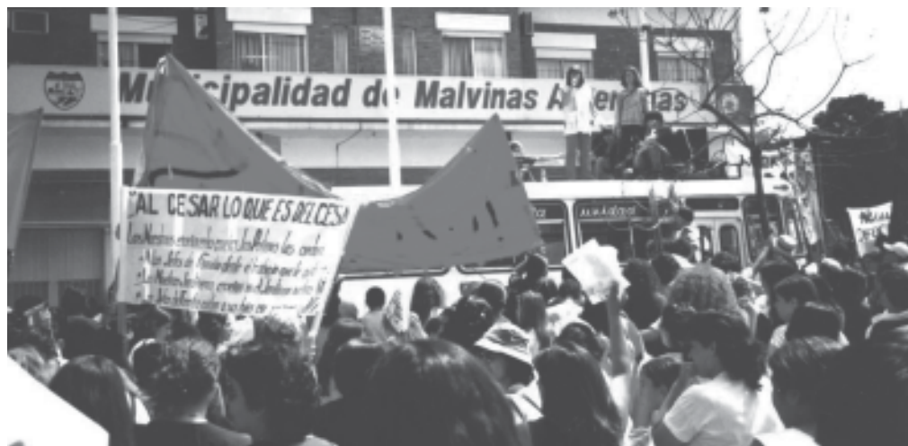
Marcha en Malvinas Argentinas contra la municipalización.

Las seccionales opositoras con SUTEBA-Sarmiento a la cabeza han salido a enfrentar esta política, colaborando con su lucha a que hoy el intendente municipalizador de Sarmiento esté preso por corrupto. Este es el camino que va a tener que recorrer la oposición: impulsar la movilización y la coordinación. Desde Docentes en Marcha somos parte de estas nuevas conducciones y reivindicamos las votaciones que se hicieron en Sarmiento, Lomas, Bahía, Gral. Rodríguez de avanzar con una campaña para preparar un plan de lucha y el no inicio para el 2004 y la convocatoria a un encuentro de delegados de base por la seccionales combativas para ir avanzando en la coordinación.