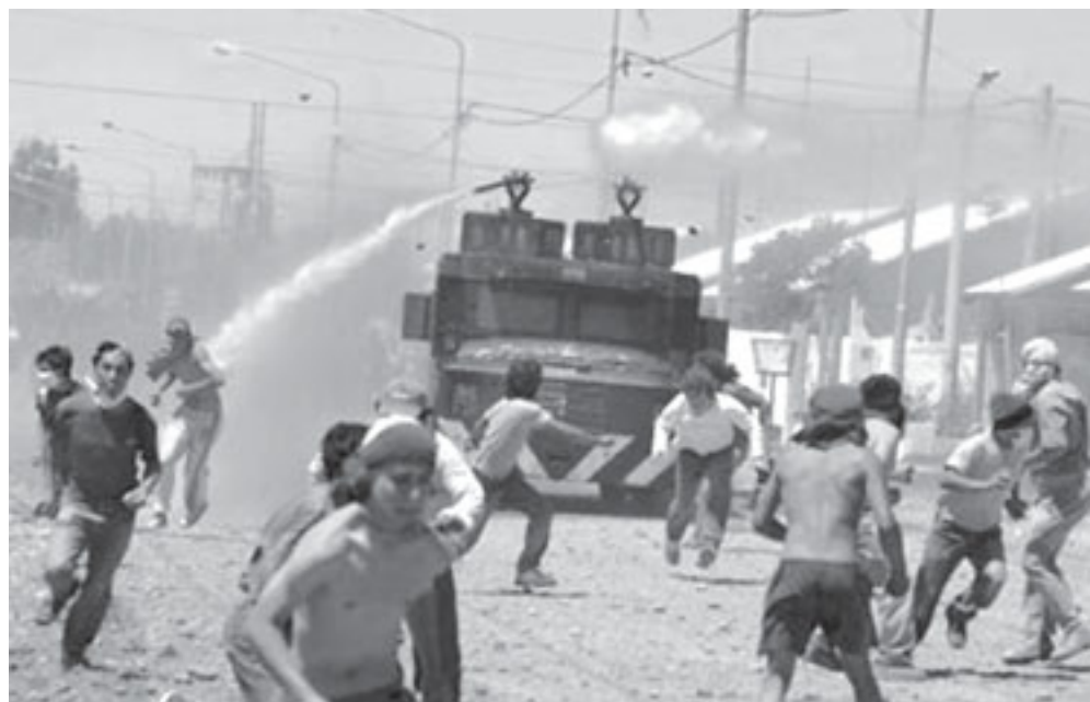
Represión a piqueteros en Neuquén.

Así lo hizo ver el Jefe de Gabinete cuando dijo: "Preferimos no reprimir para no tener muertos". ¡Eso es lo que les preocupa! Reprimir...pero sin muertos. Para no tener que