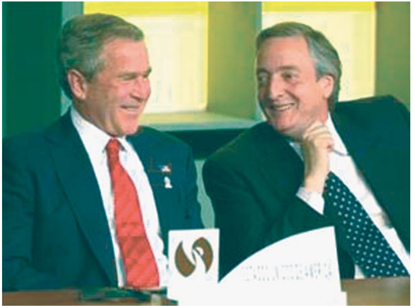
Kirchner con Bush en Monterrey