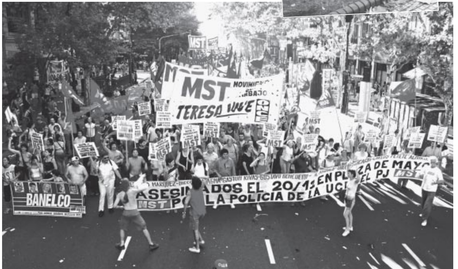
El MST Teresa Vive entrando en la Plaza de Mayo. Arriba: el lugar donde estalló el artefacto explosivo.