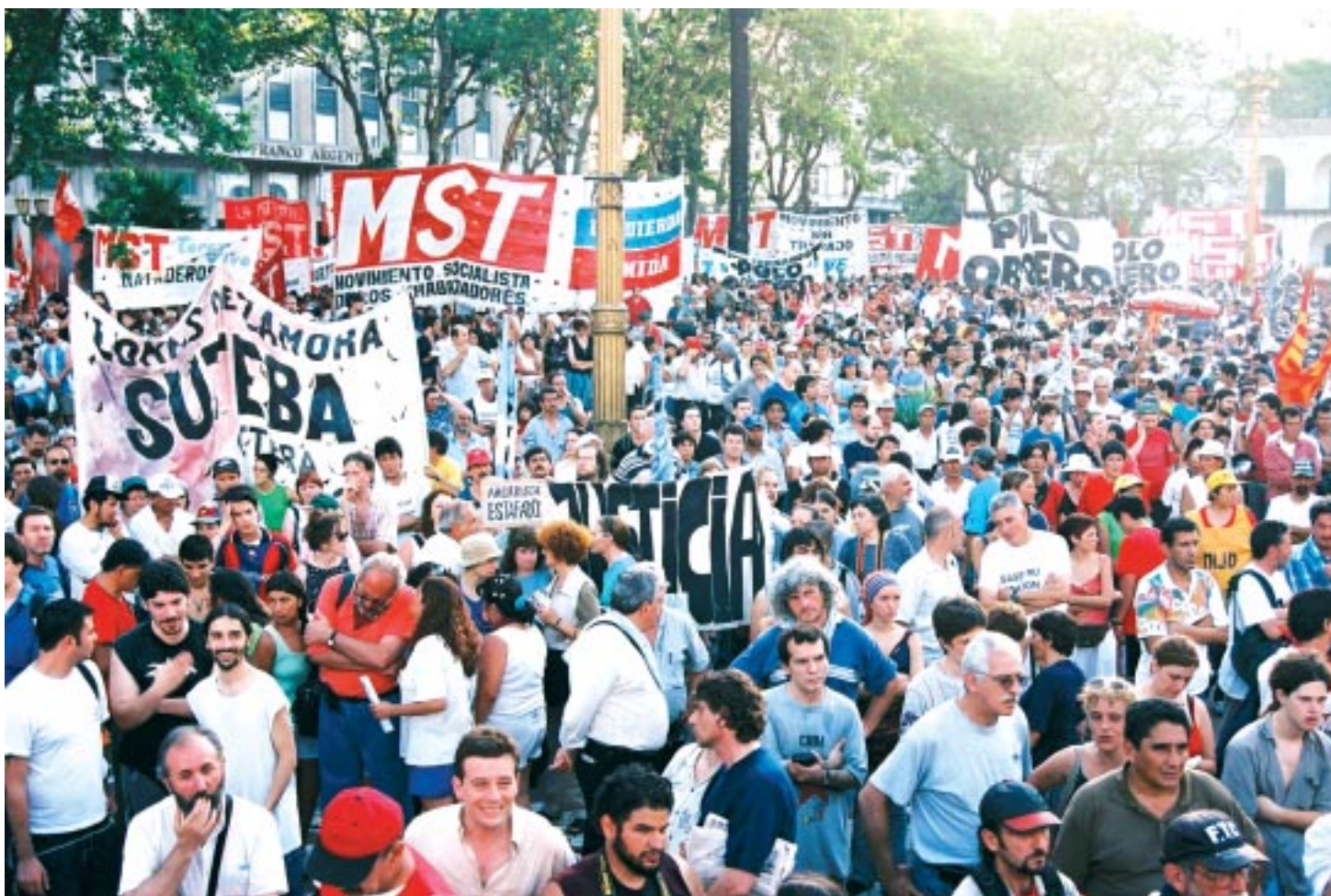
Acto en Plaza de Mayo el 20/12/03

Las consignas de la movilización serán: "Exigir la investigación del hecho, y cárcel a los responsables políticos"; "Cese de la campaña del gobierno nacional y sectores patronales contra el movimiento piquetero y las organizaciones obreras y populares"; "Defensa al derecho a la movilización"; "Juicio y castigo a los responsables de todos los caídos en la lucha popular" y; "Desprocesamiento inmediato de los 4.000 luchadores populares"