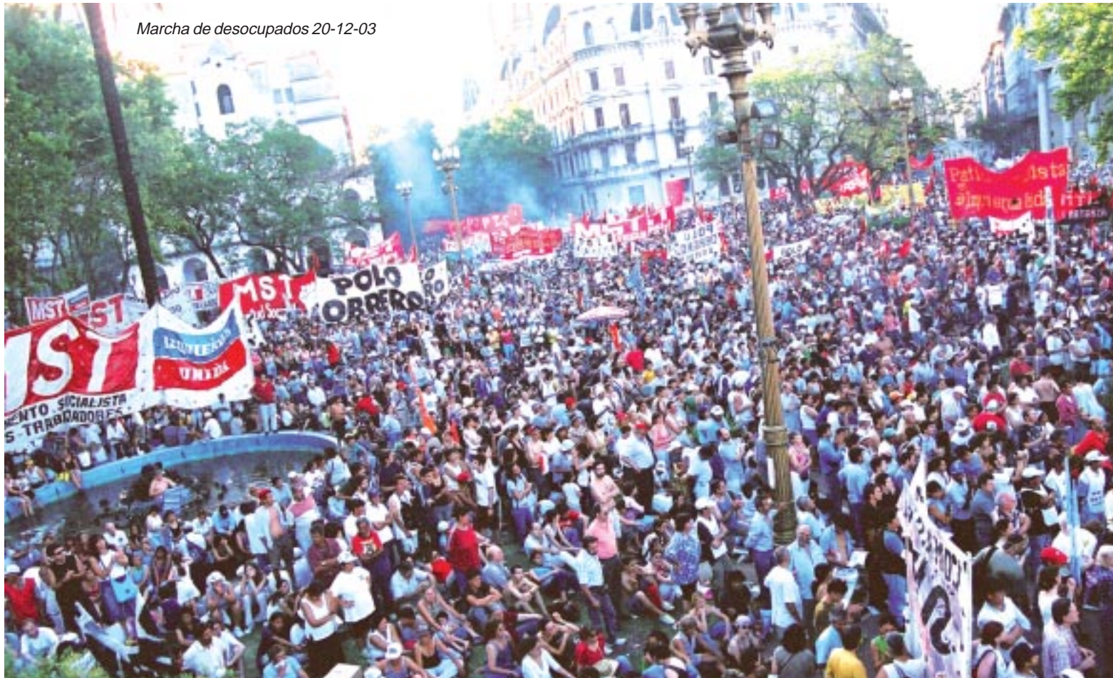
Marcha de desocupados 20-12-03

En esta estadística los "jefes de hogar" figuran como "ocupados", cuando en realidad, por su nivel de ingreso no pueden considerarse ocupados. Si incluimos a los jefes de hogar en la estadística tenemos a otro millón de argentinos con problemas de empleo.