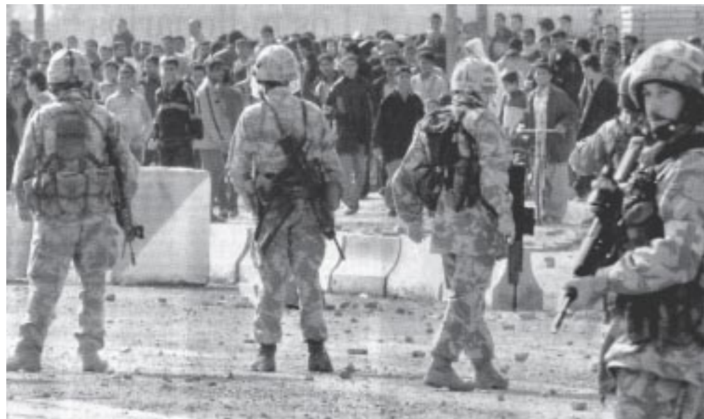
Manifestación popular enfrenta a los ocupantes en el sur de Irak

Por el momento es una activa minoría la que está realizando acciones contra la invasión. La coalición Answer encabezó una mo-