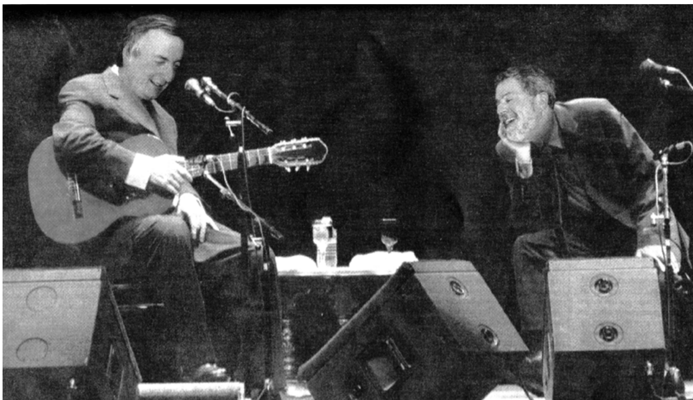
Lula y Kirchner con la partitura del fondo.