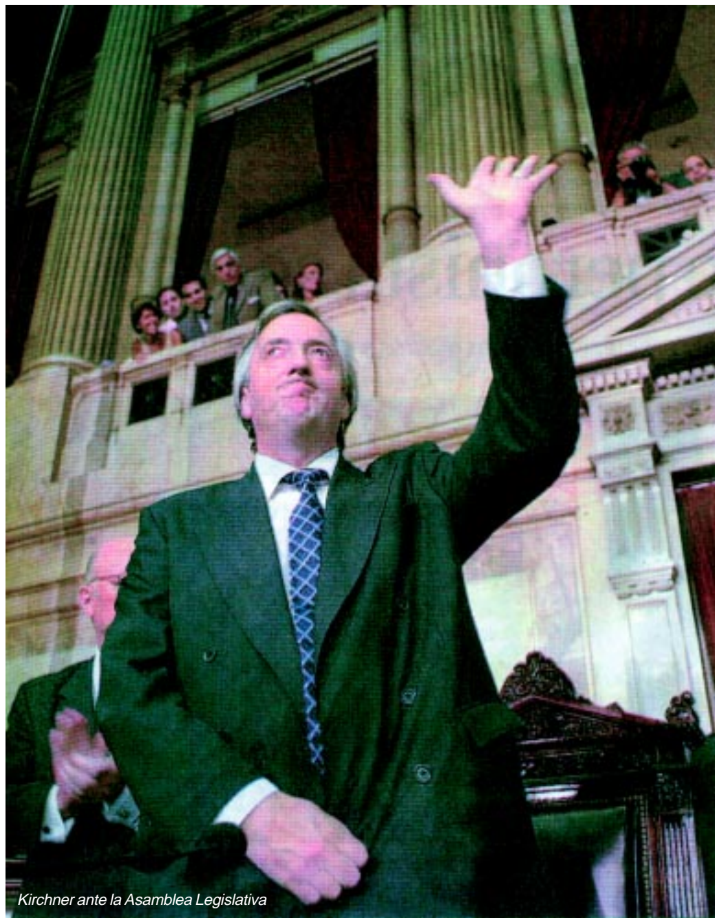
Kirchner ante la Asamblea Legislativa

La historia de la deuda externa argentina es por demás conocida. Desde la Dictadura Militar del '76 hasta la actualidad fueron décadas de saqueo del país. El mecanismo de saqueo fue el de la deuda. Una deuda que por su origen es completamente ilegítima. Contraída por una dictadura genocida. Renegociada por gobiernos títeres como los de Alfonsín, Menem y De la Rúa y personajes como Cavallo, a costa de hundir al país y al pueblo trabajador. Una deuda fraudulenta porque consistió en asientos contables de un dinero que no fue destinado a desarrollar el país, que fue usado para pagar intereses y que no llegó a entrar al país en ningún momento. Una deuda mafiosa que fue armada entre el FMI, los gobiernos de los partidos tra-