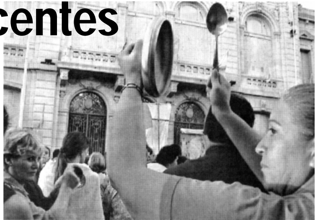
Docentes puntanos contra los Rodríguez Saá

Pero la pelea de fondo contra la corrupción y la entrega del gobierno de los Rodríguez Saá seguirá hasta lograr una salida de fondo, que no es otra que los trabajadores y el pueblo de