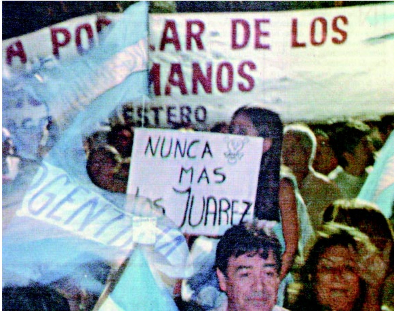
Fué el pueblo santiagueño el que dijo adiós a los Juárez

Un interventor del PJ no va a resolver los graves problemas del pueblo santiagueño. En su momento, esos políticos patronales avalaron la entrega del patrimonio de la nación y la provincia. Y durante décadas fueron cómplices o hicieron la vista gorda ante los crímenes de los Juárez. Mediante la movilización, el pueblo santiagueño tiene que lograr que nunca más vuelvan los Juárez, y que ellos y sus secuaces sean juzgados por sus delitos de todo tipo. Hay que lograr el castigo para los