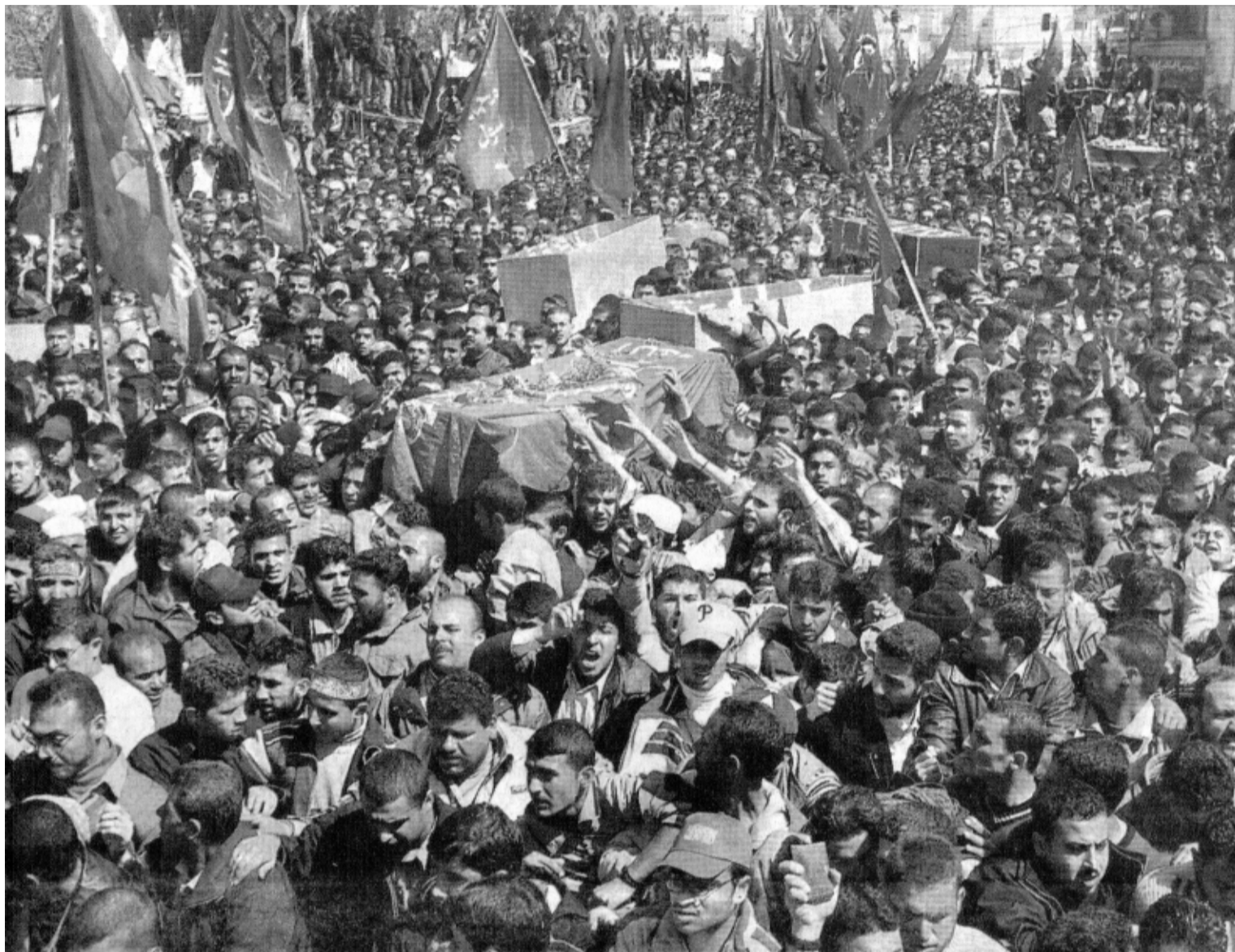
Multitudinaria manifestación en el entierro de sheij Ahmad Yasín

sangrienta. Sólo retirará a 7.000 de los 400.000 colonos invasores. Construyó un muro de acero para aislar a los árabes y quitarles no sólo la parte árabe de Jerusalén, sino también partes enteras de Gaza y Cisjordania, mientras se re-