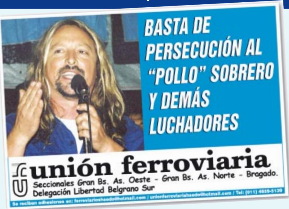
Pronunciamento del Concejo Deliberante de La Plata en apoyo a Sobrero