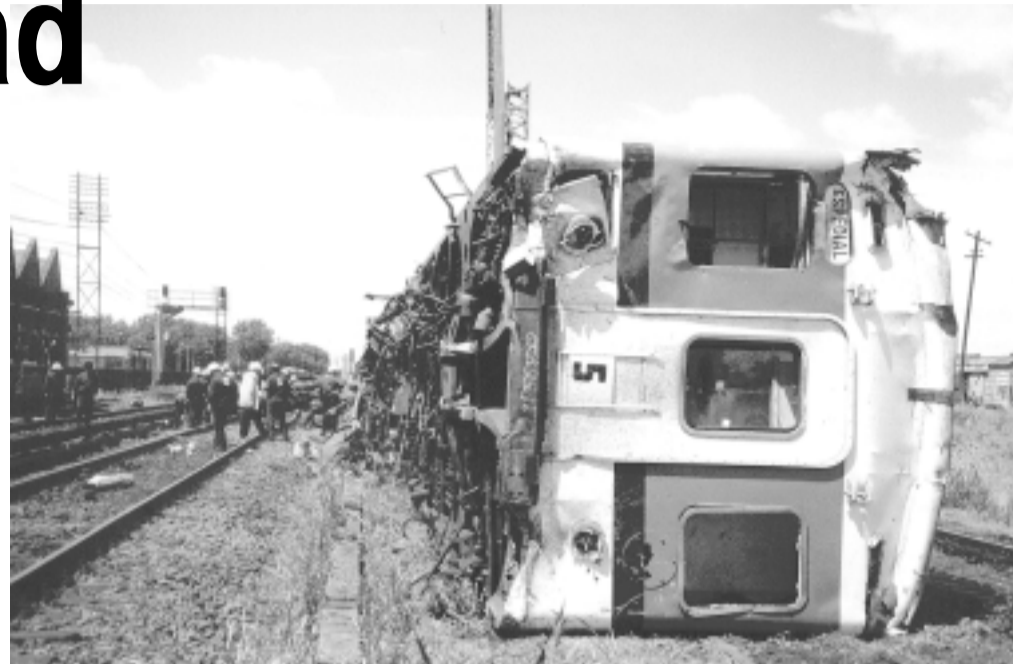
Los ferroviarios continúan luchando contra la inseguridad en la que trabajan

El día 18 de marzo realizamos una mesa de denuncia en Once con muy buena receptividad por parte de los usuarios y este viernes 2 de abril se realizará una mesa de denuncia en Retiro, donde esperamos contar también con el apoyo de los pasajeros.