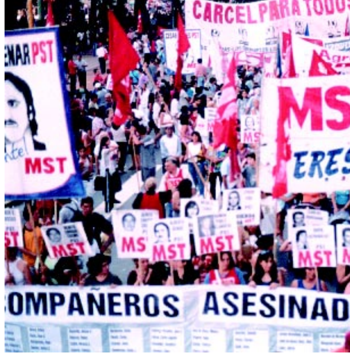
Importante columna del MST en la marcha a Plaza de Mayo

Este 24 de marzo, en el 28 aniversario del genocidio, manifestamos en las calles por cárcel a los genocidas contra el genocidio económico. En Buenos Aires se movilizó y llenó varias veces. En casi todo el país se realizaron movilizaciones. Porque no hay olvido ni perdón año tras año. Y surgen nuevas polémicas que es necesario sacar conclusiones.