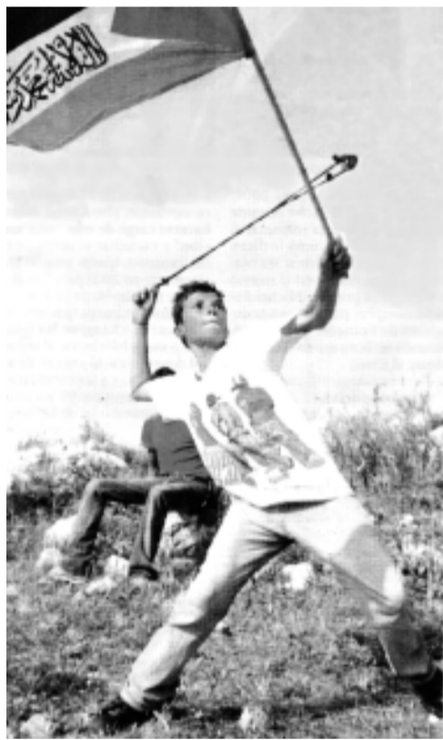
Continúa la resistencia

Paralítico desde los 12 años, Yasín pasó muchos años de su vida en las cárceles de Israel. Ahí la tortura agravó sus enfermedades y perdió la visión de un ojo. Era una de las personalidades políticas y religiosas más populares en la región de Gaza. Entre sus 1.300.000 habitantes, que son los más castigados por el hambre y la represión que impone