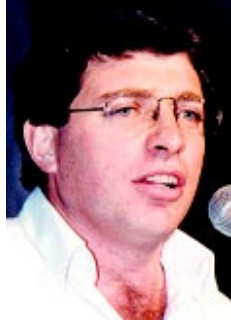
Escribe: Juan Carlos Giordano

Cuando se terminaba de leer el documento consensuado por las 220 organizaciones convocantes a la marcha a Plaza de Mayo, todavía había columnas que querían entrar a la histórica plaza. Los medios lo tuvieron que reconocer. 70.000 personas. El 24, fue una verdadera jornada nacional contra la impunidad con actos y marchas en todo el país. Participamos muchos más que el año pasado. Todo un éxito.