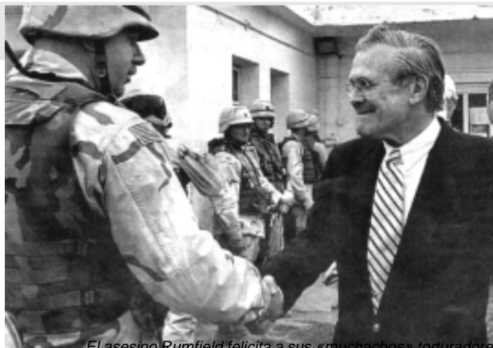
El asesino Rumfield felicita a sus «muchachos» torturadores

Rumfield, la mano derecha de Bush, después del escándalo, visitó Irak y felicitó a sus tropas porque "lo están haciendo muy bien".