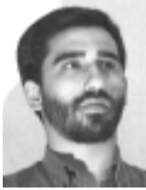
Escribe: Agustín Vanella Presidente de la FUBA

La situación presupuestaria de las Universidades Nacionales se agrava día tras día. Sucede que el actual presupuesto se incrementó respecto del anterior tan solo en un 3%, y es necesario tener en cuenta que las partidas que se otorgaron desde 2002 se han visto reducidas en términos reales de manera notable como consecuencia de la devaluación del peso frente al dólar. Esto junto con la inflación de precios viene generando que los salarios de docentes y no docentes -los cuales no se incrementan desde hace más de una década- sean absolutamente insuficientes para cubrir sus necesidades.