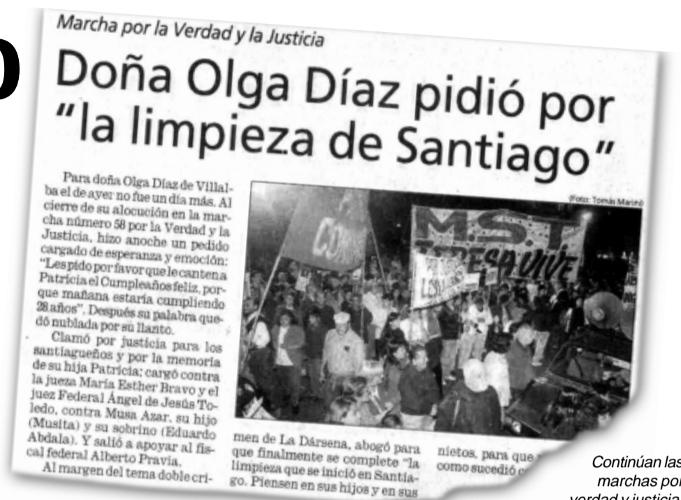
Continúan las marchas por verdad y justicia.

Para dar seguridad, hay que exigir que esos comisarios y jefes corruptos vayan presos y sea el pueblo, mediante el voto popular, el que pueda elegir a los comisarios, con cargos revocables. Para que le rindan cuenta a los vecinos y no a los políticos de turno.