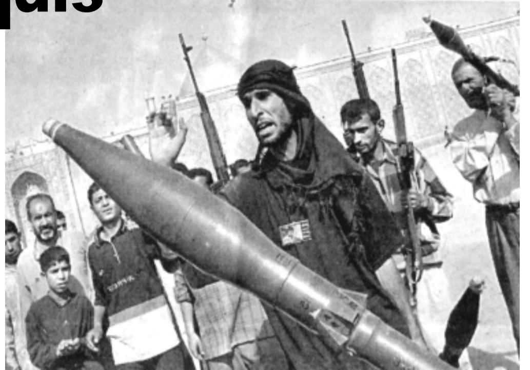
Milicianos rebeldes controlan ciudades y barrios

La afirmación del influyente senador Kennedy -«Irak es el Vietnam de George Bush»- mueve poderosas emociones en Estados Unidos. En Vietnam, Estados Unidos sufrió una humillante derrota hace 30 años. El "fracaso no es opción" es la frase favorita de los militares yanquis. Pero