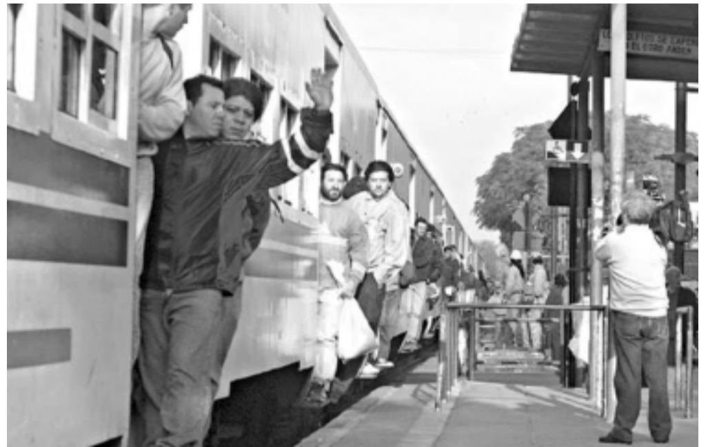
Con las privatizadas, se viaja como ganado.

El plan que le presentó la CNST al gobierno es sumamente simple. Con los actuales fondos que recibe la línea San Martín y con la venta de sus boletos, sería posible, en no más de 5 años, reconstruir totalmente ese ferrocarril. Aumentando su dotación actual de personal incorporando fundamentalmente personal al área de Vías y Obras y de Mantenimiento del material rodante, los dos sectores más castigados por las irracionales reducciones de personal de la empresa Metropolitano.