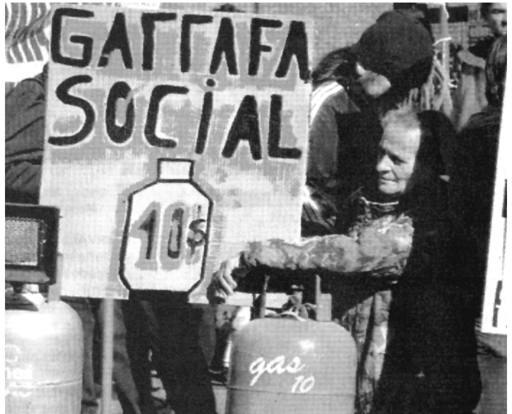
Los sectores más pobres de la población, consumen gas en garrafa.

Los mismos pulpos también se hacen su agosto con la venta final de combustible al público. Así vemos las constantes subas de la nafta, hace poco del GNC y recientemente del gas oil por parte de Esso y Shell. El gobierno anuncia con bombos y platillos que, "por ahora", logró evitar que YPF-Repsol y Petrobrás también lo aumen-