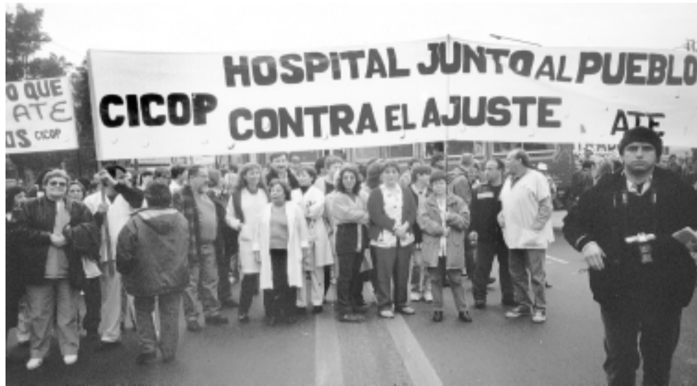
Los trabajadores de los hospitales a la cabeza de la lucha

Es que la fuerte pelea de los hospitales del conurbano, la lucha del IOMA junto a los hospitales de La Plata, y el estado asambleario en los ministerios, muestran con creces que hay condiciones para que se profundice y unifique la lucha. Una necesidad para torcerle el brazo al gobierno. Lamentablemente no es lo que piensan los dirigentes que llaman a paros aislados. Sin embargo la base responde con fuerza e incluso prolonga en el tiempo esos paros a 48 y 72 hs en muchos lugares. Por eso desde la CICoP, fuimos con ese planteo al ple-