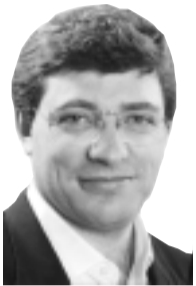
Escribe: Juan Carlos Giordano

Kirchner había anunciado una quita del 75% para la deuda privada que no se venía pagando desde diciembre de 2001. Pero ahora cambió el discurso. Propuso una quita menor y reconoce 23.000 millones de intereses por ese no pago: equivalente a siete años de Planes Jefes de Hogar. Así la deuda crece al doble. Una nueva burla.