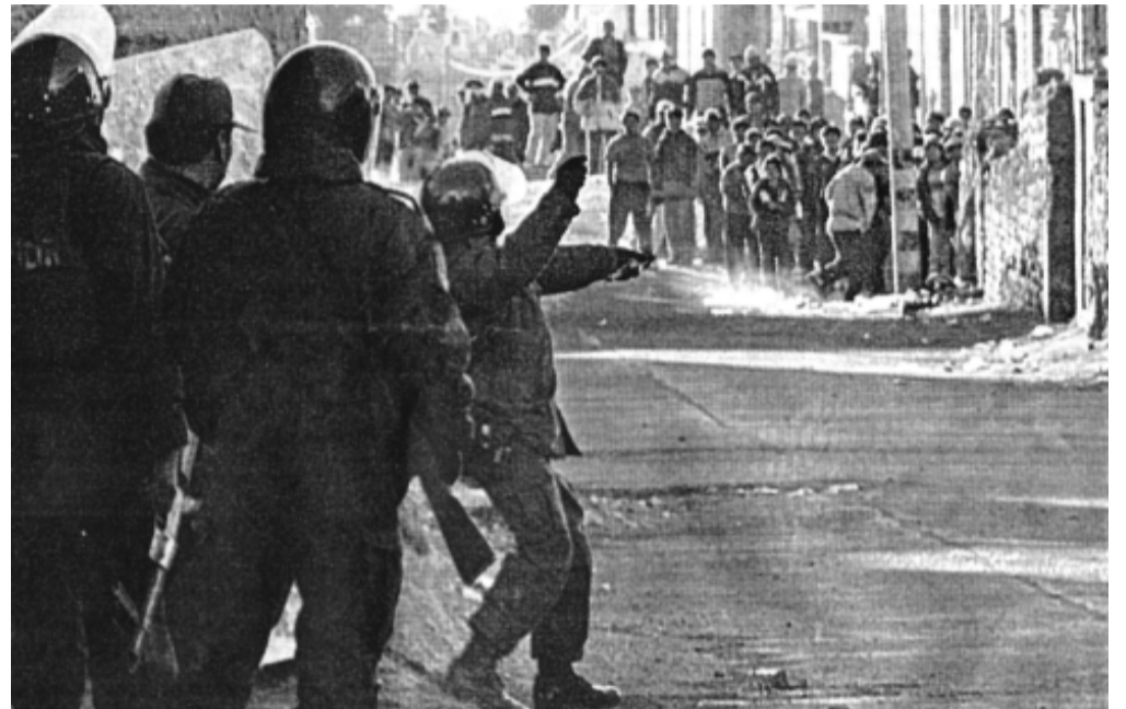
El ejército se tuvo que retirar de Ilave

También la dirigencia sindical se ha negado a plantear la caída del gobierno. Recientemente el secretario general de la CGTP (Central General de Trabajadores del Perú) Juan José Gorriti afirmó que la central "se opone a recortar el mandato presidencial" (diario El Comercio). Tampoco hicieron ninguna acción en apoyo al pueblo de Ilave que estaba siendo intervenido por el ejército. Esta posición la fundamentó en que la CGTP está preparando su pro-