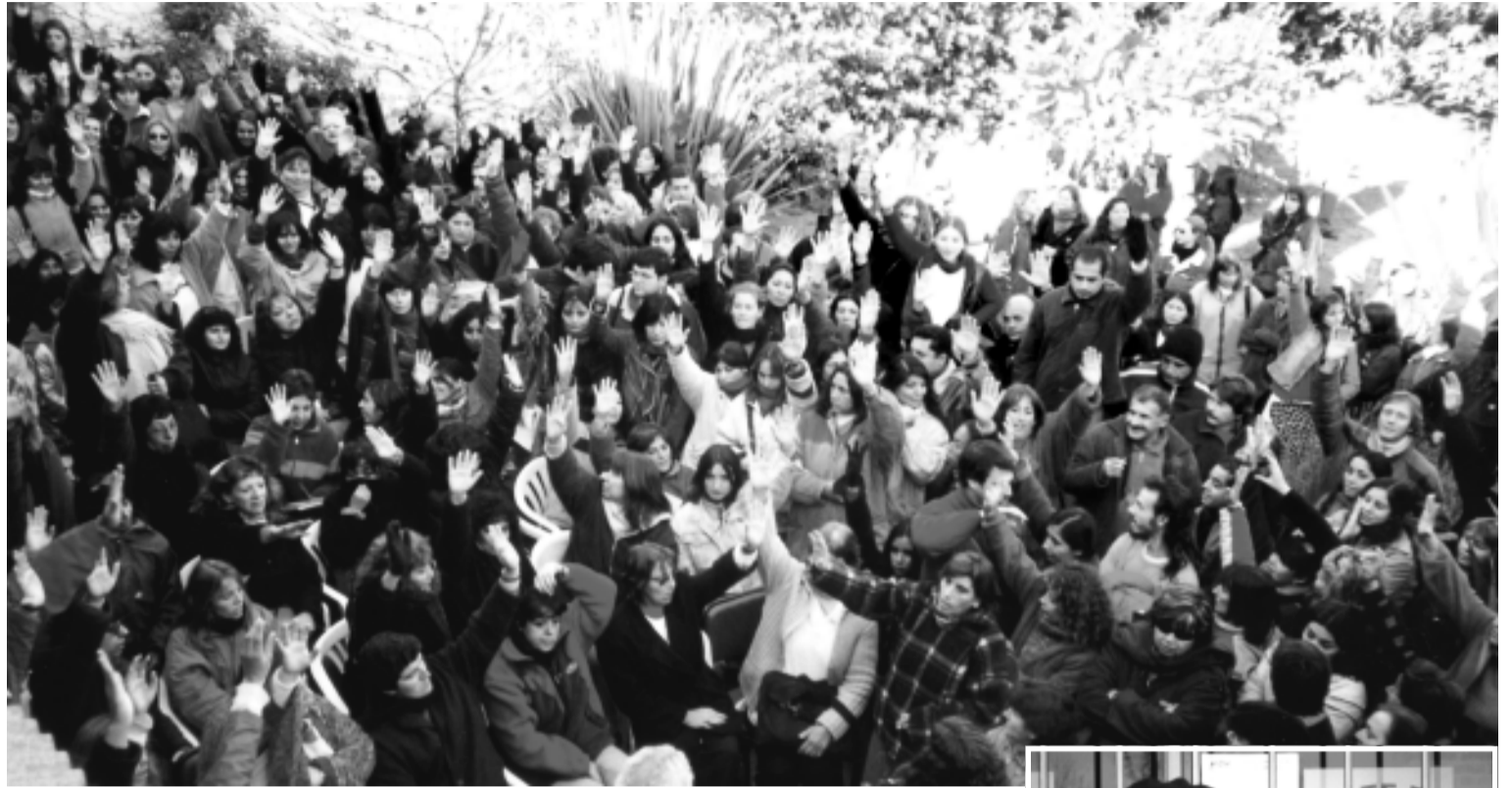
Asamblea del 28/5 en el Suteba de Gral. Sarmiento.

En clara oposición a los tradicionales métodos burocráticos de la lista Celeste, los docentes de la seccional volvieron a dar un ejemplo de democracia sindical.