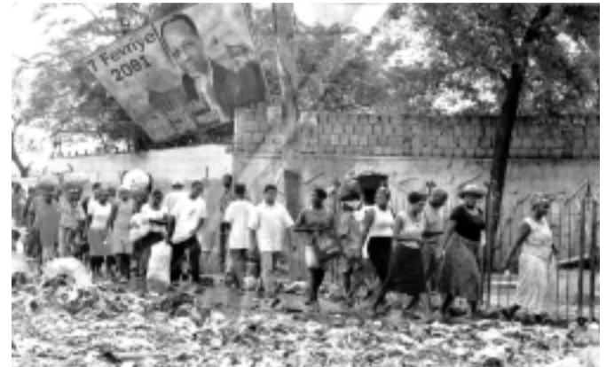
Las fuerzas invasoras seguirán con el hambre del pueblo haitiano

Es necesario poner de inmediato en marcha una amplia campaña unitaria en repudio al envío de tropas a Haití. Las movilizaciones en todo el mundo están haciendo retroceder a los yanquis de Irak. Tenemos que hacer lo mismo