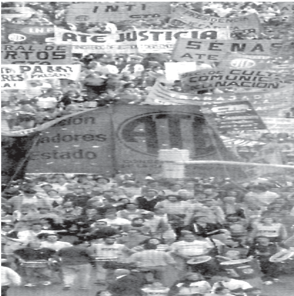
Estatales en Plaza de Mayo exigiendo aumento de salarios

Nuestra pelea se ha transformado en un problema político para el gobierno. Empiezan a ceder aumentos miserables que muestran que hay plata. Hace falta profundizar la pelea y el mayor escollo son los dirigentes burocráticos que dividen y no están dispuestos a llegar hasta el final. Pero esta vez nuestra fuerza empieza a imponerse. En algunas lugares con autoconvocatorias. En otros logrando asambleas conjuntas y rompiendo la barrera que nos impone la división en varios sindicatos. Tenemos que exigir y multiplicar las asambleas conjuntas para unirnos por abajo y exigir plenarios de delegados abiertos para organizar la pelea todos los estatales unidos. Para que ante cualquier oferta, sea la base la que decida en asamblea si se acepta o rechaza. Para organizar los paros y marchas. Para decidir cómo darle continuidad a la lucha. Y un paso fundamental es unir la pelea que estamos dando en las distintas provincias. Hay que exigir a los dirigentes de los gremios nacionales como UPCN, ATE, a los gremios provinciales, a la CGT y la CTA, que convoquen a un paro nacional de estatales y a un plan