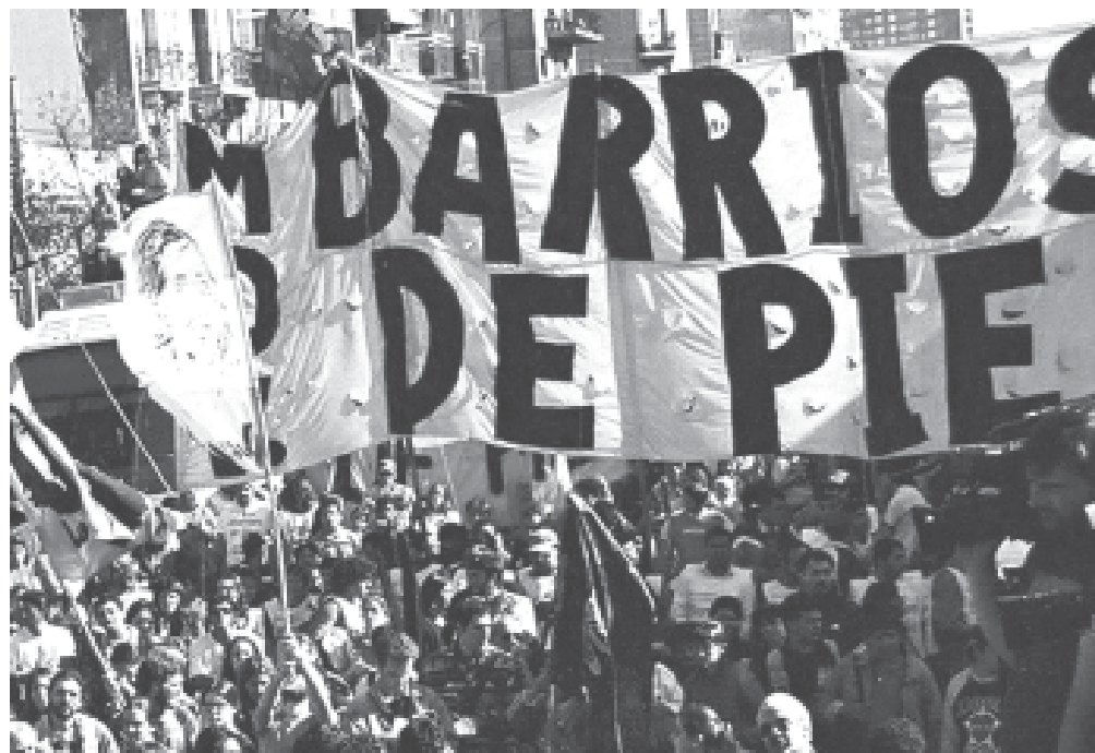
Otros tiempos, cuando marchaban a Plaza de Mayo reclamando al gobierno

Es evidente que para definir a K y su gobierno podríamos hacerlo señalando esas ca-