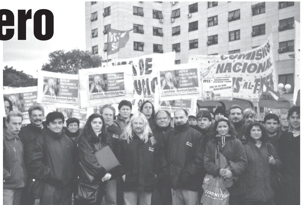
Sobrero junto a dirigentes ferroviarios y de otros gremios frente a los Tribunales de Comodoro Py

Lo persiguen como parte de los 4.000 luchadores en todo el país, «judicializando la protesta social», como lo está haciendo Metrovías con 63 trabajadores del Subte, el gobierno de Neuquén contra Albino Trecanao, dirigente del Cutralcazo; en Bariloche contra la docente Schiffrin o en Salta