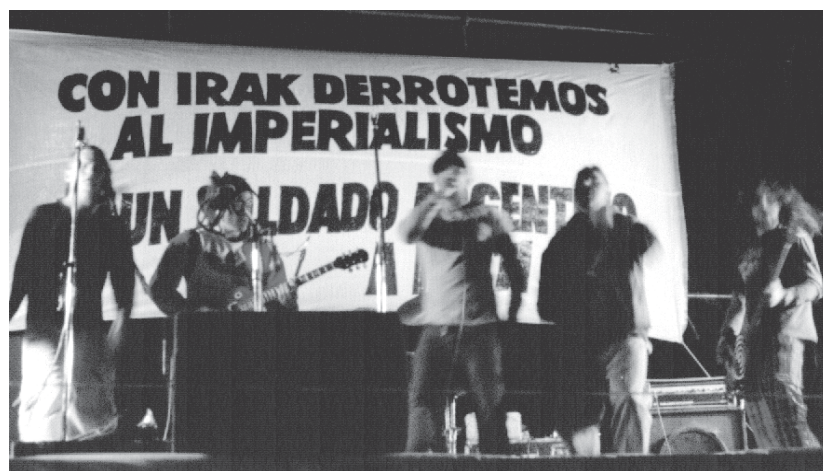
Festival de solidaridad con el pueblo de Irak organizado por la FUBA

El encuentro abrirá estos debates y muchos otros que seguirán en los próximos meses. Y tiene que servir también para preparar la movilización en apoyo a los estudiantes procesados, y cómo poner en pie un plan de lucha por mayor presupuesto y un verdadero aumento salarial que tenga un punto fundamental en la realización de una gran acción unitaria cuando el Congreso trate este tema en el mes de se-