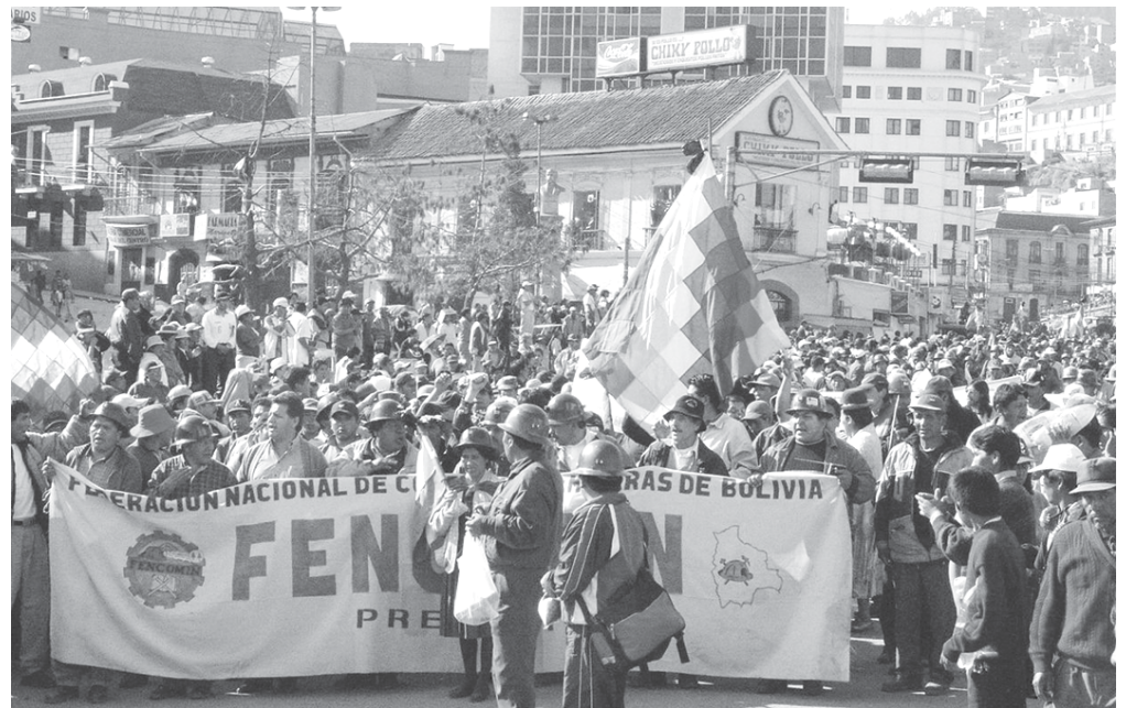
El pueblo boliviano se moviliza para que no le roben el gas