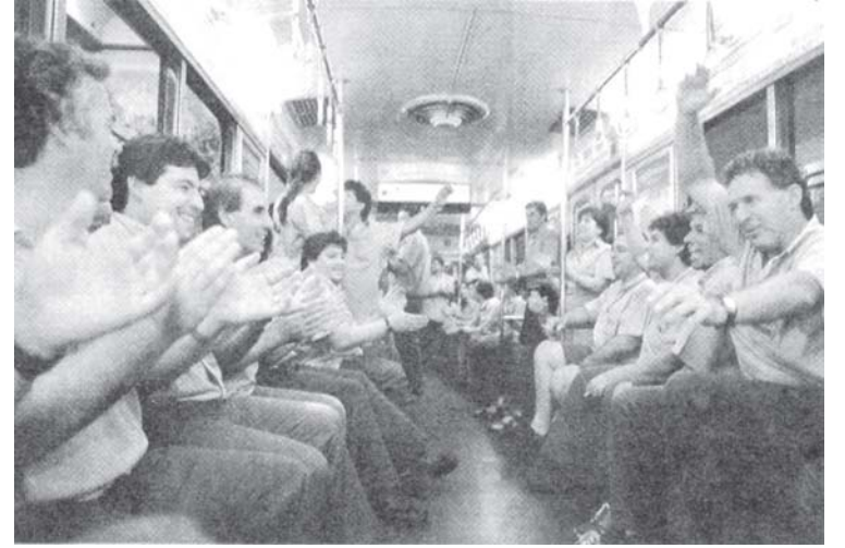
Asamblea durante el conflicto del Subte

Por ejemplo, en relación a la amnistía o desprocesamiento de los luchadores debemos apoyar esta lucha avanzando por el camino que ya se comenzó, de una amplia unidad con otros sectores políticos y sociales. El pasado jueves 24, se acordó lanzar un movimiento en unidad entre los ferroviarios, el Cuerpo de Delegados del subte, todas las organizaciones de izquierda, distintos diputados como Mario Cafiero, Ariel