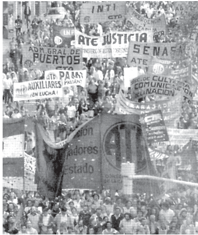
Estatales marchan a Plaza de Mayo

Mientras los dirigentes burocráticos se toman vacaciones, quedan brasas encendidas en varios lugares y se reponen energías en el resto para ver cómo retomar la próxima etapa. El martes 6/7 la CICOP realizó una Jornada con Paros y Movilizaciones, ante la defeción de ATE que guardó para otra ocasión su anunciado "paro nacional". En La Plata CICOP y la seccional del Suteba realizaron un guardapolvazo y un abrazo al Hospital San Juan de Dios. El Frente Gremial ATE/CICOP de San Martín, por decisión de asambleas conjuntas,