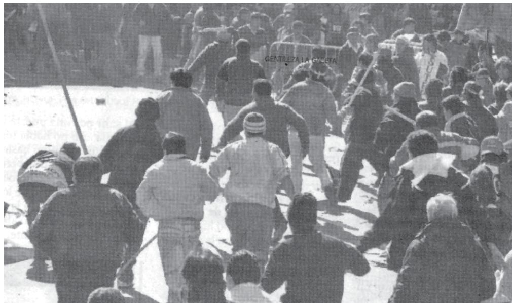
Enfrentamiento entre los oficialistas de Barrios de Pie y trabajadores estatales y desocupados

El recurso de asociar a la izquierda en general con la "Unión Democrática" de la década del cuarenta, que utiliza el dirigente de Patria Libre es, por decir lo menos, insultante. La vieja Unión Democrática de 1945 fue un frente electoral organizado desde la Embajada Norteamericana, por el entonces Embajador yanqui, Spruille Braden. La integraban el radicalismo, el Partido Comunista, el viejo partido socialdemócrata y la cúpula de la Iglesia junto a los diarios de la Oligarquía local. Es bueno decir al pasar que la corriente política que hoy se continúa en el MST, fue ferviente opositora de la Unión Democrática. El objetivo de ese Frente Gorila, era derrotar electoralmente al peronismo y alinear al país con Estados Unidos. Pero ¿es esto lo que piden los trabajadores estatales y los desocupados tucumanos y del país hoy? De ninguna manera (ver artículo en esta pági-