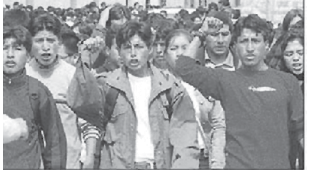
Estudiantes manifiestan en Huamanga en apoyo a la huelga docente

Por eso, en junio del 2002 hubo una pueblada en Arequipa que impidió la privatización del agua. Y en julio del 2003, una poderosa