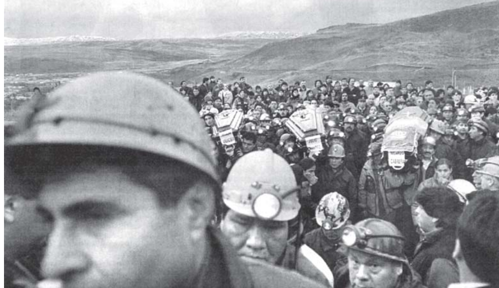
Todo Río Turbio se movilizó

Hizo saber que el actual Secretario de Energía, Daniel Cameron, de 1994 y 2002 fue integrante de la Comisión Fiscalizadora de la concesión en representación del gobierno provincial: debía controlar la mina y no rescindió el contrato. “Kirchner nos prometió para 1998 una superusina que nunca construyó. Eximió del canon por 6 millones a condición de que Taselli mantuviera los 1.331 trabajadores y quedamos 800 y 200 contratados”. Y dijo: “Un minero gana $ 600...¿Saben cuánto estaba la canasta familiar a noviembre de 2003 en Santa Cruz: en $ 2.686,39. Ahora