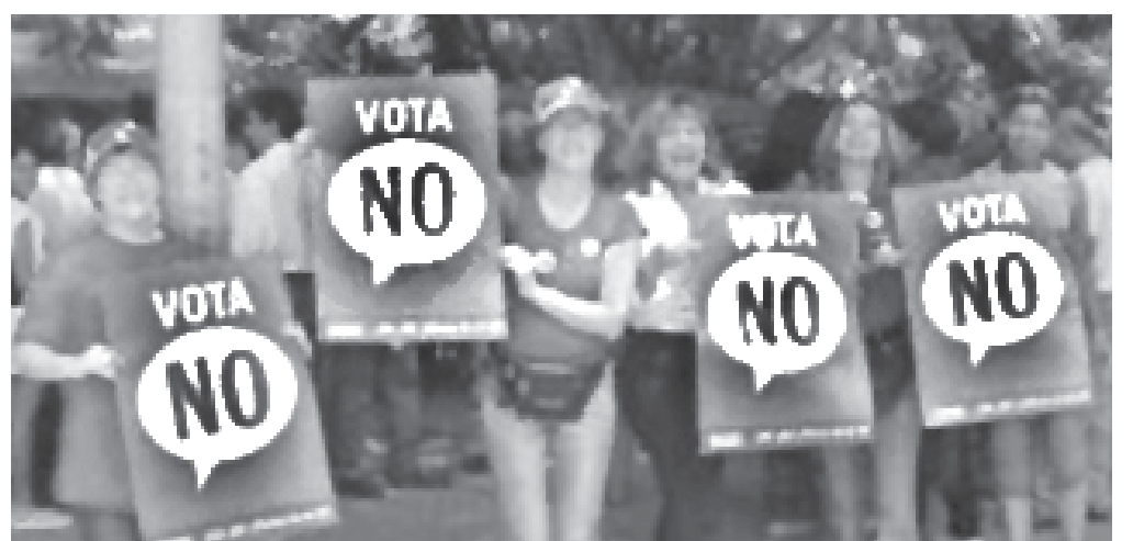
Trabajadores en campaña para decirle no Bush

"Nos sumamos al llamado de solidaridad internacional de los dirigentes de la organización OIR (Opción de Izquierda Revolucionaria) de Venezuela, de La Jornada, del Movi-