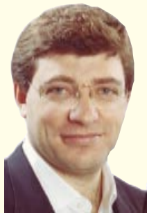
Escribe: Juan Carlos Giordano

El ministro Beliz se fue haciendo serias acusaciones contra la SIDE. ¿Qué hay detrás de este hecho que se transformó en el primer escándalo político de la era Kirchner?