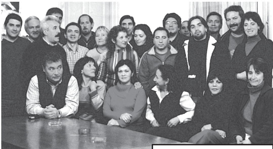
Integrantes de la lista Blanca-Bordó

Hoy, la oposición encara nuevos desafíos, porque ahora más que nunca es necesario organizarse para mantener lo que lograron y seguir sumando trabajadores para exigir aumento salarial y pago en fecha, defensa incondicional de los puestos de trabajo sin pago en