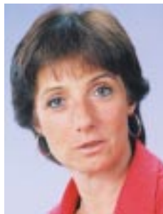
Escribe Vilma Ripoll , Diputada de la Ciudad

No hay que dejarse engañar. Sigamos la pelea contra las reformas represivas y por la libertad de los 16 compañeros presos.