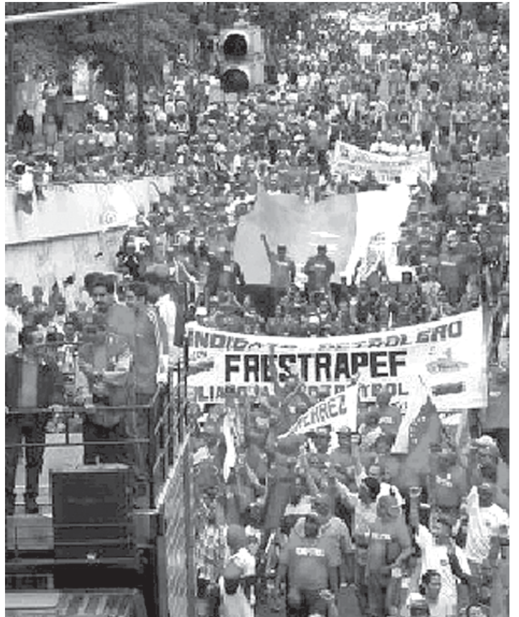
Manifestación de la UNT el 1º de Mayo en Caracas

La confrontación aguda que vive el país no finaliza el 15 de agosto. De hecho estamos preparando política e ideológicamente a los trabajadores para las futuras batallas que se avecinan. Para poder avanzar y lograr un cambio estructural, hay que luchar por un nuevo tipo de sociedad, en la que el fruto del trabajo sea distribuido equitativamente entre toda la población y no como ahora, donde una minoría parásita acapara las ganancias, mientras millones nos morimos de hambre. La UNT, es una Central que en su programa se ha planteado la necesidad de luchar contra toda forma de opresión y explotación y quiere presentarse como alternativa de poder. También hay que construir el instrumento político, es decir el partido revolucionario de los y las trabajado-