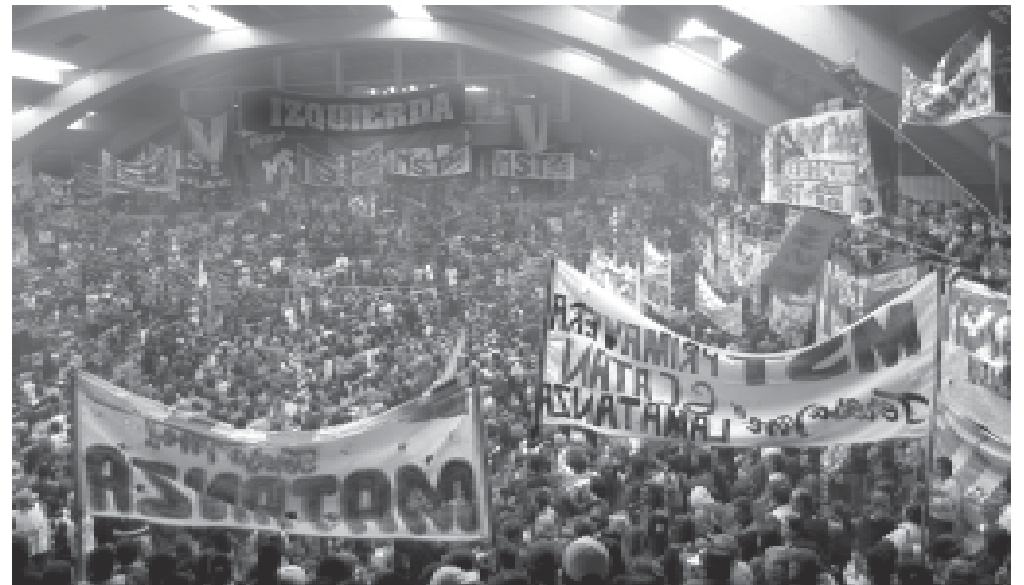
Acto en Ferrocarril Oeste, 1º de Mayo de 2004

Los esfuerzos del MST para avanzar en el crecimiento partidario en el marco de la democracia interna y la elaboración colectiva, para actuar como un solo puño en la lucha de clases, evidentemente llaman la atención. Es difícil, y además no es lo habitual. La experiencia