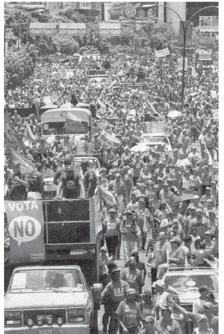
Multitudinario acto por el NO

La batalla por el NO es el centro hasta el 15 de agosto, como defender su resultado ante