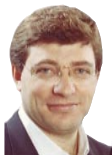
Escribe: Juan Carlos Giordano

Pero desde el arranque, el gobierno ha dicho que va a pagar sí o sí y con reservas. ¿Cuál es la verdadera política del gobierno? ¿Está defendiendo los intereses nacionales o es un doble discurso para esconder más entrega?