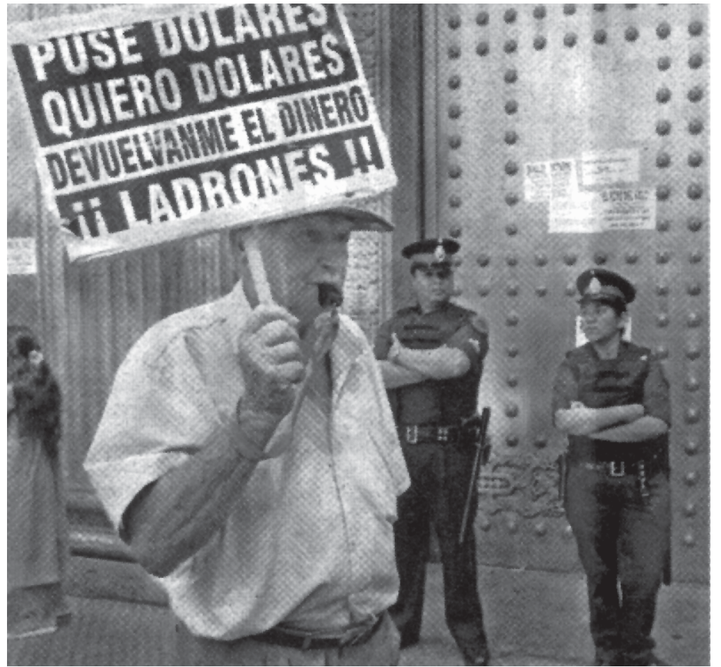
La justicia acomete contra los que luchan dignamente

Al mismo tiempo, el gobierno viene dando un giro. Puso como Ministro de Seguridad y como Jefe de la Federal a hombres de abundantes antecedentes en reprimir protestas so-