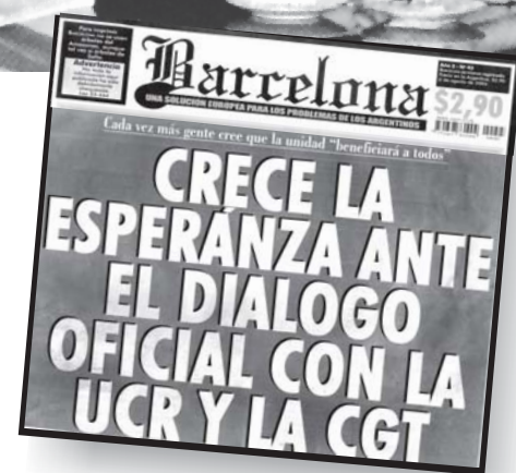
Irónica tapa de la revista Barcelona

Es evidente que muchos luchadores obreros y populares tuvieron y aún tienen expectativas en el gobierno de Kirchner. Sin embargo,