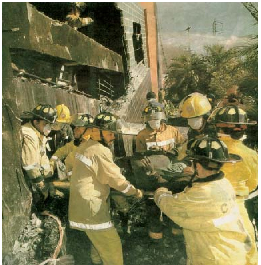
Bomberos rescatando a las víctimas

Porque la vida humana no vale nada. Primero está la ganancia del capitalista del supermercado, primero está el pago de la deuda a la usura imperialista antes que el presupuesto para los bomberos, y podríamos seguir enumerando. Y todo se resume en esa palabra que es la madre de todas las peores catástrofes humanas: capitalismo, la ganancia máxima es lo que importa, y a costa de lo que sea. Al servicio de esta ley suprema se mueve todo el sistema, los jueces, políticos y funcionarios que sirven al capital. Esta locura sólo se puede curar suprimiendo este sistema monstruoso.