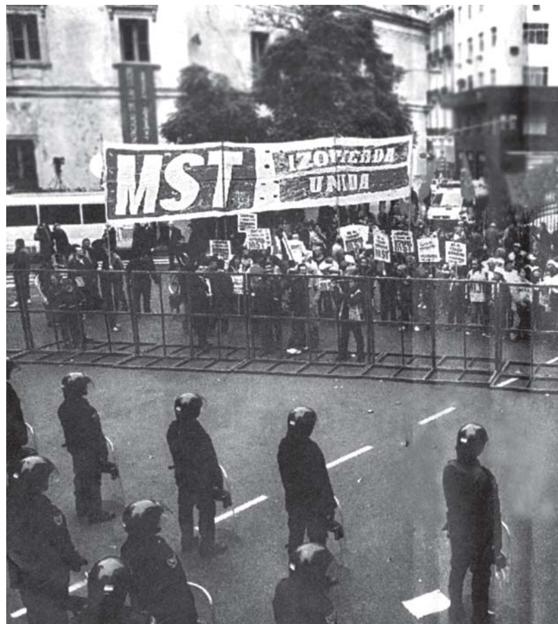
Junto a otras organizaciones, el MST participó de la masiva marcha contra el Código realizada el miércoles 4.

Pero son ellos los que para intentar sesionar tienen que cerrar con vallas todo el centro de la ciudad. Primero montaron una provocación de los servicios, abrieron una crisis en el gobierno nacional que terminó con la renuncia de Beliz, detuvieron compañeros que no participaron de los hechos para ejemplificar y atemorizar a los que luchan. Y no pudieron. Más de 10.000 compañeros se movilizaron cuando volvieron a intentar pro-