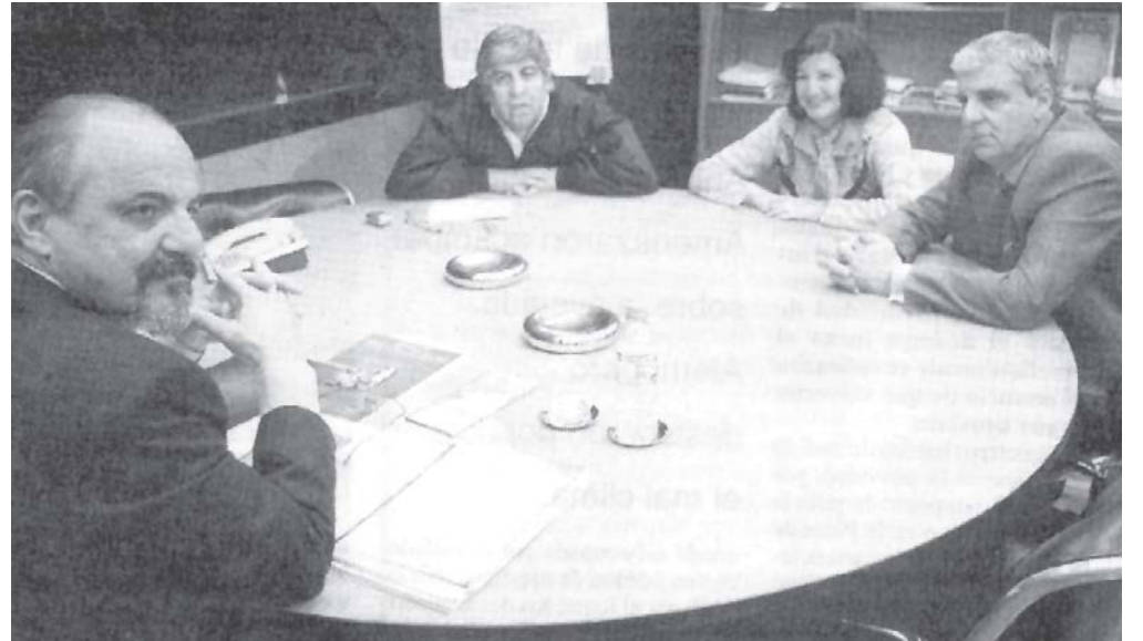
Nada bueno saldrá de esa gran mesa de negociaciones