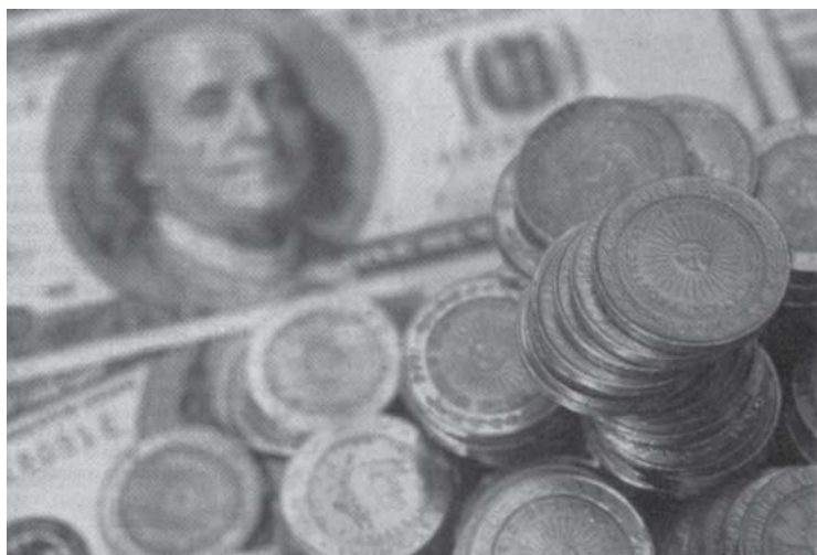
Las multinacionales, en el segundo trimestre, giraron ganancias al exterior por 600 millones de dólares.

Los empresarios rechazan los aumentos salariales y piden aumentos de tarifas en el caso de los servicios. Al mismo tiempo, la mayor parte de las empresas están logrando altas ganancias.