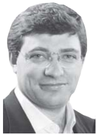
Escribe: Juan Carlos Giordano

Después de más de una década, se va a reunir el Consejo del Salario, organismo encargado de fijar el ingreso mínimo y debatir políticas para dar empleo. Lo integran empresarios, la CGT-CTA-UOM y el gobierno. ¿Qué se puede esperar de estas "negociaciones" a espaldas de los trabajadores?