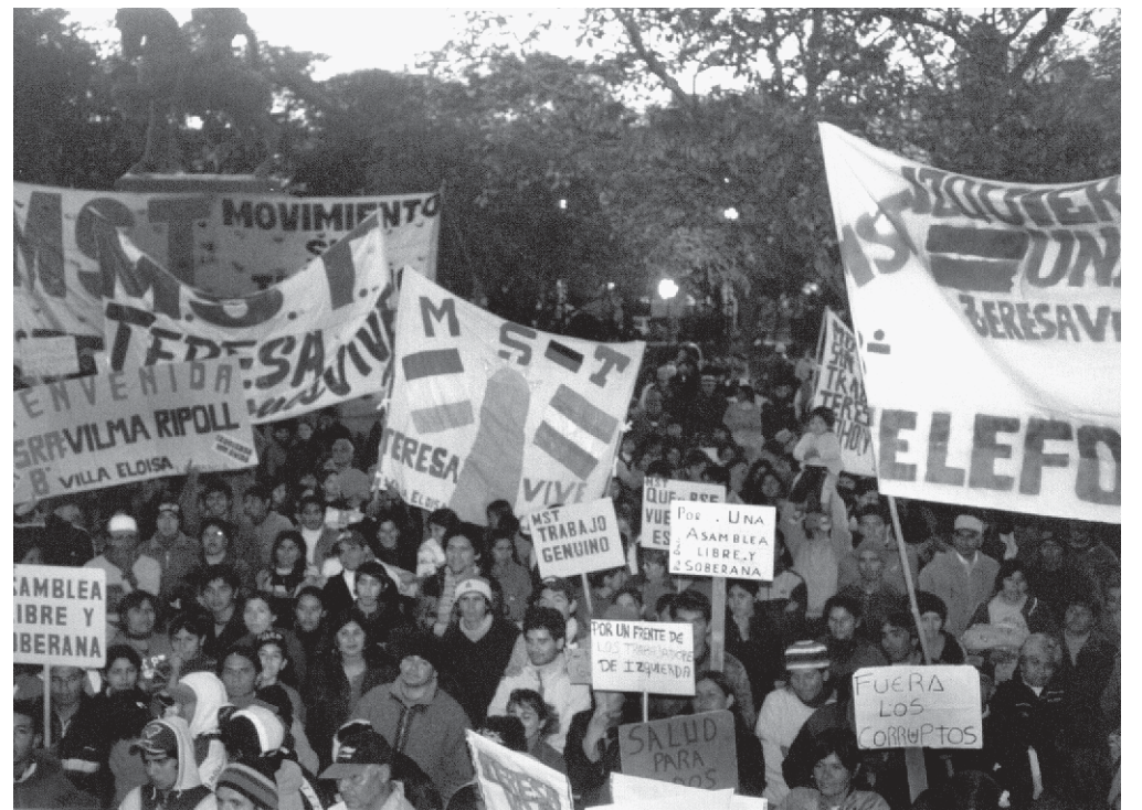
Acto en Plaza Libertad, donde se convocó al encuentro de los luchadores y la izquierda.

Por eso el sábado 4 de setiembre a las 10 hs. en el Club Judiciales, se realiza el Encuentro Provincial de los luchadores y la izquierda, convocado por el MST y el «Teresa Vive».