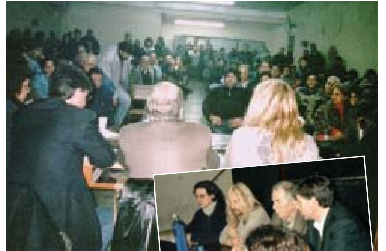
Vista de la charla en Haedo.

Rivas (PS): "Hay que poner freno a la criminalización de la protesta social...Tenemos por delante un gran trabajo militante de concientización. Tenemos que aprender de la derecha cuan-