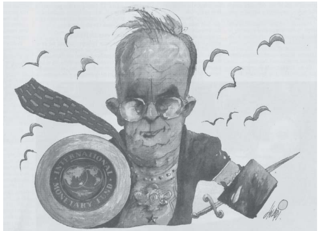
Rodrigo de Rato, titular del FMI.

¿Y con los acreedores privados? Lavagna se guarda una carta bajo la manga: hacerles un pago en efectivo para que acepten la oferta.