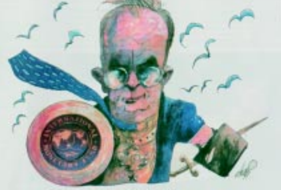
Rodrigo de Rato, titular del FMI

Hasta fin de año el gobierno pagará al FMI casi 8.000 millones de pesos. Con ese dinero se podrían abonar 10 millones de salarios de 800 pesos ó 35 millones de planes sociales de 150 pesos. Se podrían construir 500.000 viviendas creando inmediatamente un millón y medio de puestos de trabajo. Exijamos a la CGT y la CTA un plan de lucha nacional por salarios y planes sociales.