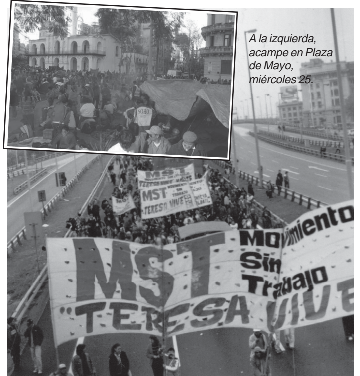
A la izquierda, acampe en Plaza de Mayo, miércoles 25.

Un poco más moderado Kirchner acaba de declarar que hay que «premiar el trabajo y el esfuerzo por encima del clientelismo y las prebendas», pero resulta que en los barrios vemos que mientras a cientos de familias con hambre que no tienen ningún subsidio, los intendentes del PJ o los «piqueteros» kirchneristas siguen entregando a sus amigos planes en la forma clientelar que Kirchner