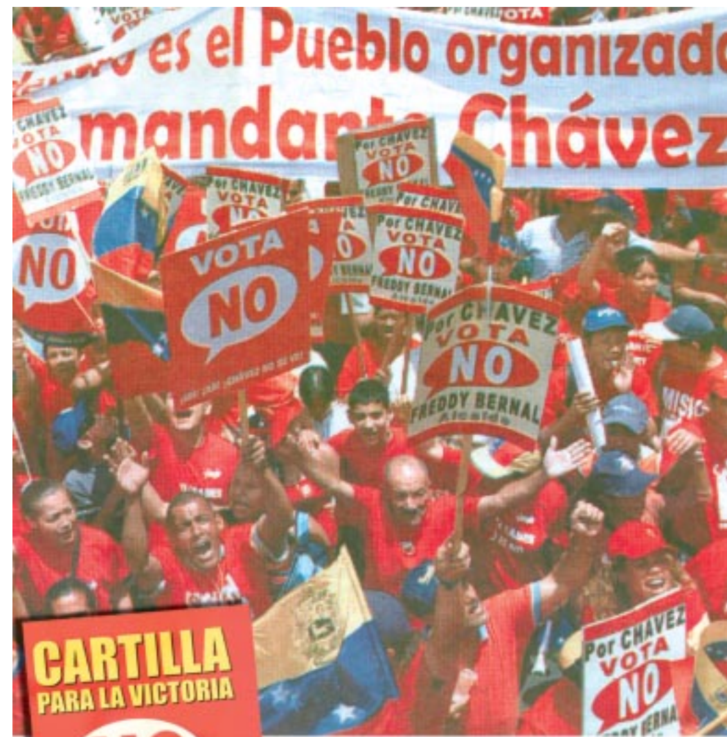
Contundente movilización por el NO