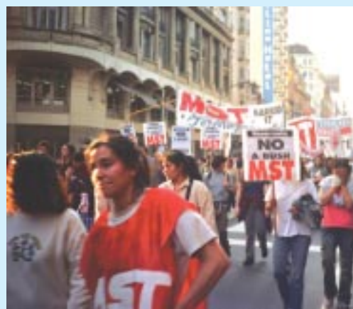
Marcha y acto por el NO en Buenos Aires