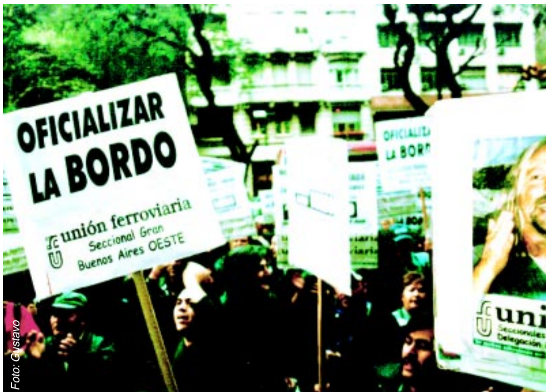
Marcha el 16/9, frente al Ministerio de Trabajo, por la oficialización de la Bordó