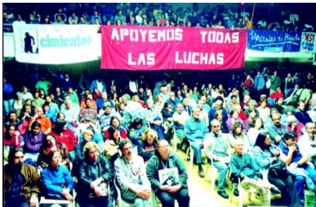
El encuentro se realizó en una Federación de Box repleta. El debate fue seguido con atención.

¡Muerte al capitalismo! ¡Muerte al imperialismo! ¡Viva el Socialismo!