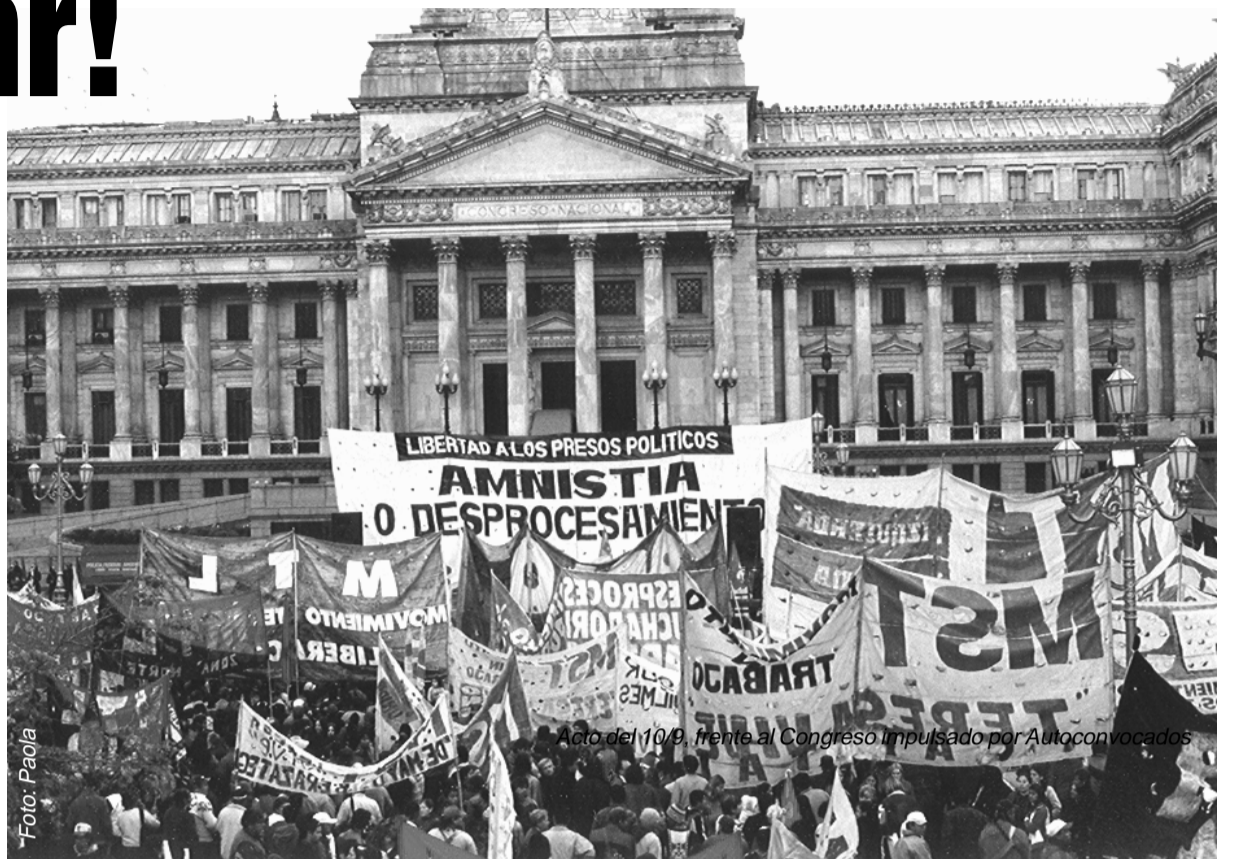
Acto del 10/9 frente al Congreso impulsado por Autoconvocados