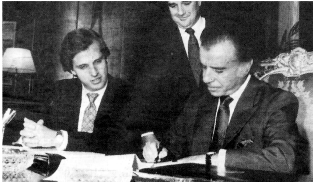
Redrado, el nuevo jefe del Banco Central, designado por Kirchner, cuando era funcionario de Menem

El mismo diario señaló que "el ex presidente Eduardo Duhalde comenzó a discutir con Kirchner en Olivos la arquitectura de esta nueva forma de relacionarse" y Kirchner, en vez de intentar sacarse de encima el peso del aparato del PJ bonaerense, abrió "una etapa de negociación en la composición de la conducción partidaria y en la integración de las listas". ¿Dónde quedó la "guerra" entre Kirchner-Duhalde? ¿Y las peleas entre Solá-Kirchner? Felipe acaba de decir "siempre traté de dejar claro que me sentía parte del proyecto de Kirchner". ¿Y los gritos entre Cristina y Chiche? Efectivamente todo quedó en eso. En una disputa para ver cuál es la mejor figura para recomponer al viejo Partido Justicialista, el mismo que cohabitan el propio Menem, Duhalde, Solá, Cristina, Chiche, los gobernadores e intendentes patoteros y corruptos del conurbano, Kirchner y su delegación pingüina. La prueba está en que ninguno de esos sectores saca los pies del plato. Todos votan las leyes en el Congreso aconsejadas por el Presidente. Y todos van a defender -con discursos populistas, conservadores o de centroizquierda-, al viejo PJ para que sea el vehículo que los siga poniendo como ministros, diputados o funcionarios en los estratos