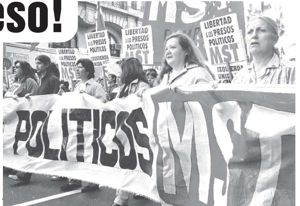
El MST en la marcha del 16/10 a Plaza de Mayo