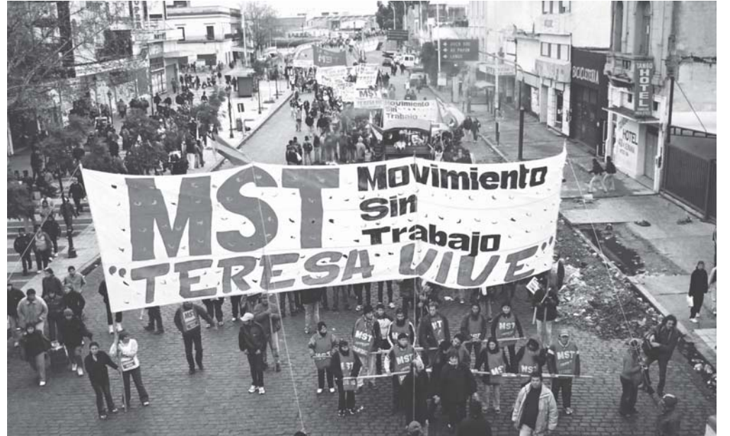
Movilización del 26 de junio 2004.

Van a asignar un tutor cada 50 planes por que "con el seguimiento del control y de la salud de los menores, este programa exige la