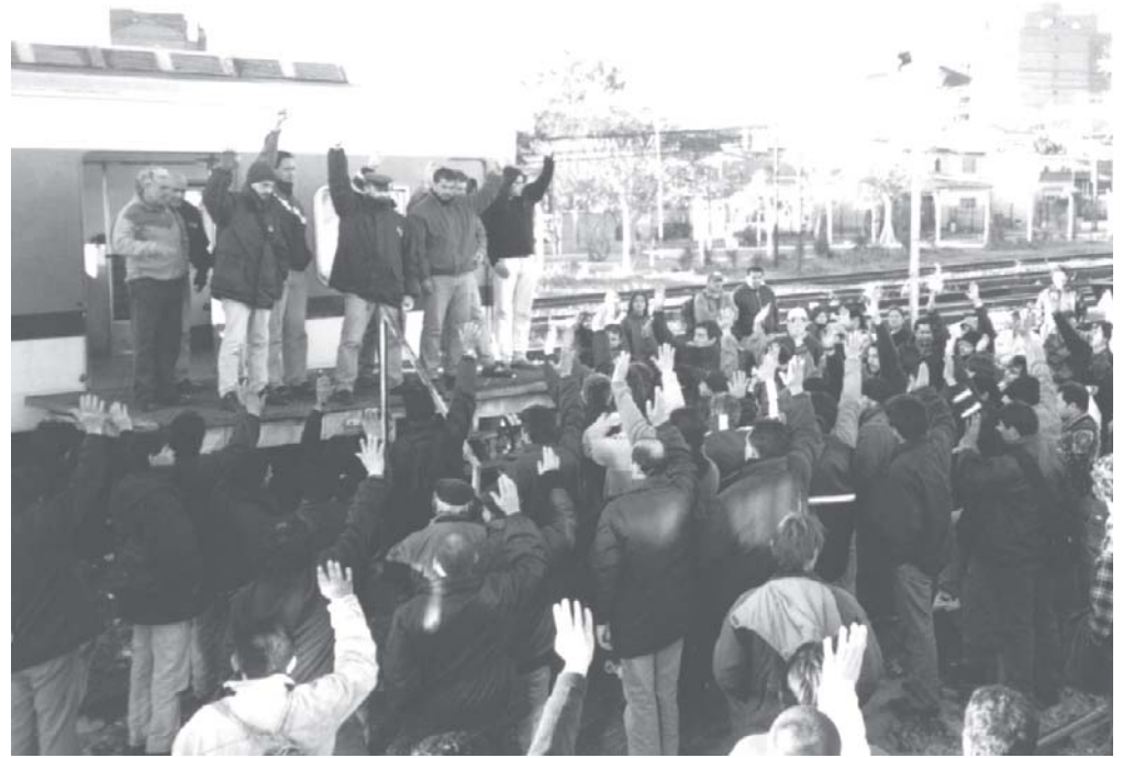
Asamblea en TBA Sarmiento.

Las elecciones fraudulentas del 3 de noviembre no van a cortar el proceso de lucha por lograr nuevos dirigentes que van surgiendo desde abajo. La buena elección realizada por la Bordó en TBA muestra que este proceso está más vivo que nunca.