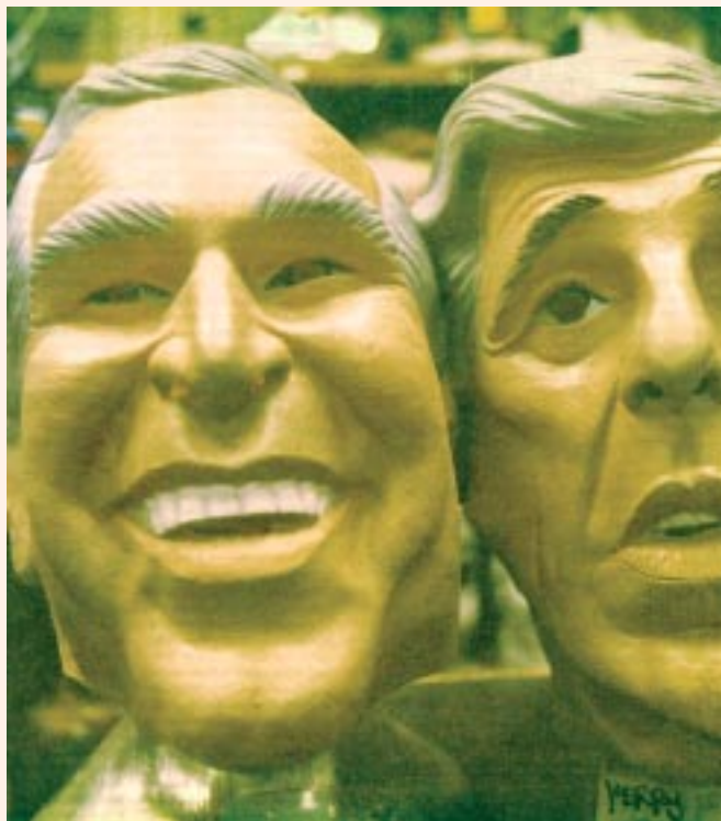
Las dos caras del imperio.

Bush ganó con el 51% de los votos y mayoría en el Colegio Electoral. Se trata del líder más odiado a escala mundial después de Hitler. Su triunfo es percibido como un golpe en contra por los movimientos obreros, populares y antiimperialistas que en todo el mundo enfrentan la política yanqui.