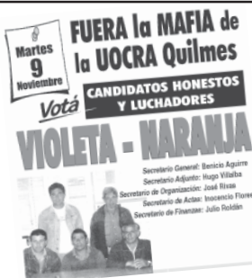
Afiche de campaña de la Violeta-Naranja de la UOCRA Quilmes