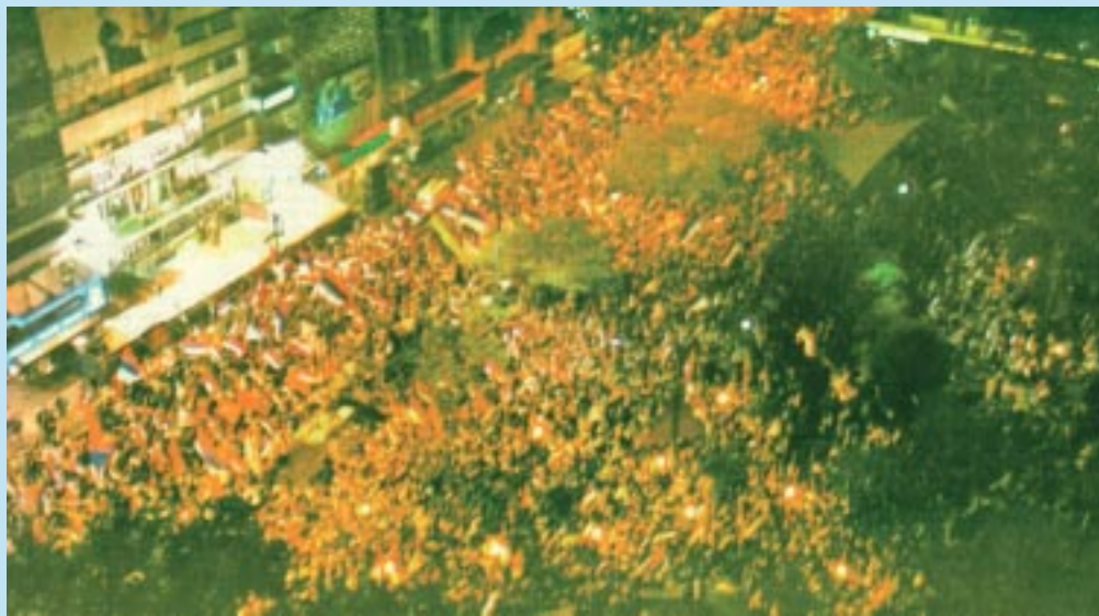
Centenares de miles de uruguayos festejaron en las calles de Montevideo.