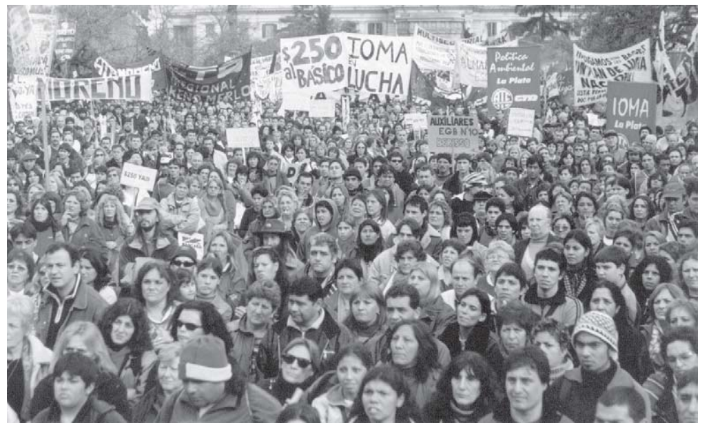
Movilización de docentes y estatales bonaerenses.

El Encuentro aprobó la declaración propuesta por la mesa, que rechaza los proyectos de Solá y el PJ de destrucción del Estatuto y la escuela pública, y exige a la conducción de