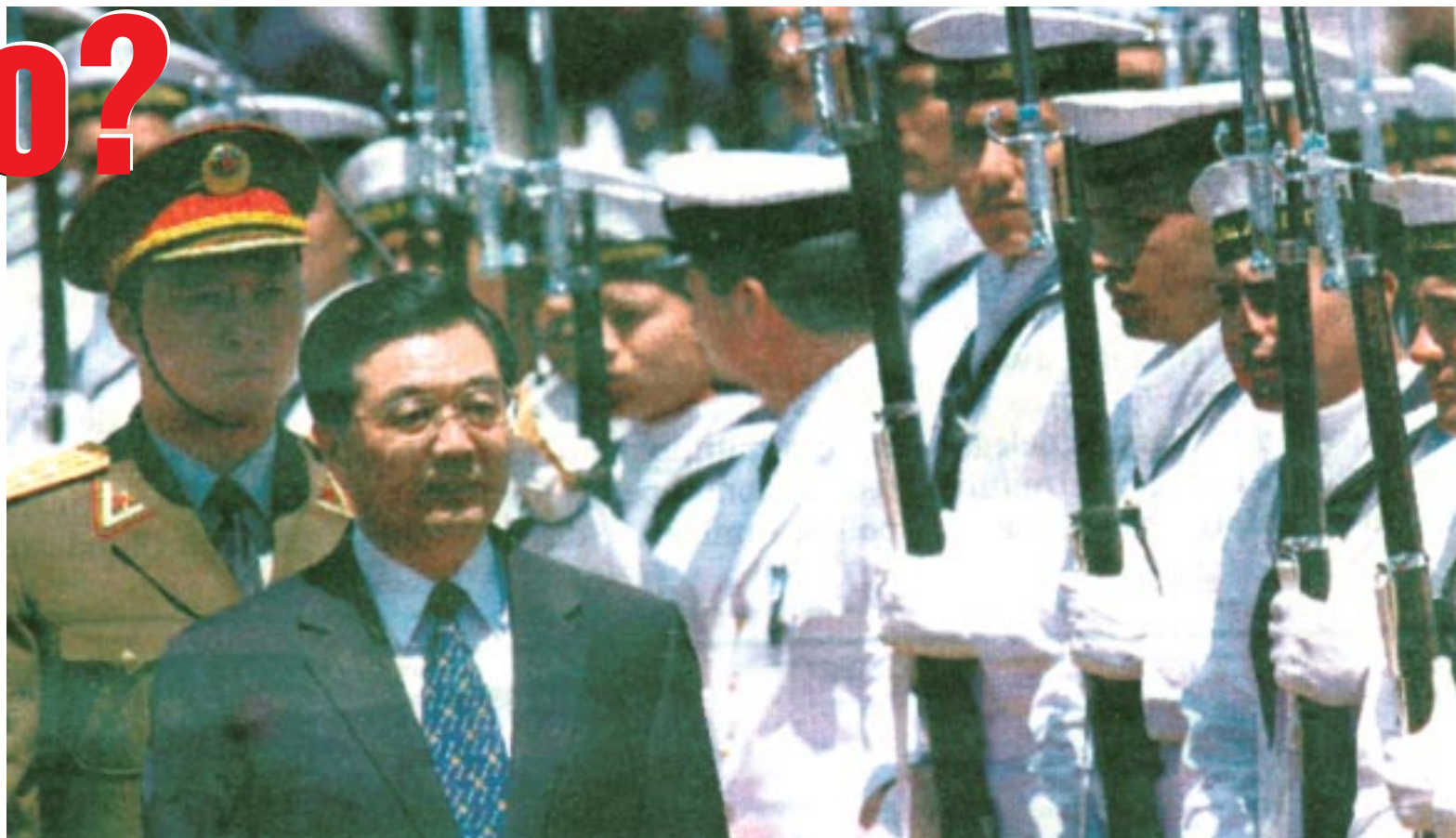
Hu Jintao a su arribo a Ezeiza