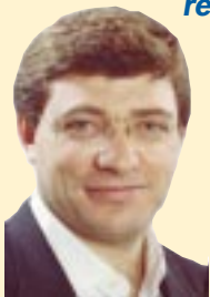
Escribe: Juan Carlos Giordano

Kirchner simuló ponerse "duro" con el FMI, pero está arreglando "sin sacar los pies del plato". Lo mismo sostuvo el economista estrella de Estados Unidos, Paul Krugman, señalando que hay que "pagar al FMI, pero no seguir sus recetas". ¿Se puede seguir con medias tintas? Y si dejamos de pagar ¿qué nos puede pasar?