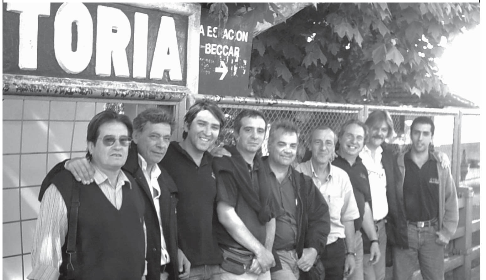
Delegados electos en la Línea Mitre-TBA.

Después de haber ratificado el triunfo de la seccional, ganado las elecciones de delegados, el Cuerpo de Delegados tiene la responsabilidad de darle continuidad al trabajo realizado estos años, organizando la lucha contra el vaciamiento y la inseguridad, las condiciones de trabajo y porque nombren más trabajadores en TBA en vez de meter las tercerizadas. Y avanzar en la coordinación con los compañeros de TBA Sarmiento y con las demás líneas, en la lucha común, por la reestatización de los ferrocarriles y el desarrollo de una nueva conducción democrática y de lucha en la Unión Ferroviaria.