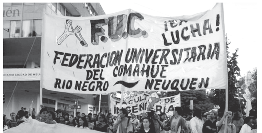
Marcha de la Federación Universitaria del Comahue

Si bien no se masificó la medida como en el '95, ha sido importante la salida hacia fuera, desde