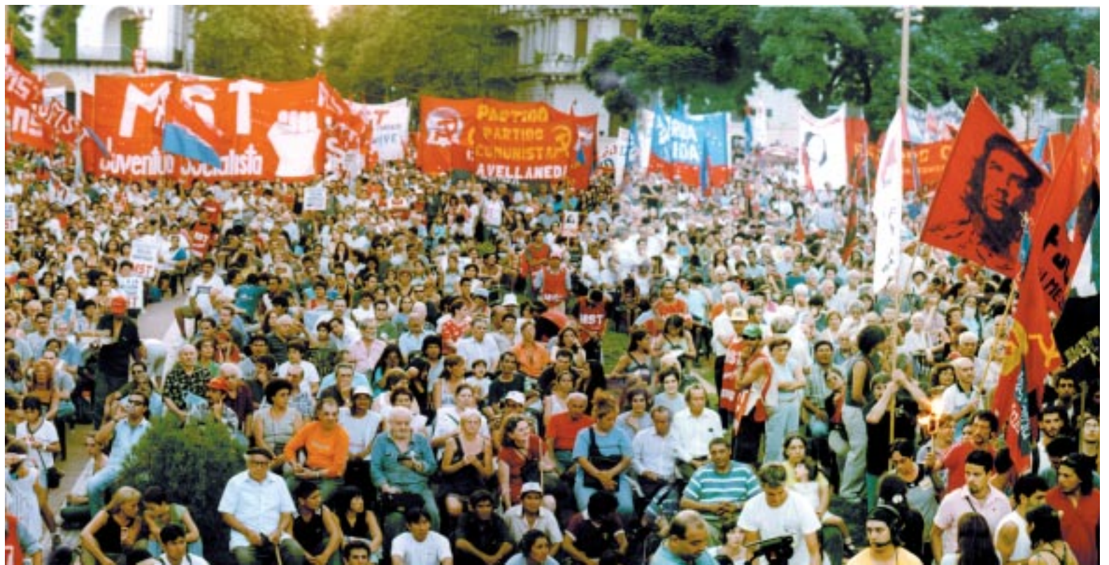
Acto de Izquierda Unida el 9 de marzo de 2003.

Pero es un hecho que con la lucha no alcanza. Por eso el relanzamiento de Izquierda Unida está también al servicio de poner en pie una alternativa política de los de abajo. Una herramienta para que los que luchan, los que se sienten engañados por el doble discurso del gobierno de K, los que tienen bronca y esperan una salida de fondo. A todos ellos y al resto de la izquierda los convocamos a poner en pie juntos una verdadera alternativa política que luche por las salidas de fondo que el país y el pueblo trabajador necesitan. En la calle y también una alternativa electoral que de batalla a los partidos patronales y las falsas alternativas. Queremos avanzar en la posibilidad de construir una unidad superior. Porque creemos que hay puntos programáticos comunes con otras organizaciones, personalidades independientes, grupos y partidos. El no pago de la Deuda, la reestatización de las privatizadas, un plan de emergencia que contemple aumento de salario, jubilaciones, trabajo y salud. Sin ocultar las diferencias e incluso debatiéndolas creemos que es posible avanzar en construir más unidad. Los obstáculos que se presenten se pueden sortear con voluntad política de unirse. Incluso en el tema de los cargos. IU va a dar una muestra de que los cargos no impiden que se puede avanzar en la unidad. El mismo 11 se anunciará el traspaso de la banca que por el MST en Izquierda Unida ocu-