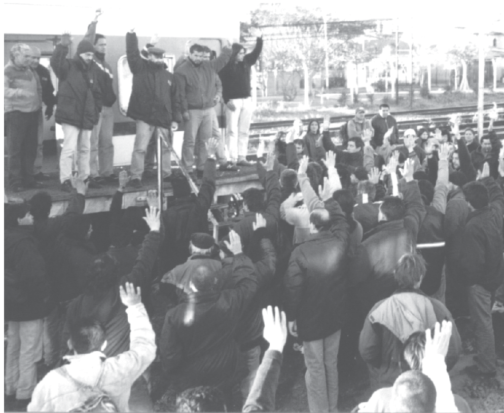
Ferrovianos votando en asamblea

Hoy están luchando por aumento miles y miles como mostramos en éstas páginas. Docentes, telefónicos, judiciales, trabajadores del Subte, ATE, estatales de Neuquén, Salta y otras provincias. Hay un plan de lucha de hecho entre ATE, SUTEBA, judiciales y la Cicop en provincia de Buenos Aires. Los jubilados se movilizan todos los miércoles fren-