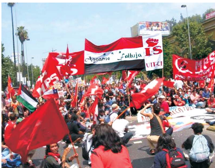
Izquierda Socialista en la marcha de repudio

Lo ocurrido fue una muestra de cómo crece el odio a Bush y al imperialismo yanqui en todo el mundo.