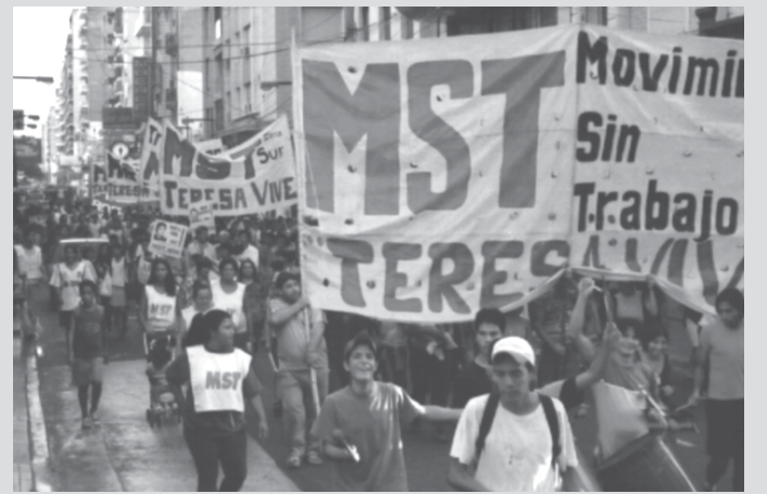
El MST de Rosario, junto a otras organizaciones participó de la numerosa marcha del 17 para repudiar la visita del Rey de España.

órganos de gobierno universitarios, y estudiantiles. Creo que la perspectiva de lucha debe ser a largo plazo y en coordinación con las otras federaciones estudiantiles del país, comenzar a generar debate político y acciones directas que nos permitan por un lado echar para atrás las reformas neoliberales, pero además avanzar hacia la universidad que queremos, una universidad al servicio de la clase trabajadora y las clases subalternas.