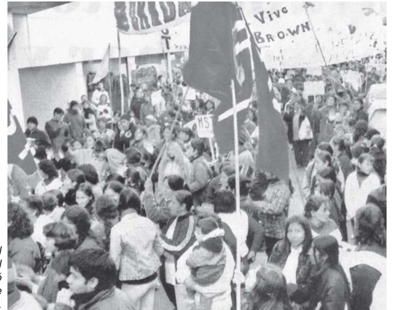
Movilización del miércoles 18 donde el "Teresa Vive" marchó con miles de compañeros.

M.C.: Lo que está sucediendo nunca pasó, es una verdadera revolución desde abajo, cada