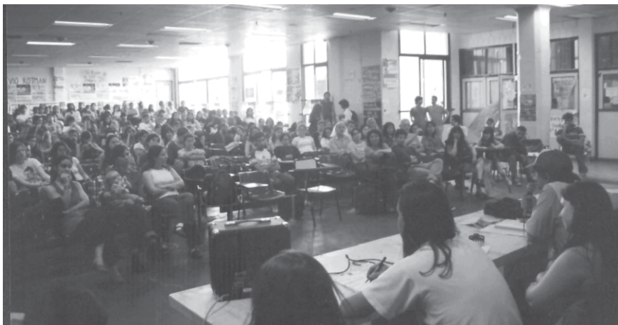
Jóvenes universitarios en una reunión en Filosofía y Letras de la UBA, planificando con el MST "Teresa Vive" su apoyo en los comedores y otras actividades del movimiento en los que colaborarán durante el verano.

¿Cómo pensás que tiene que seguir esta pelea?