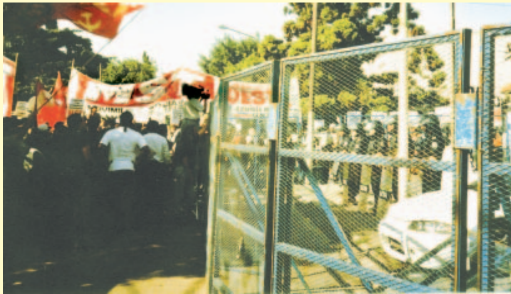
Acto frente a la Comisaría 3ª