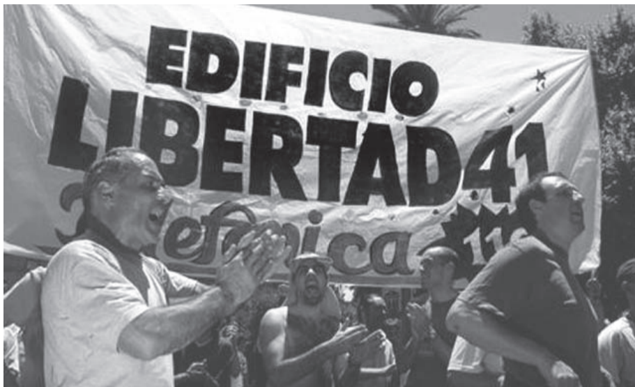
Telefónicos cortando la calle por aumento de salario

nes y los de Telecom $ 132 millones. En la adhesión a los cortes, las movilizaciones, en los cánticos y batucadas, se reflejaba la fuerza que tiene el conflicto. Esa fuerza tenemos que unir, como lo hicimos el martes, en un Plan de Lucha Nacional para torcerle el brazo a las empresas, que no quieren dar respuesta a nuestros reclamos y en cambio quieren utilizar nuestro conflicto para conseguir el aumento de tarifas. Esta debe ser una exigencia a las conducciones de Foetra Buenos Aires y a la Federación que nuclea al interior.