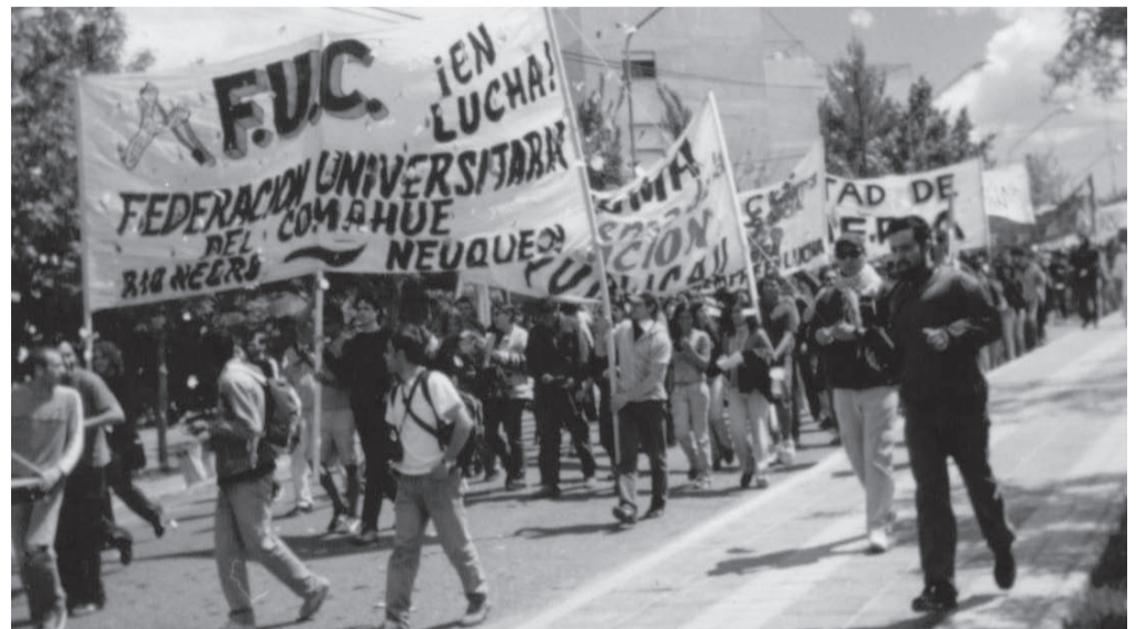
Contra la toma y la movilización se derrotó al Gobierno

Desde la JS del MST creemos que quedó demostrado que cuando se avanza en la pelea por una universidad al servicio de los trabajadores, las instituciones del gobierno se hacen trizas mostrando que estos organismos así no nos sirven y que debemos cambiarlos de cuajo. No sólo echando a los representantes del Repsol del Gobierno universitario como la Pechen, sino también yendo por un plan de lucha nacional de las universidades que exija no sólo la democratización de los órganos de Gob. Universitario sino también por mayor presupuesto educativo, en contra de la LES para