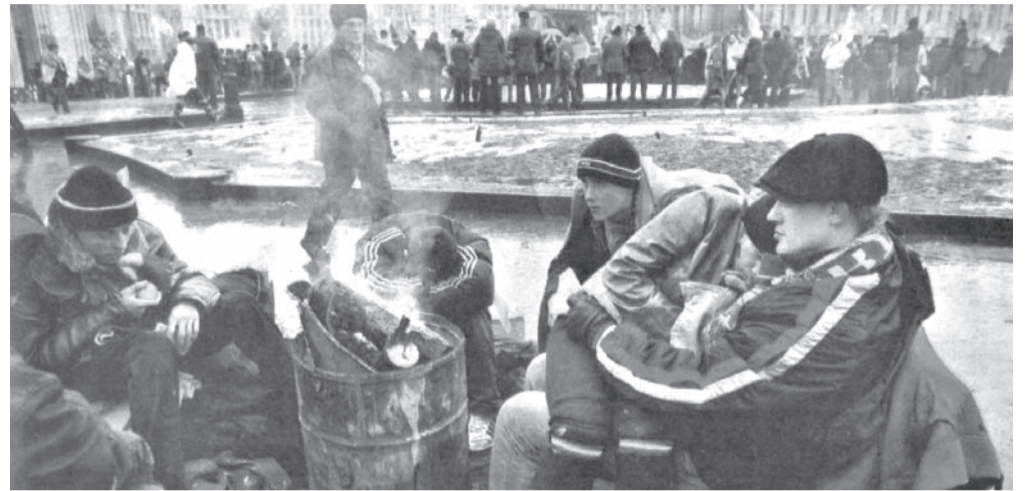
Ucrania. Campamento de los manifestantes.

Gracias a la heroica resistencia de la población ucraniana con sus guerrillas y de todo el pueblo soviético, el nazismo fue derrotado. Por primera vez toda Ucrania se unificó totalmente con la incorporación de la parte polaca, pero esto se hizo con los métodos de la burocracia stalinista y bajo la opresión del Kremlin, impidiendo el libre desarrollo de la identidad cultural y nacional ucranianas, imponiendo el ruso en las escuelas.