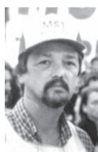
Escribe: Gustavo Giménez

Aumentan la canasta navideña, los cigarrillos, los taxis, el gas oil, la yerba, etc. y los artículos de la misma marca varían hasta en un 40 % entre distintos lugares de compra. La disparada de los precios de fin de año amenaza devorar los insuficientes aumentos de salarios y montos fijos por única vez en jubilaciones y planes, arrancados al gobierno y las patronales con muchas luchas. Las mesas de muchos hogares pobres estarán vacías frente a la intransigencia de este gobierno de aumentar los míseros $150 del plan a $350 como lo reclaman millones de desocupados.