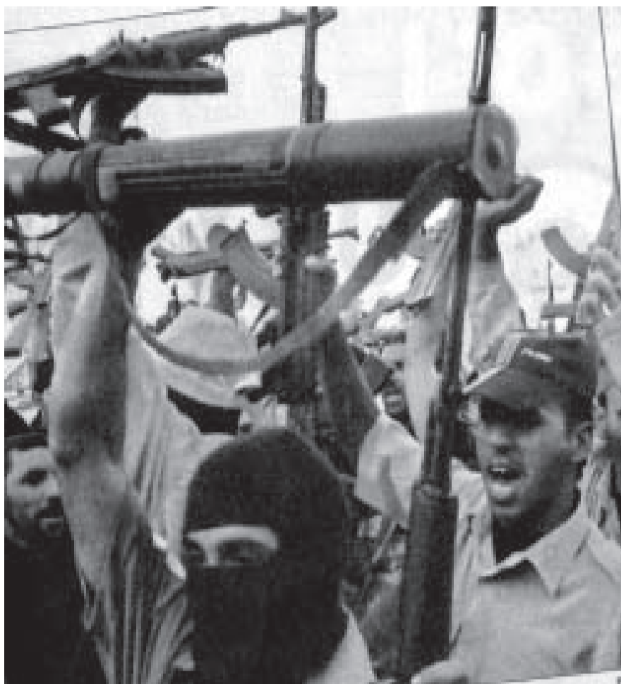
"Bassora. Milicianos armados confraternizan con policías que se unieron a la resistencia en mayo."

La mitad de los 2.800 millones de trabajadores del planeta son pobres, no ganan ni para