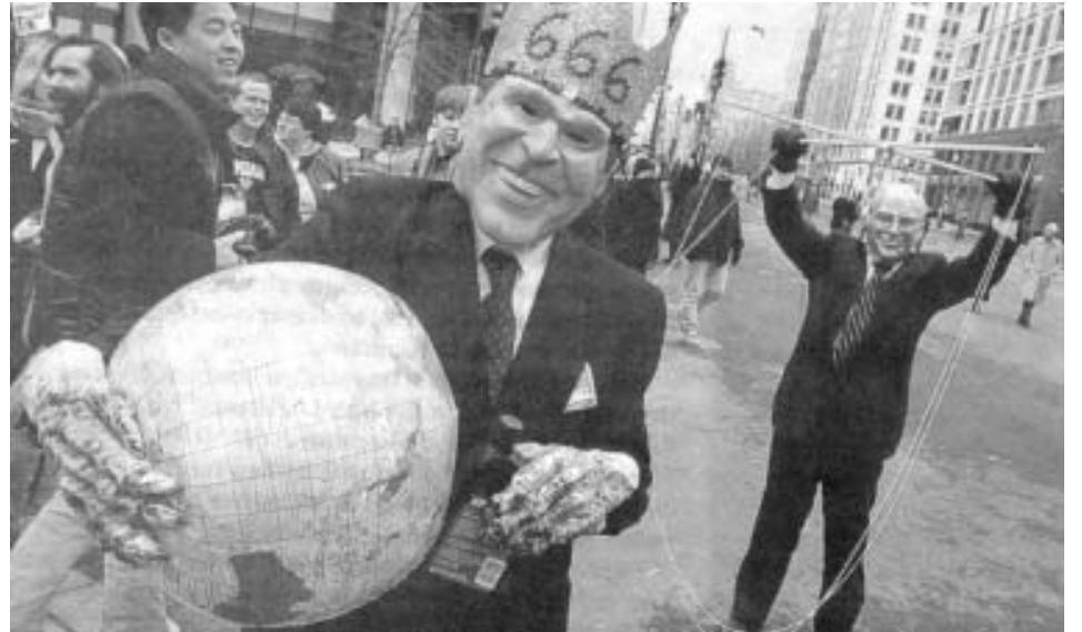
Son cada vez más los manifestantes anti-Bush

Y en Estados Unidos, Bush sube con él más bajo índice de popularidad que haya tenido presidente alguno al asumir, el 52%. Al mismo tiempo solo un 45% considera que el país está yendo en una dirección correcta, el 52% cree que la invasión de Irak fue un error y el 48% está contra la privatización del sistema de pensiones y salud. Esto es así pese a los esfuerzos del otro partido imperialista, los derrotados demócratas, y su candidato Kerry que llamaron en conjunto con Bush a "unificar al país", después de las elecciones.