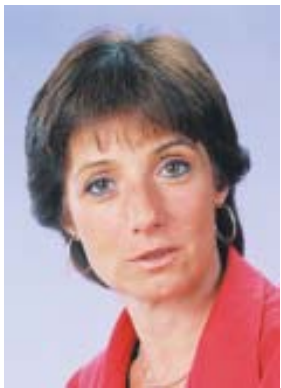
Escribe Vilma Ripoll

Importantes Barrios de la zona sur de la Capital y distritos del conurbano bonaerense como Lomas de Zamora, sufrieron la falta de agua en los días más calurosos de este enero caliente. Es que Aguas Argentinas nunca cumplió con el llamado "Plan Director" contemplado en el contrato de concesión que justamente la obliga a realizar las obras necesarias para que estos cortes ni falta de suministro se produzcan. Igual que el resto de las privatizadas, Aguas Argentinas, gana miles de millones con tarifas altísimas y no realiza nunca las inversiones a la que se compromete. Cuando se produce la crisis, termina pagando el pueblo. Sucede con los Subtes, con los Ferrocarriles, con la Electricidad y todas las privatizadas. En los 90' para justificar las privatizaciones se dijo que daban malos servicios y enormes pérdidas. Pero la verdad es que hoy mismo las privatizadas reciben subsidios multimillonarios que van a parar a los bolsillos de los empresarios, tal el caso del Subte que recibe un subsidio de 60 millones de pesos por gas oil y hace años que no realiza el mantenimiento de las formaciones.