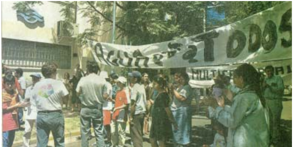
20 de enero: vecinos de Lomas de Zamora reclaman la reestatización de Aguas Argentinas.

El presidente Kirchner con una importante comitiva que incluyó a gran parte de su gabinete visitó en Francia al presidente Chirac, para luego recibir en Buenos Aires al presidente español, Rodríguez Zapatero. El tema excluyente de las dos reuniones y la agenda desplegada por Kirchner fue resolver el tema de las empresas privatizadas. En especial el caso de Aguas Argentinas, una empresa con mayoría del grupo francés Suez pero con una importante participación española a través de la compañía Aguas de Barcelona. El resultado de estas reuniones como es de imaginar significa una nueva vuelta en la entrega del patrimonio nacional a grandes grupos extranjeros.