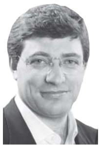
Escribe: Juan Carlos Giordano

Kirchner lanzó el canje de la deuda para empezar a pagar los 81.200 millones de dólares que están en default desde el 2001. Para ello salió a convencer al mundo de la oferta mejorada que originariamente había lanzado en Dubai. Con menos quita, pago de más intereses y una hipoteca que sufrirán varias generaciones, el plan echó a andar. ¿En qué consiste? ¿Serán beneficiados los trabajadores y el pueblo? ¿Argentina está negociando de pie, como dice el presidente, o seguiremos arrodillados ante los acreedores extranjeros?