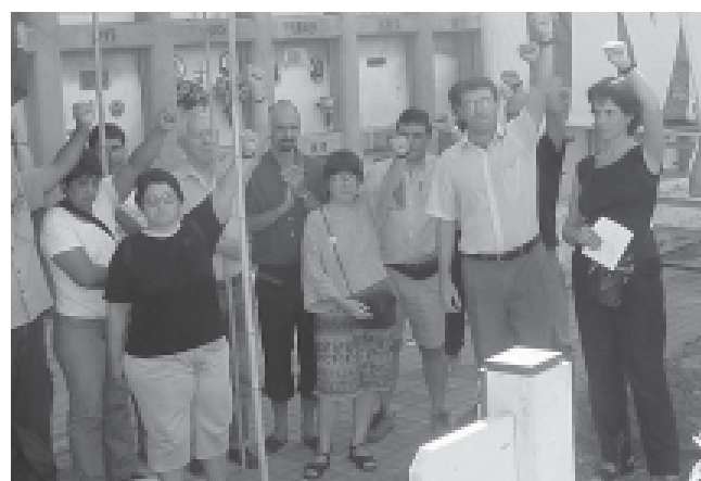
Homenaje, frente a su tumba, en la Chacarita este 25 de enero

Apostar a la Unidad de nuestro partido y la Internacional, es la tarea de la hora. Ese es nuestro objetivo y compromiso. El que asumimos y ratificamos a 18 años de la muerte de quien fuera nuestro gran maestro. Compañero Moreno, le decimos ¡Presente!