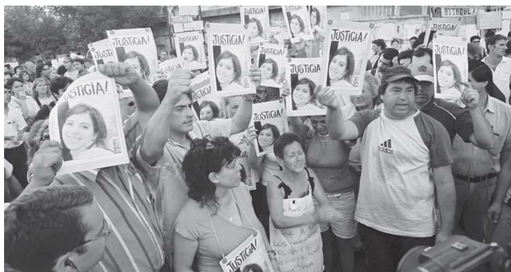
Familiares en acto en Plaza de Mayo

“Kirchner nos faltó el respeto, se borró, le faltaron huevos. No estuvo, se quedó disfrutando del frío del sur. Muchos de nuestros