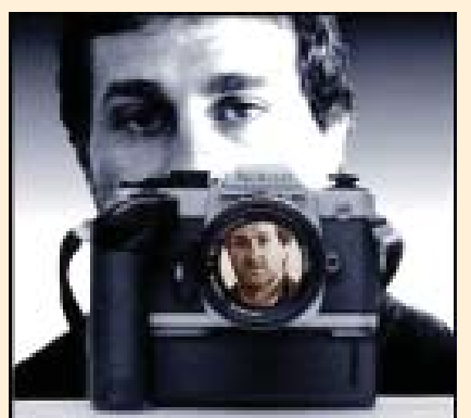
José Luis Cabezas

El caso Cabezas se ha convertido en otro ejemplo más de una Argentina en la que la impunidad es una realidad cotidiana.