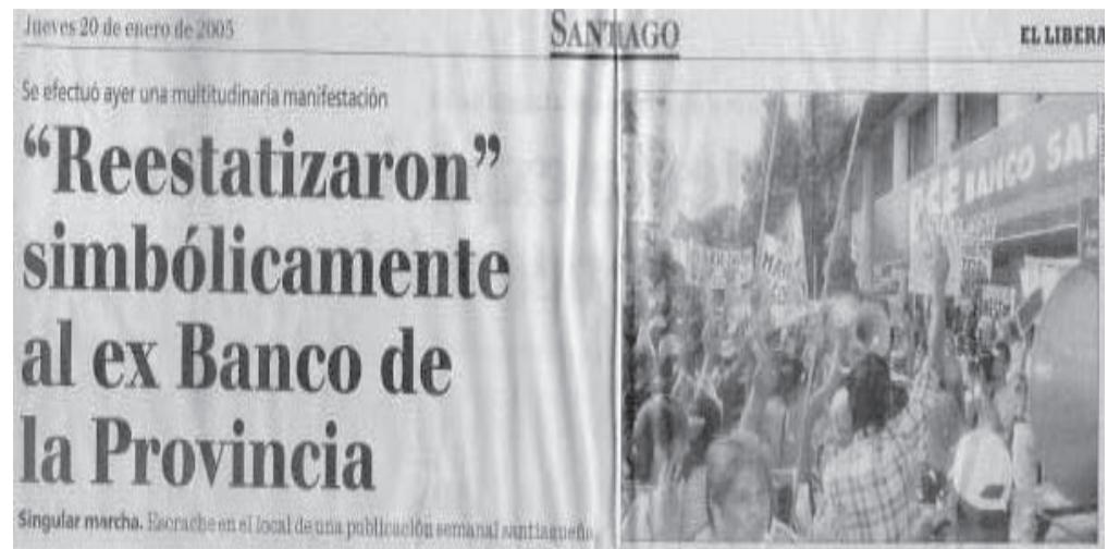
Diario El Liberal, 20/01/05 Multitudinaria manifestación. Asamblea callejera “reestatiza” el Banco

A diferencia de los viejos políticos corruptos del PJ y la UCR, desde Izquierda