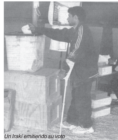
Un Irakí emitiendo su voto