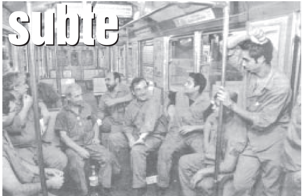
2 de febrero, trabajadores del subterráneo durante el paro.

Lo mismo que dije estos días: le agradecemos que se hayan involucrado a último momento, pero nosotros somos orgánicos de las bases y no de la conducción. Todo se fue votando en asambleas de base y después consensuamos en el Cuerpo de Delegados, que era abierto a las comisiones paritarias. Tuvimos muchas discusiones, pero siempre se buscó la unidad. Y para nosotros ya es costumbre que las bases decidan. Por eso en la asamblea los compañeros, a pesar de que la UTA haya firmado este acta a espaldas nuestras, evaluaban el contenido de lo que se logró.