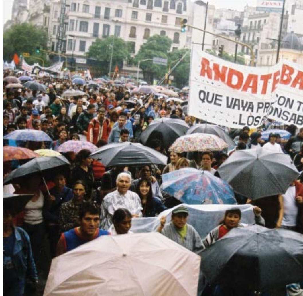
Vista parcial del acto del 30, en Plaza de Mayo, a un mes de la masacre.

Aníbal Ibarra quiere enfrentar la crisis desatada por la masacre desesperada, un fraude, un referéndum revocatorio que es una impunidad del Jefe de Gobierno y todos los responsables. Deso llamamos a repudiar esta nueva maniobra y a no firmar pa acompañando la movilización y todas las acciones que proponga los jóvenes, es el camino para conseguir p