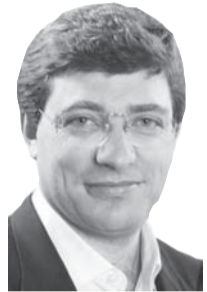
Escribe: Juan Carlos Giordano

Con el canje, desde la Casa Rosada nos quieren vender que un ministro "talentoso" como Lavagna, junto a un presidente con "capacidad de decisión", han encontrado la solución al problema de la deuda externa. Menem y Cavallo con la convertibilidad nos decían lo mismo. Otro tanto De la Rúa. Ahora es el turno de Kirchner-Lavagna, que siguen los pasos del repudiado Cavallo. Y en algo lo superaron: Lavagna es el ministro que más pagó hasta ahora.