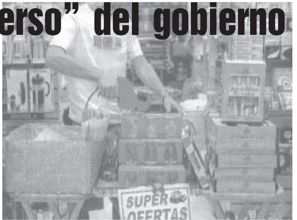
Vuelven los tiempos de la remarcación de precios.

Y el aumento salarial es muy relativo y variable, en una economía con gran proporción de trabajadores “en negro” o con nuevos empleos basura con salarios bajísimos y condiciones de flexibilización que hacen que no se paguen horas extras, ni ningún otro beneficio. Es cierto que en algunos oficios y en los sectores que los trabajadores se organizaron y pelearon, consiguieron en muchos casos aumentos significativos. Aún así, casi invariablemente están detrás de la inflación real.