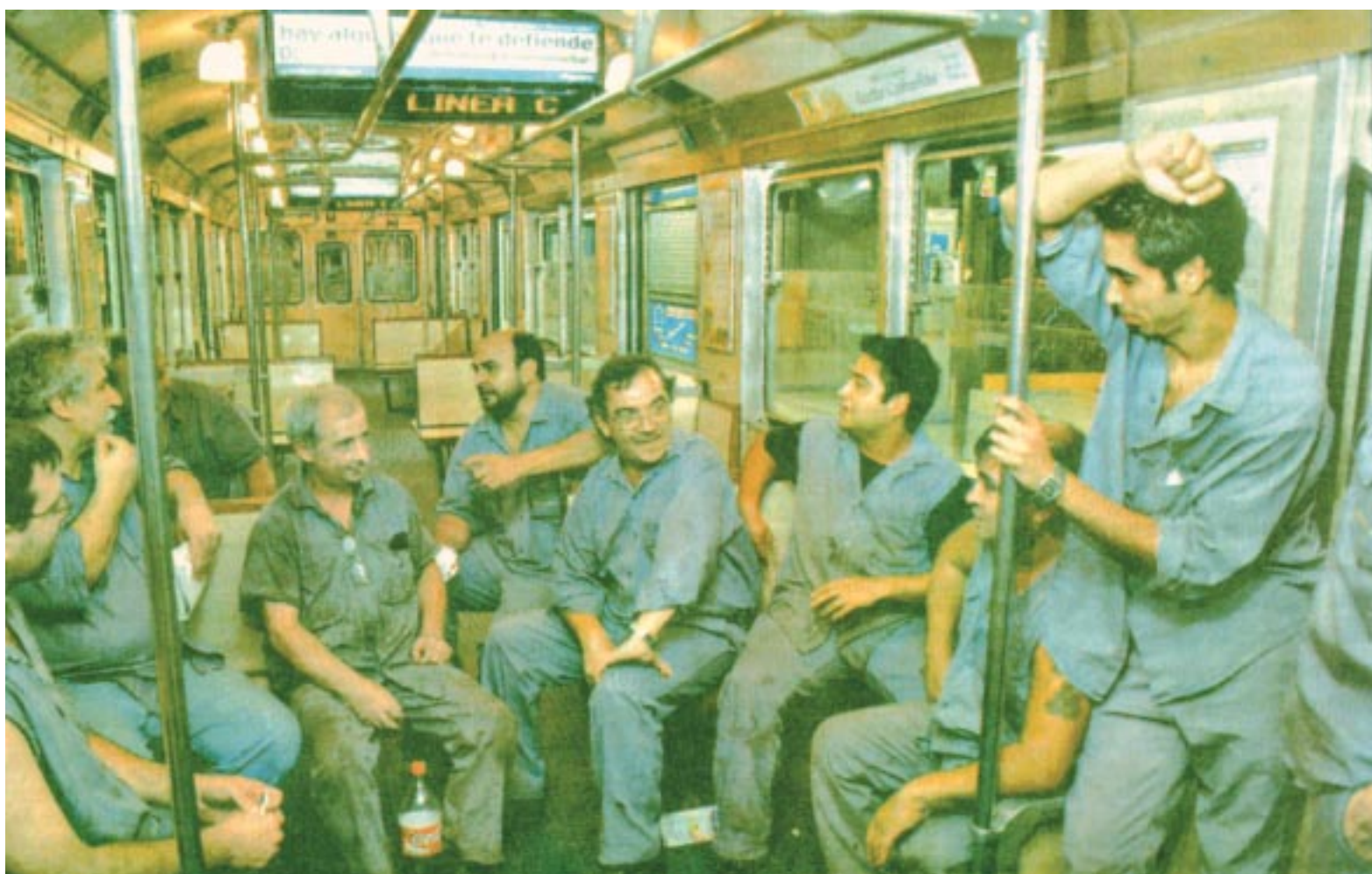
Trabajadores del taller Constitución, un bastión de la lucha del subte.

ca cuidar la salud de los compañeros, tener la jubilación anticipada y evitar que un sector de boleteros nuevos haga extras. También hay que seguir junto a los compañeros de Taym , la tercerizada de limpieza, en lucha por sumarse a nuestro convenio. Otra exigencia importante es que se solucione la inseguridad , que pone en riesgo nuestra vida y la del usuario. Y además vamos a debatir cómo mejorar nuestra organización en el subte, ya que en junio tenemos las paritarias por el convenio y porque al ser oposición dentro de la UTA necesitamos fortalecernos.