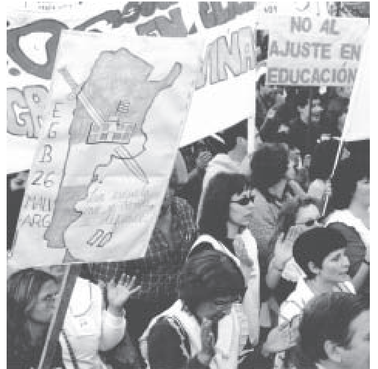
Marcha docente en defensa de la escuela pública.

Desde Docentes en Marcha creemos que se puede romper el candado salarial si junto a la base de estos gremios empujamos por constituir