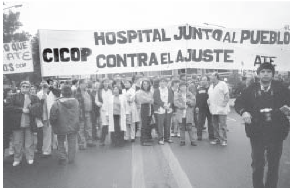
Una vez más, la CICoP sale a reclamar por el salario y el hospital público.

Sin embargo, el mismo diario traduce la preocupación del gobierno porque se viene una "escalada de reclamos". No es para menos. Porque estatales y docentes seguimos bajo la línea de pobreza. Porque los profesionales de la CICoP vamos por lo que nos robaron y exigimos un salario de ingreso de $ 1560. Porque los 1150 compañeros de los hospitales de