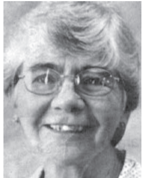
Dorothy Stang, la monja asesinada por defender a los campesinos sin tierra.

Para que ese acto de violencia no termine en la impunidad como tantos otros, se hace necesario formar una Comisión Independiente de Investigación, constituida por los sindicatos de trabajadores rurales de Anapu y Altamira, por familiares y colaboradores de la víctima, por la Sociedad Paraense de Derechos