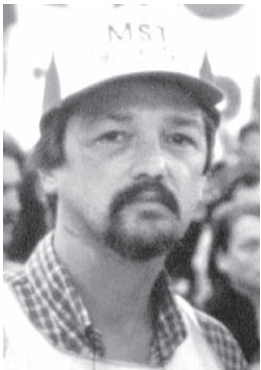
Escribe Gustavo Giménez

Cuando escribimos estas líneas el gobierno aprovechando la lamentable acción de la CTD-Quebracho contra un automovilista, ha retomado la ofensiva contra el movimiento piquetero. Su campaña no sólo persigue intimidar a los que luchan contra su política de hambre y miseria. También pretende distraer la atención sobre los la grave situación que atraviesan millones de argentinos sin trabajo o con los sueldos por el piso, que ha generado una importante oleada de luchas salariales entre las que se destaca la del Subte, y sobre los recientes hechos de corrupción que como Cromagnon o las "valijas voladoras" cuestionan a sus funcionarios de primera línea.