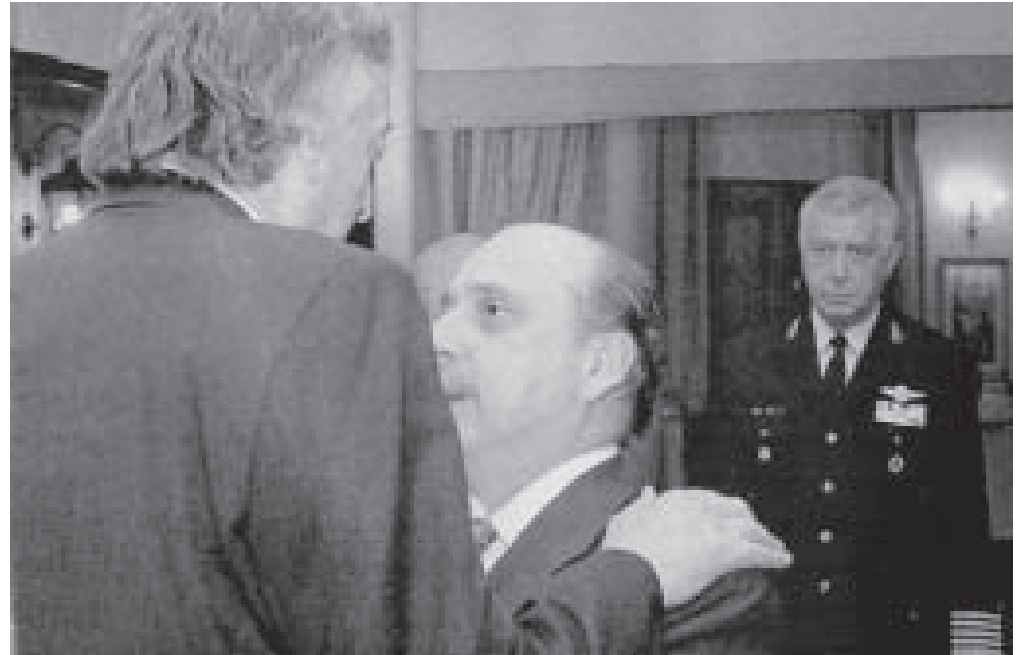
Kirchner salvando al ministro Pampuro