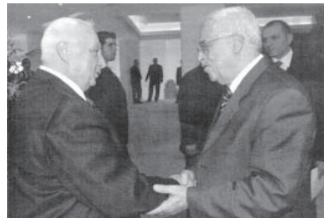
Sharon y Mahmud Abbas sellan el acuerdo con un apretón de manos

No se habló de los temas de fondo: que pasa con Jerusalén Este, si Israel seguirá construyendo el muro de la vergüenza que roba nuevos territorios palestinos; ni, menos, el derecho al retorno de los 5 millones de palestinos expulsados de sus tierras en el actual Israel. Todo eso se dejó “para después”.