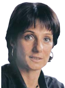
Escribe: Vilma Ripoll

A poco de empezar, a Ibarra no le va bien juntando firmas. Muchos ven al plebiscito como una maniobra para tapar el tema Cromañón y quedarse. Pero si Ibarra continúa en el poder, hará de todo para seguir impune. No le firme. Si derrotamos la trampa, estaremos más fuertes para luchar por que haya justicia e Ibarra vaya preso con Chabán y todos los culpables.