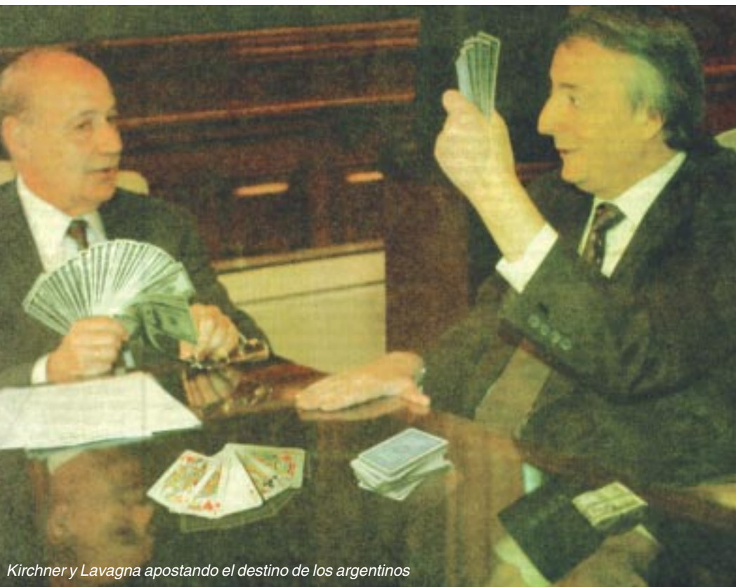
Kirchner y Lavagna apostando el destino de los argentinos

Estos ítems siempre significaron lo mismo: imponer brutales exigencias de pago, privatizar el Banco Nación, aumentar las tarifas de las empresas privadas y ajustar en las provincias.