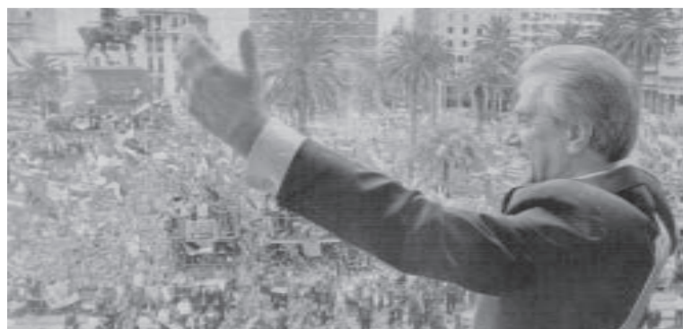
Tabaré Vázquez habla en el acto de asunción en Montevideo.

El MST y la UIT (CI) han enviado sus condolencias al PC chileno. Nos unimos desde estas páginas al recuerdo de Gladys y comprometiendo el mejor homenaje que podemos hacerle: seguir la lucha por el castigo a todos los genocidas y por los derechos sociales de los trabajadores.