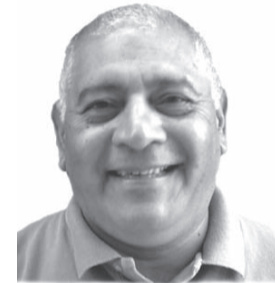
Escribe Mario Castillo

El 27 de febrero se realizaron las elecciones para elegir gobernador y vice, 50 diputados provinciales y comisionados municipales en Santiago del Estero. Se impuso el Frente Cívico por Santiago, encabezado por el intendente radical de la Capital Gerardo Zamora, con 159.088 votos (46,77%). El dato político de la elección, fue la derrota del PJ, que gobernó la provincia durante muchísimos años. La lista de Pepe Figueroa y Humberto Salim, apoyada por el interventor Lanusse y por todo el gobierno nacional de Kirchner, obtuvo 135.494 votos (39,83%). El PJ siempre fue el gobierno de la provincia. Una sola vez en la historia, en la década del 60, la UCR ganó la gobernación con Benjamín Zavalía (el padre del actual senador radical). La debacle electoral del PJ profundiza la crisis que este partido arrastraba desde la caída del juarismo. El movimiento de masas utilizó a Zamora como una herramienta para impedir que el PJ vuelva al gobierno provincial.