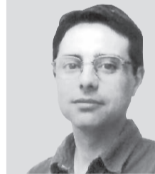
Escribe: «Bocha» Calo

Hay un dicho que dice: «no conviene vender la piel del oso, antes de cazarlo». Esto parece ser lo que le ocurrió al interventor kirchnerista Lanusse y al gobierno nacional del PJ. Aseguraban que ganaban, gastaron un dineral, vino Scioli y casi todo el gabinete, Figueroa se sacó la foto con Kirchner y terminaron perdiendo por 7 puntos. Y encima a manos de un Frente que encabezaba Gerardo Zamora, el intendente radical de la capital de la provincia. Solo los memoriosos recuerdan que la UCR ganó una elección de gobernador en los años 60. Santiago del Estero siempre fue una provincia gobernada por el justicialismo. Carlos Juárez ya era gobernador en los años 50, bajo el primer gobierno de Perón.