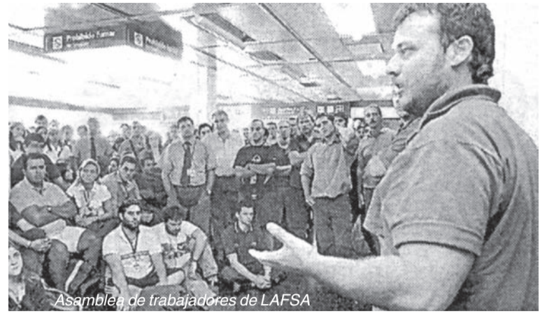
Asamblea de trabajadores de LAFSA

En el año 2003 los trabajadores de LAPA y DINAR protagonizaron una gran lucha: ante la quiebra de las empresas, impusieron la creación de LAFSA y conservaron la fuente de trabajo. Kirchner les prometió una compañía aérea verdadera y no cumplió. Con el escándalo por el tráfico de cocaína en Southern Winds vuelve a aparecer la amenaza concreta de la privatización y los trabajadores se preparan para enfrentarla