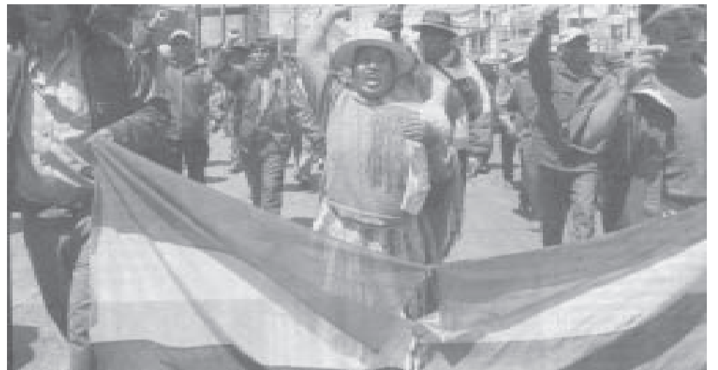
Manifestación de huelguistas en El Alto.

Con su maniobra Mesa logró que un sector urbano de clase media saliera a apoyarlo. Y