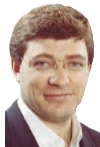
Escribe: Juan Carlos Giordano

El Canje, fue saludado y defendido por un variado arco de empresarios, banqueros, organismos financieros internacionales y políticos de todo pelaje. Desde la presencia personal en el Salón Blanco donde se dio el anuncio y largos fax, mails y llamados telefónicos del exterior, apoyaron la medida la Unión Industrial Argentina, con costosas solicitudes; representantes de Arcor, Coto, Techint y otros empresarios chupasangres; la cúpula de las Fuerzas Armadas y la Iglesia; Menem, Alfonsín, De la Rúa, López Murphy, pasando por Carrió y el corrupto Aníbal Ibarra. Banqueros (de los nacionales y extranjeros), diputados y senadores del PJ y UCR, la CGT, el BID y el Banco Mundial. Hasta estuvo el infante Luis D'Elía de la FTV-CTA. La nota se la llevó el FMI, que habló de "un paso importante".