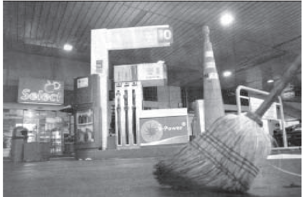
Hay que barrer a la Shell, Esso y todas las petroleras

Pero hay más. El ministro Aníbal Fernández señaló: “Decirle a un ciudadano: no le com-