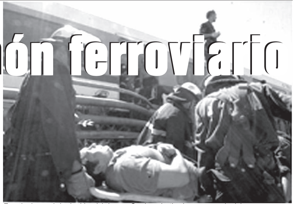
Es retirado uno de los heridos del choque. Con las privatizadas no se puede viajar seguro.

La empresa a los cinco minutos del choque de trenes dijo que la falla era "humana", acusando a los trabajadores. El colmo de todo esto es que la CNRT, a las pocas horas, avaló lo dicho por la empresa, pero no tuvo la misma