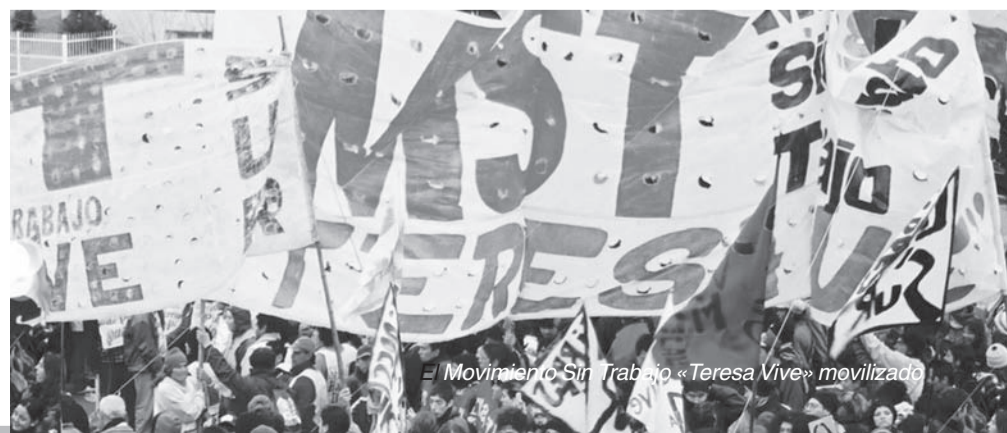
El Movimiento Sin Trabajo «Teresa Vive» movilizándose

Desde el MST "Teresa Vive" hacemos un llamado a todas las organizaciones a unirse para lanzar una gran marcha por el aumento a $350-, la universalización y trabajo para todos.