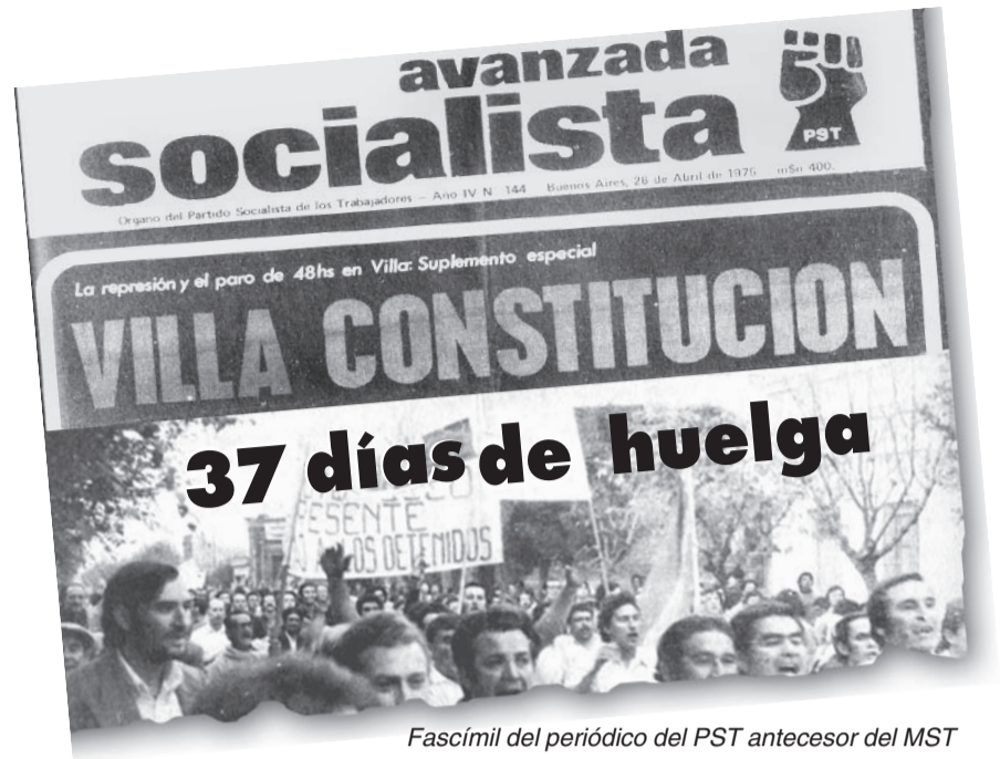
Fascimil del periódico del PST antecesor del MST