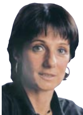
Escribe Vilma Ripoll

A 29 años del golpe, la pelea por los derechos humanos es un tema presente. Si bien la lucha popular derrotó el punto final y la obediencia debida, los genocidas siguen sueltos. Y con Kirchner sigue la miseria, la entrega y ahora la inflación, atacando el derecho humano más básico: el de comer. Y se encarcela y persigue a los luchadores. Y sigue la impunidad como tiene Ibarra, responsable de Cromañón. Esa es la realidad. Por eso este 24 de marzo, con la misma o más fuerza que siempre, lo invito a que marchemos masivamente a Plaza de Mayo y a todas las plazas del país.