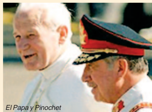
El Papa y Pinochet