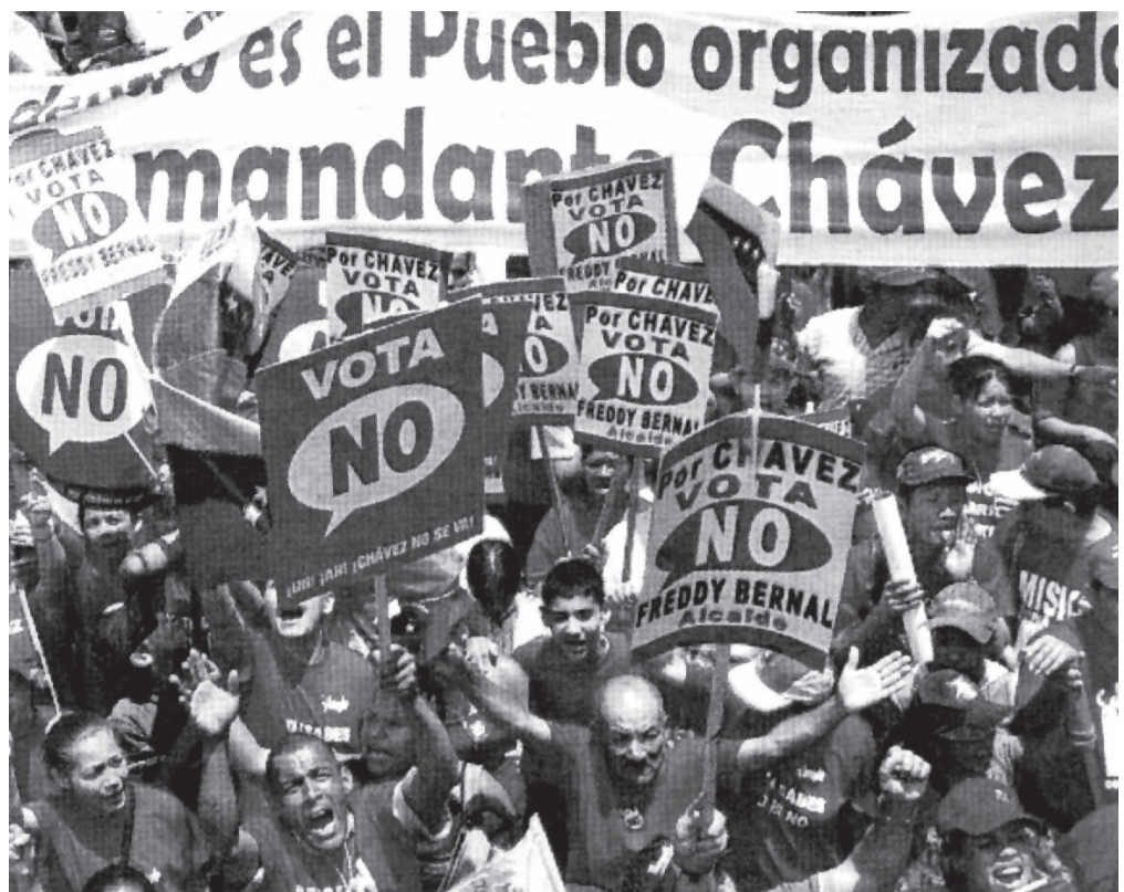
El pueblo venezolano derrotó a Bush.

Los dirigentes sindicales reunidos en el evento son expresión del desarrollo de una amplia corriente clasista y revolucionaria en el seno de la UNT, que, sin duda, es la carne y la sangre que hará posible la conformación de una central obrera, genuinamente democrática, autónoma, internacionalista y solidaria que debe jugar un papel de primer orden en la profundización del proceso revolucionario y en el acompañamiento de las luchas del conjunto del pueblo y demás sectores oprimidos por esta sociedad capitalista.