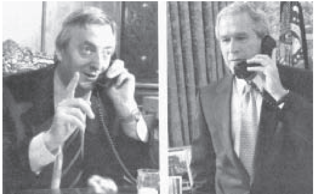
Amigable diálogo entre Kirchner y Bush

En cada extremo de la línea telefónica hubo otros actores. Antes, fueron Bush padre y Carlos Menem. Ahora, su hijo, con el actual presidente Kirchner. Cualquier similitud, no es casualidad. Mas allá del doble discurso oficial, teñido de "nacional y popular", las relaciones carnales siguen vigentes. Ahora, bajo el novadoso y pérfido estilo K.