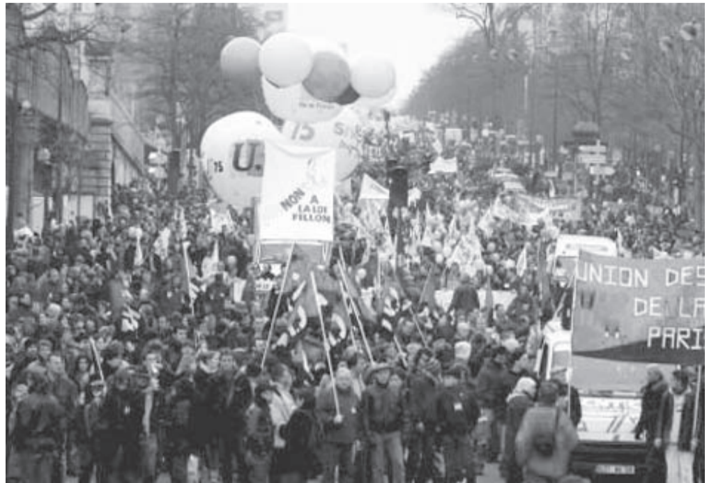
Manifestación del 10/3 en París

La crisis es profunda no sólo en Francia. La base de la UE es el eje Francia-Alemania. Y si el NO gana en Francia, es un durísimo golpe contra uno de sus dos pilares esenciales. Todos los gobiernos europeos intentan intervenir en la crisis francesa. Por ejemplo el británico dijo que el NO es "neoconservador", lo que obligó al gobierno del PS a exigirle disculpas. El gobierno italiano, que también está debilitado por su rol en la guerra de Irak, puede perder las elecciones. El presidente de la UE, Barroso, presionó a Chirac para que se involucre en la pelea por el SI, pero el resultado fue que sube el NO. También apoya el SI el primer ministro español, Zapatero, del PS 4 . Al día siguiente del referéndum español, Zapatero fue a Francia y habló ante la Asamblea Nacional ante los aplausos de toda la derecha, confirmando que ésta y los "socialistas" defienden la misma política.