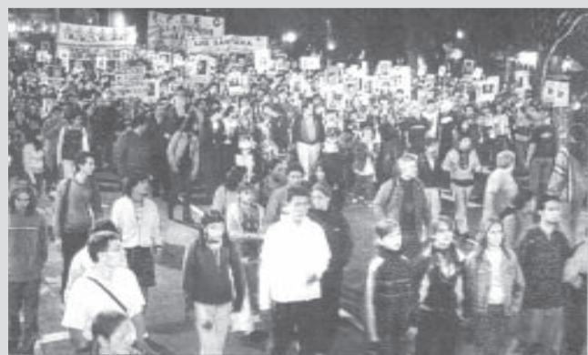
Marcha al cumplirse el tercer mes de la masacre de Cromañón.