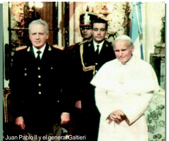
Juan Pablo II y el general Galtieri