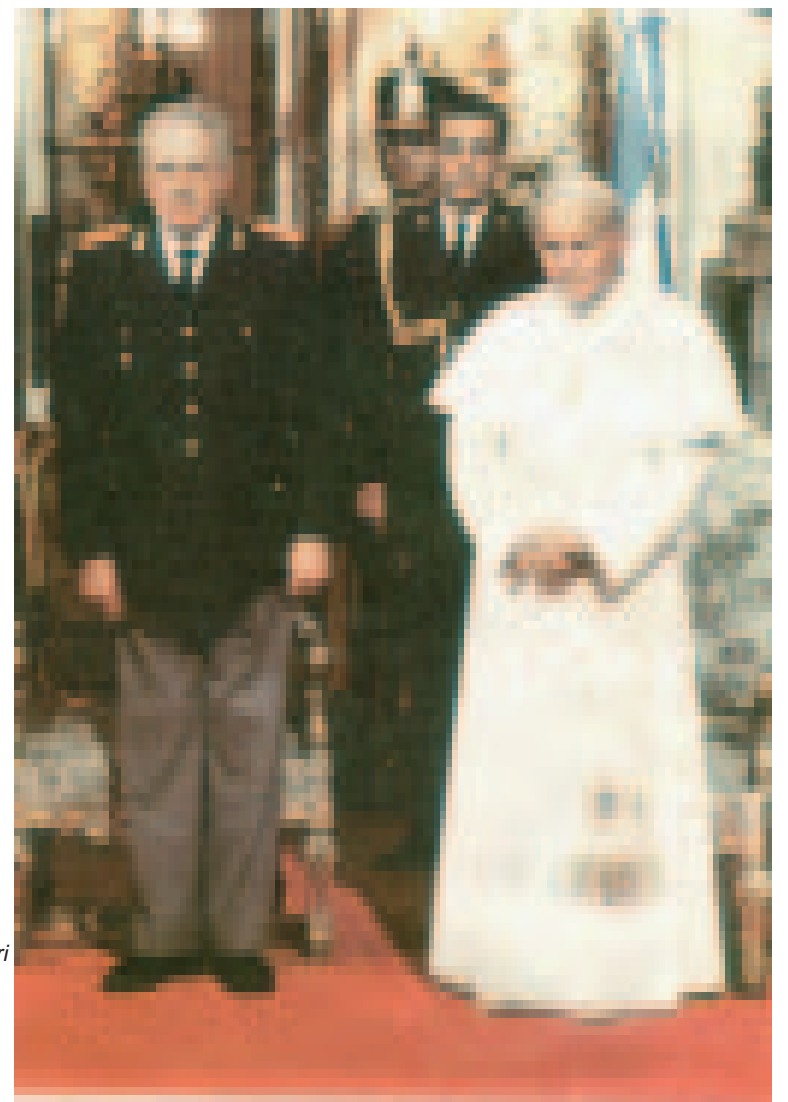
El genocida Galtieri con Juan Pablo II