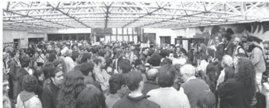
Una vista del Encuentro Sindical.

Una polémica importante se dio alrededor de sectores que actuaron agrupados como "independientes", que poniendo el centro en atacar a los "corralitos partidarios", esgrimieron una regresiva posición contra la izquierda y pusieron en peligro la unidad del encuentro y los acuerdos alcanzados, en los que trabaja-