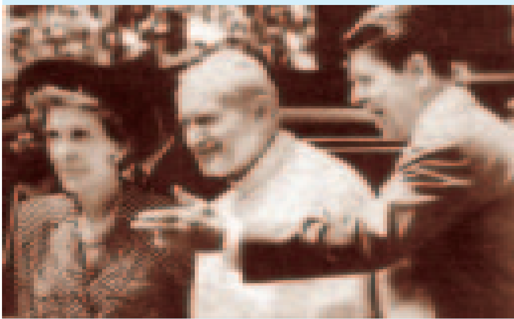
El Papa con Reagan