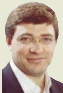
Escribe: Juan Carlos Giordano

El 1º es un día de lucha. Pero parece que la CGT lo ha convertido en día de fiesta. Mientras el país está sacudido por importantes luchas, enfrentando incluso a la represión como en LAFSA, la CGT no hace nada para unificarlas, ni llama a ninguna medida en apoyo.