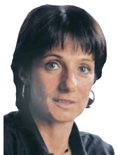
Escribe Vilma Ripoll

En el Hospital Garrahan, ante la firmeza del primer día del paro de 72 horas, el gobierno tuvo que ofertar 300 pesos. Con toda razón, los compañeros votaron seguir la pelea para que vaya al básico. Si siempre el gobierno busca volcar al usuario contra el trabajador, al ser un hospital y pediátrico la campaña es más sucia aún. Desde ya, los bombos no se oyen en las salas. Pero además de no asumir los problemas del mayor hospital público del país, que depende de ambos, Ibarra y Kirchner acusan al personal de poner en riesgo a los chicos. Hay que repudiar esas mentiras y seguir junto al Garrahan hasta ganar.