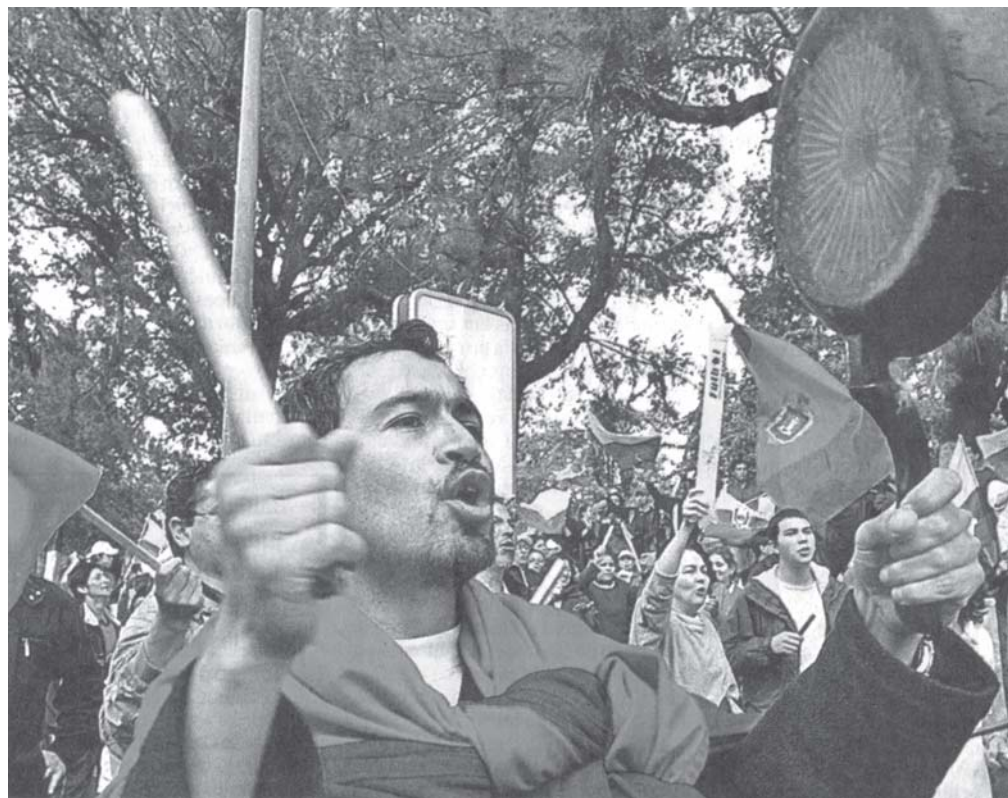
La movilización popular volteó otro presidente.

La insurrección no tuvo dirección. El MDP (maoísta) que es el partido de izquierda más fuerte, y dirige a varios de los sindicatos más importantes, llamaba a no concurrir a las manifestaciones contra Gutiérrez. Recién cuando ya estaba desatado el movimiento insurreccional, salió a manifestar. Por su parte la CONAIE (la Confederación Indígena, que es representativa del 40% de población indígena del país), planteó su apoyo al "que se vayan todos" y propone formar un "Parlamento de los Pueblos". La rebelión originó nuevos organismos: las asambleas barriales.