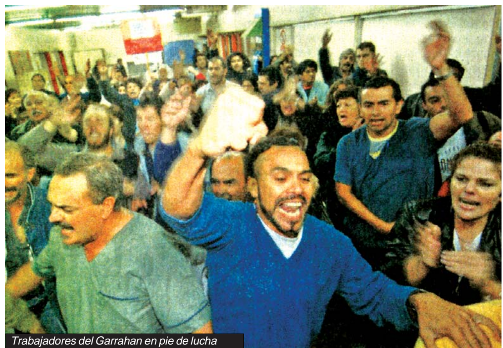
Trabajadores del Garrahan en pie de lucha

* Lunes 25/4 - 18 hs Charla con los trabajadores de Logiway y vecinos de Villa Martelli. En Avda. Mitre 133 "C" (a metros de Laprida), Villa Martelli, Vte. López.