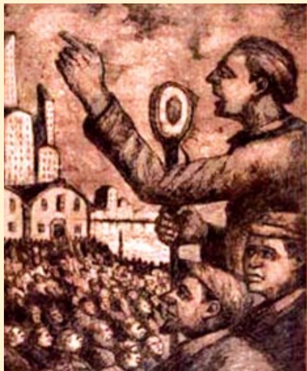
«Primero de Mayo», aguafuerte del pintor argentino Benito Quinquela Martín.

En todo el país hay conflictos por salario. Junto a la gran desocupación, hay miles de trabajadores que cumplen jornadas agotadoras de 12 o 14 horas. Los chicos y jóvenes no se educan y no hay salud para el pueblo trabajador. Es que en Argentina y el mundo soportamos la miseria que imponen el capitalismo y el imperialismo. El 1º de Mayo, como día internacional de movilización, surgió en el siglo XIX, ligado a las luchas del movimiento obrero.