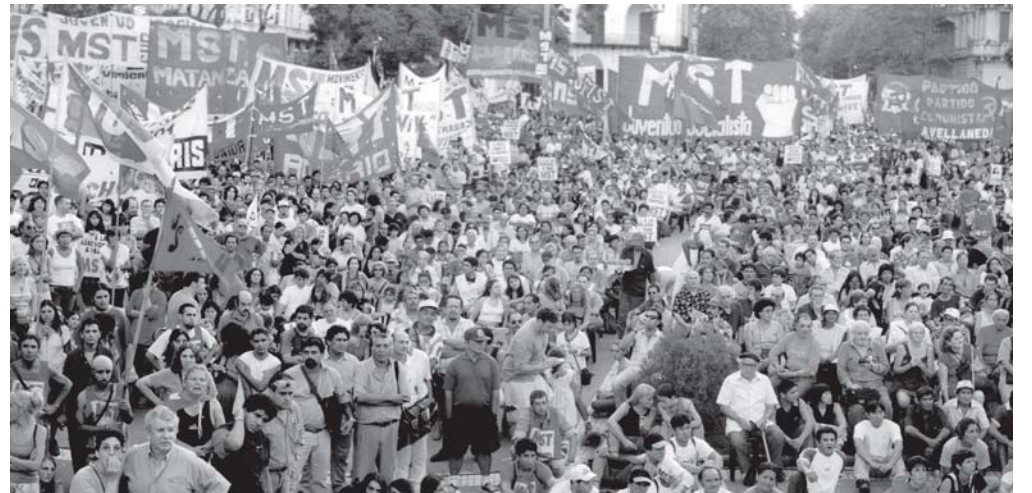
Acto en Plaza de Mayo el último 20 de diciembre

Para concretar la unidad, no podemos comenzar por el orden de las candidaturas. Lo primero es ponernos de acuerdo en un programa y definir que el frente que debemos conformar tiene que tener un claro perfil de izquierda, opuesto no solo al del gobierno de Kirchner y los viejos partidos, sino también al que levantan las distintas variantes de centroizquierda que ya demostraron no ser ninguna alternativa cuando gobernaron junto con la UCR. Entre la izquierda existen bases programáticas comunes. En Izquierda Unida tenemos un programa que ponemos a disposición de todas las demás organizaciones. También están los programas elaborados entre todos para el acto del 20 de diciembre o el 24 de marzo. Estas bases combinan las reivindicaciones más sentidas de