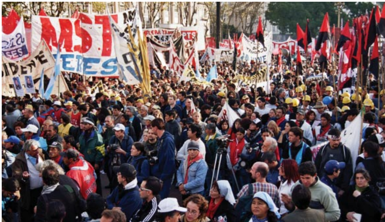
Acto unitario del 1º de Mayo del 2004, en Plaza de Mayo.

Por eso el 1º vamos a Plaza de Mayo y las plazas del país. Contra la inflación, por aumento de salarios, reclamando que la CGT-CTA rompan el pacto con el gobierno y llamen a luchar. Porque el 1º es un día de lucha. No de fiesta.