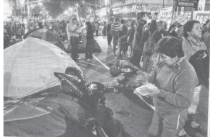
Último acampe piquetero

Al día siguiente de las declaraciones, las organizaciones de desocupados marchaban a la Jefatura de Gobierno para reclamar por la baja de cientos de planes. Una columna de cientos de policías los esperaban en una actitud amenazante y provocadora contra los que se movilizaban con sus familias e