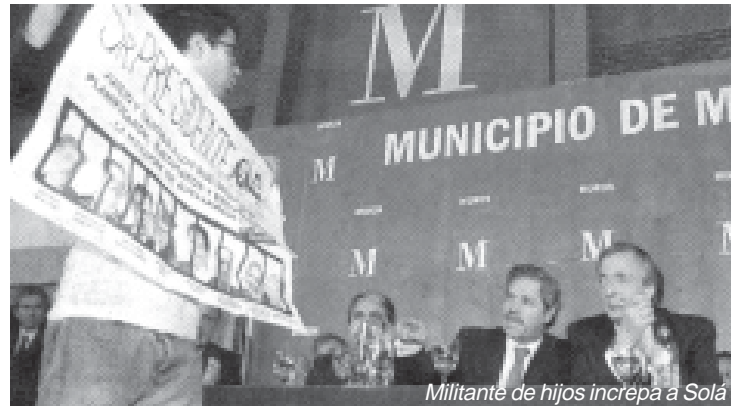
Militante de hijos increpa a Sola