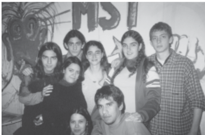
Secundarios en el local de la JS

B: Por esto, el Sarmiento se clausuró, tuvieron que mandar más de 80 obreros a trabajar una semana, y en estos días se reabre. Eso motivó al resto de los colegios.