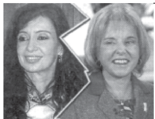
El PJ, como perros y gatos