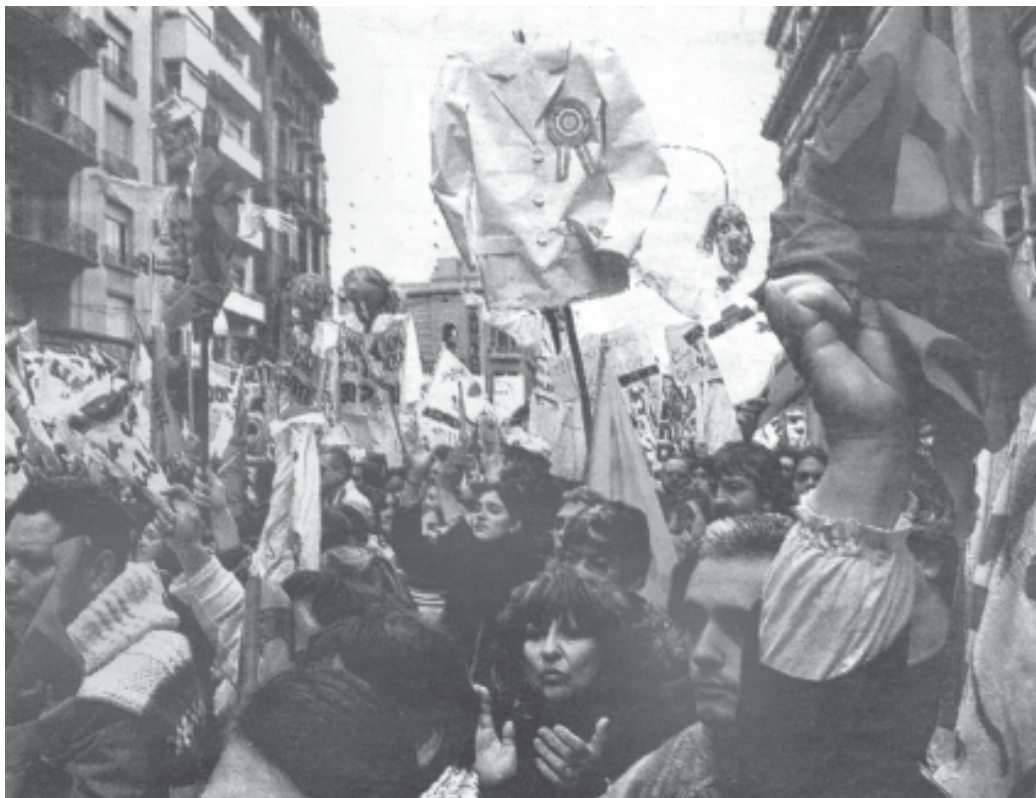
Marcha nacional de docentes el viernes 20/05

Estos aprietes responden a lo dicho por Oporto: «no se puede dar un aumento por mes, cada vez que ellos lo pidan». Esto no impidió que SUTEBA-FEB dejaran en "suspensión" un paro anunciado. ¡Debemos romper la tregua