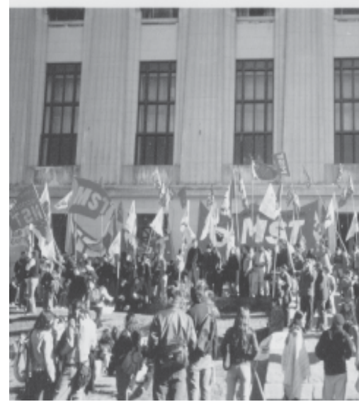
Sábado 21 de mayo, Congreso contra la LES

Por otro lado grupos sectarios como el PTS intentaron mostrar supuestas falencias y una supuesta negativa de la FUBA a apoyar económicamente luchas obreras, intento que contrasta con la presencia política, física y económica de la FUBA en luchas de diversos carácter.