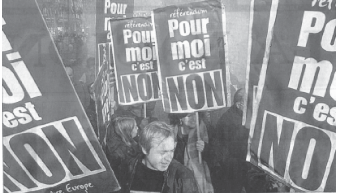
El No golpea la Constitución Europea

Es que Francia atraviesa una crisis social, económica y política a la que no son