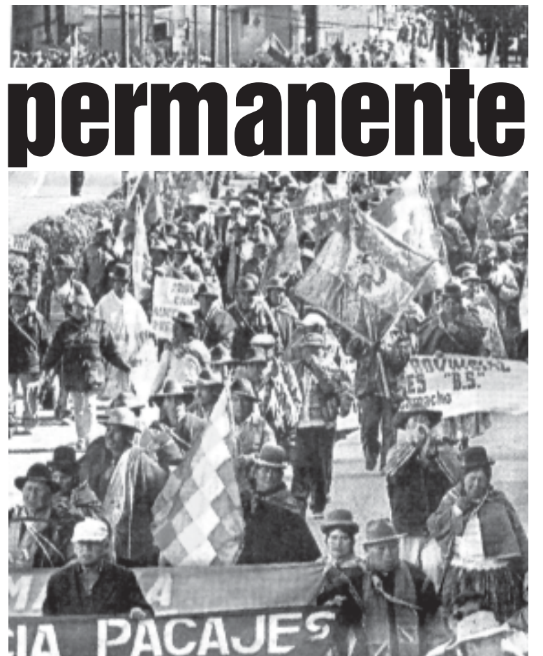
La movilización que hace temblar a Mesa

La historia de Bolivia es la historia de Latinoamérica. Una larga lista de expoliación a lo largo de varios siglos. El oro y la plata, el estaño y el cobre, ahora el petróleo y el gas. La injusticia de la dominación imperialista. El camino que han emprendido las masas y los pueblos como el de Bolivia, es el camino de una nueva independencia. Sobran algunos de los