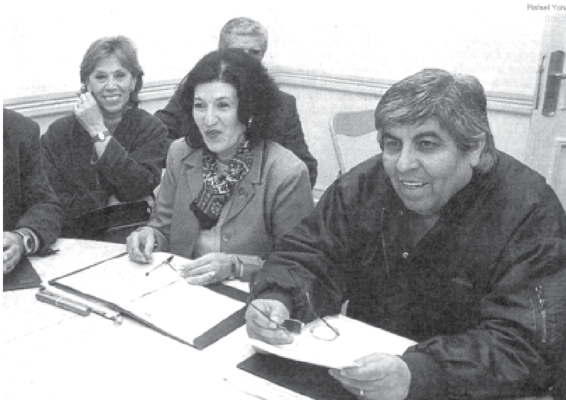
Un romance que no fue

Moyano va intentar hacer aparecer cualquier aumento como un logro propio. No hay que confundirse, si se habla de subir el salario es porque lo imponen las luchas, la mayoría de las cuales triunfan y muchas por fuera del control de esta burocracia.