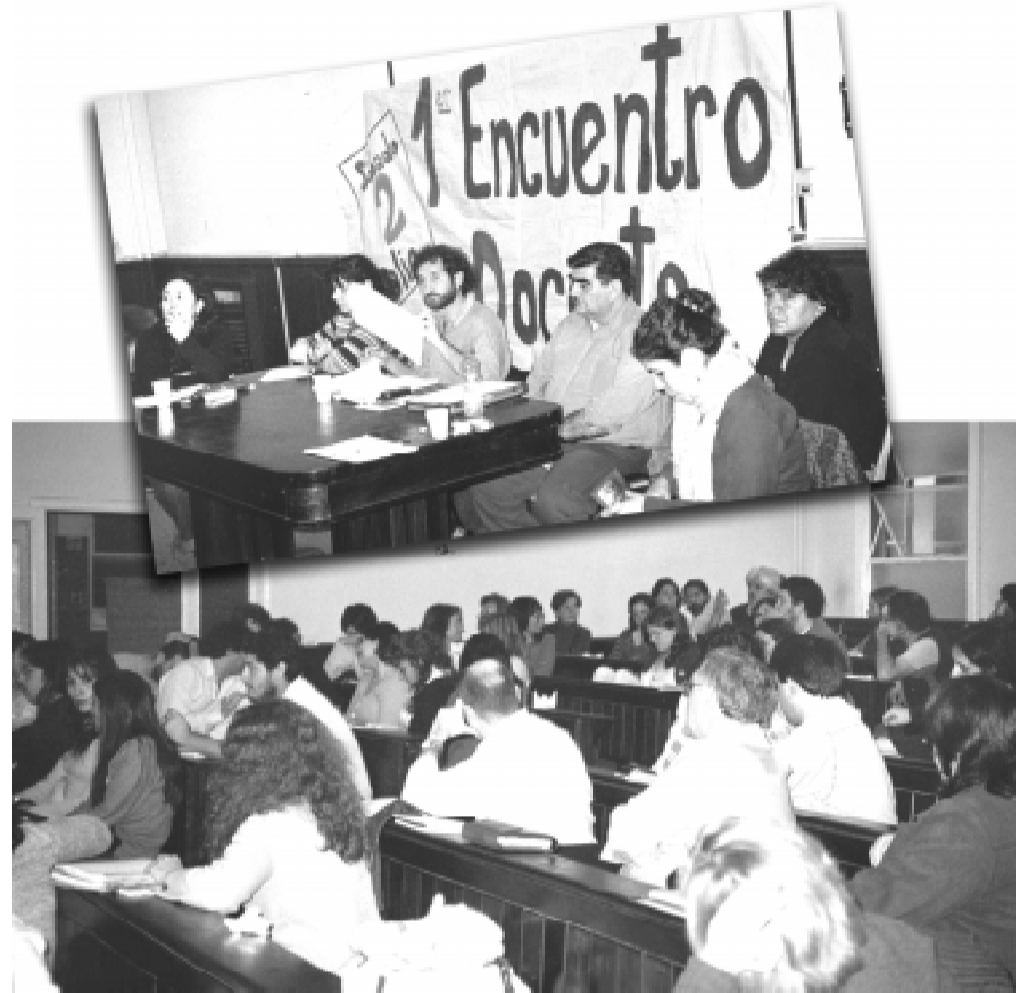
Dos momentos del encuentro: la mesa y los participantes.

El reclamo y bronca de la base junto a la presión de la oposición, los obligaron a unificar con ATE y otros sectores y salir a ganar la calle. Aunque la oposición volvió a movilizar tanto como ellos. Mientras Solá no deja de echar leña al fuego al anunciar fuertes descuentos por los paros. ¡Pero tuvo como respuesta un nuevo parazo!