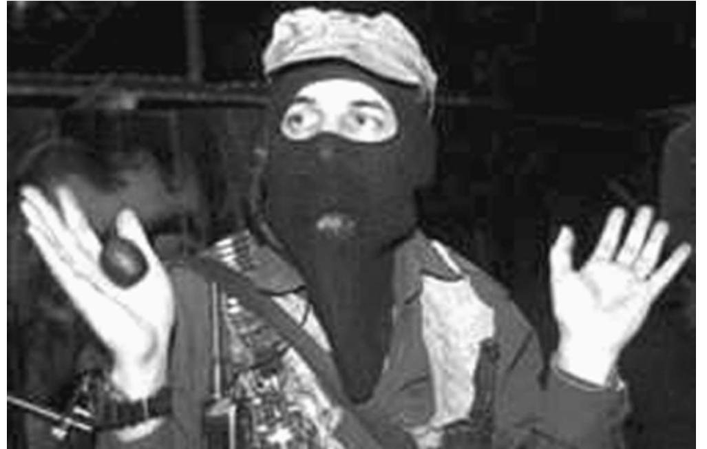
El Sub Comandante Marcos volvió a hablar después de dos años.

En este caso comete varios errores. El primero es poner un signo igual entre los partidos patronales, como el PAN y el PRI mexicanos, con los de centroizquierda, como el PRD, y con los partidos de izquierda, sean éstos revolucionarios o reformistas. Intenta demostrar que por el solo hecho de ser partidos, son todos iguales. Borra de esta manera la cantidad de veces que menciona a los pobres y explotados, ya que niega la necesidad de los trabajadores y los oprimidos de darse su propia organización política. Y al mismo tiempo, tira por la borda la afirmación de que el programa es de "izquierda", al proscribir a los partidos que elaboran y luchan a diario por ese programa. Su reivindicación del Che Guevara no es política ni de organización: es sólo de imagen. Fue el mismo Guevara el que dijo "o revolución socialista o caricatura de revolución". La con-