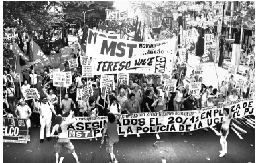
Foto de archivo. El Teresa Vive marcha hacia el Puente Pueyrredón.

Las organizaciones piqueteras nos hemos construido en los barrios obreros a fuerza de