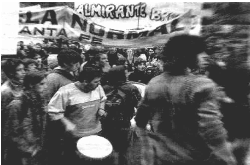
Mobilización de los secundarios santafesinos.

Como es histórico, los que rápidamente salieron para repudiar este aumento fueron los