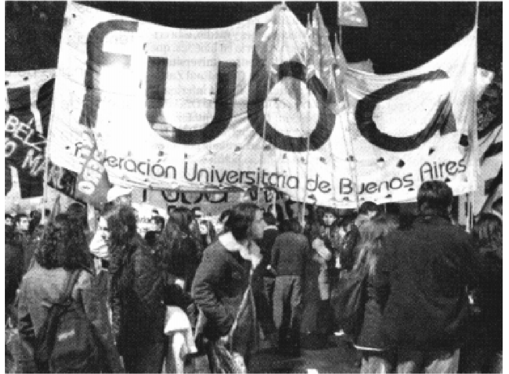
Marcha de la FUBA en defensa de la educación pública.

El día del Congreso, finalmente, el gobierno, la Franja y el ARI se unieron para no venir. Tampoco el MNR aceptó ser parte de la convocatoria. Así se les cayó la careta, reclamaban el Congreso en las palabras, pero cuando lo hicimos no vinieron, para no aceptar la realidad: que la izquierda en unidad volvía a ganar. Porque a la unidad del Frente 20 de Diciembre (actual conducción) se sumaban otras