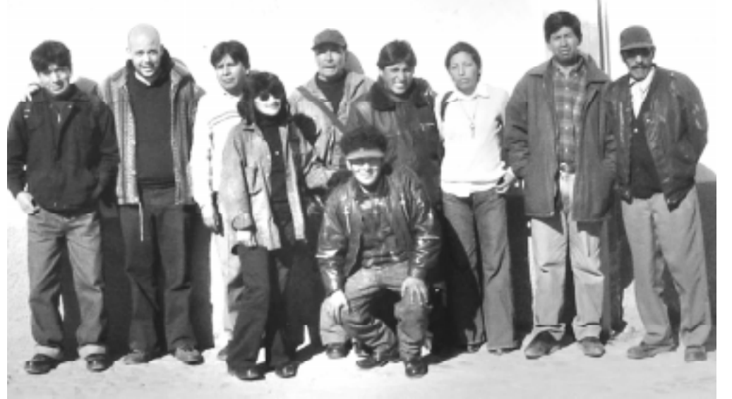
Los convocantes de la reunión en la UPEA de El Alto.

La discusión fue muy profunda en relación al balance de las tres semanas de bloqueos que, nuevamente, pusieron a la cabeza de la revolución latinoamericana al pueblo boliviano, ratificando que la única forma que tienen los trabajadores para sacarse de encima a los partidos y políticos culpables de su miseria es movilizándose. Hubo un acuerdo general en relación a lo positivo de este balance, ya que logró echar a Mesa y evitó que asumieran otros dos presidentes. Asimismo, el gobierno tuvo que incluir en su nueva agenda la asamblea constituyente y lo que es más importante: muchos de los miles que se movilizaron avanzaron en su conciencia planteándose el problema de pelear por el poder como única solu-