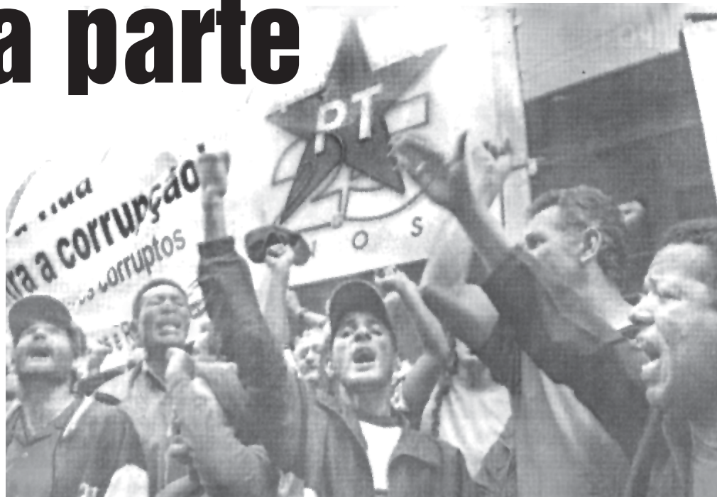
Militantes del PT repudian la corrupción del gobierno de Lula

Un Manifiesto de Economistas por una Nueva Política Económica, levanta una serie de medidas que congregan una serie de puntos progresivos pero insuficientes. Uno de esos puntos plantea "Duplicar el salario mínimo... y mejorar las condiciones de vida de los más pobres, honrando así los compromisos asumidos por el Gobierno Lula en la campaña electoral". Es decir, que sea este gobierno quien