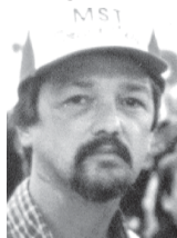
Escribe: Gustavo Giménez

Ubicado en Martín de Gainza y Roca, a 10 cuadras del cruce Castelar, asiste a 90 vecinos y 40 pibes que vienen a tomar la leche a la tarde. Una actividad importante se despliega cuando empezamos esta nota. Compañeros cocinando, reparando el baño, cortando leña. Son alrededor de 20. Luego vendrá otro grupo para el merendero. Las compañeras que atienden el roperito. Los 15 jóvenes del taller de percusión. El sábado este lugar de 50 metros cuadrados, levantado con maderas y chapas en un largo terreno será una hormiguero. Ese día los compañeros de la FUBA dan clases de apoyo escolar para chicos, jóvenes y adultos, un taller de literatura abonado por más de 300 libros donados y otros de guitarra e inglés.