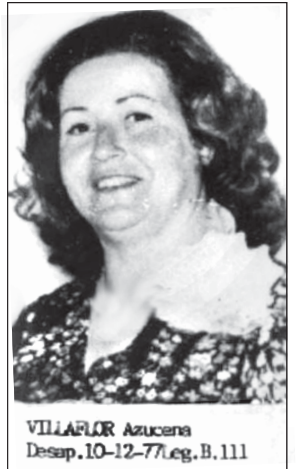
Azucena Villaflor, fundadora de Madres de Plaza de Mayo desaparecida el 8/12/77

“Luchadoras, dieron la vida por sus hijos. No pudieron vencer a la muerte, pero eran tan obstinadas que sí pudieron vencer al olvido” dijo uno de sus hijos durante la misa en la que se leyeron decenas de cartas de los parientes recordando a las dos madres (Página 12, 25/07). Pero lo cierto es que vencieron al olvido, porque el país entero lo venció y el recuerdo de los 30.000 desaparecidos nunca dejó de estar presente. Porque luego de 28 años la lucha no cesa y miles de personas exigimos juicio y castigo a los genocidas de ayer y de hoy, al mismo tiempo que, junto a Patricia Walsh en el Congreso; venimos exigiendo la anulación de los indultos que permiten que los asesinos caminen libres por las mismas