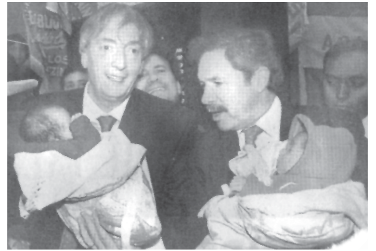
Bebes en brazos: demagogia de campaña

Compañero, si usted es uno de los tantos peronistas que se siente asqueado por lo que