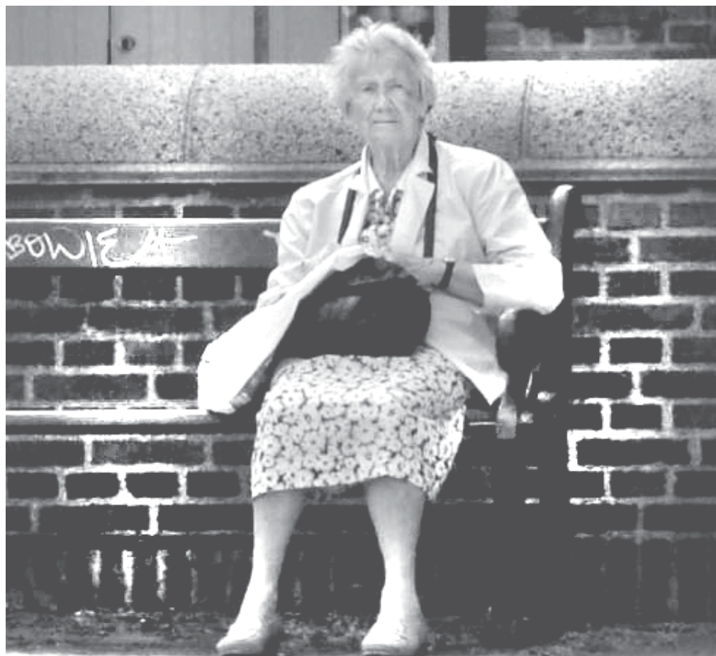
Los jubilados siguen esperando un aumento

El gobierno y los empresarios discuten el tema inflación como si su existencia fuera algo natural o poco modificable, que depende del mercado o de raras estadísticas. Y el nuevo verso 2005 es echarle la culpa a los salarios. En realidad, como en todos los problemas económicos las primeras decisiones son políticas, definir en primer lugar a que sectores sociales beneficiar y a partir de ahí usar medidas económicas para lograrlo. Las medidas de Kirchner son para beneficiar a los acreedores externos