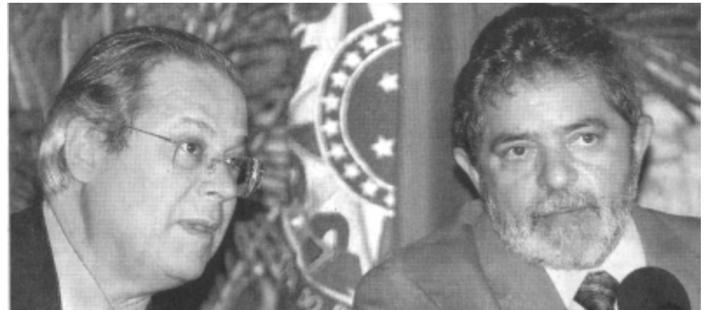
El ex-hombre fuerte del gobierno complica a Lula