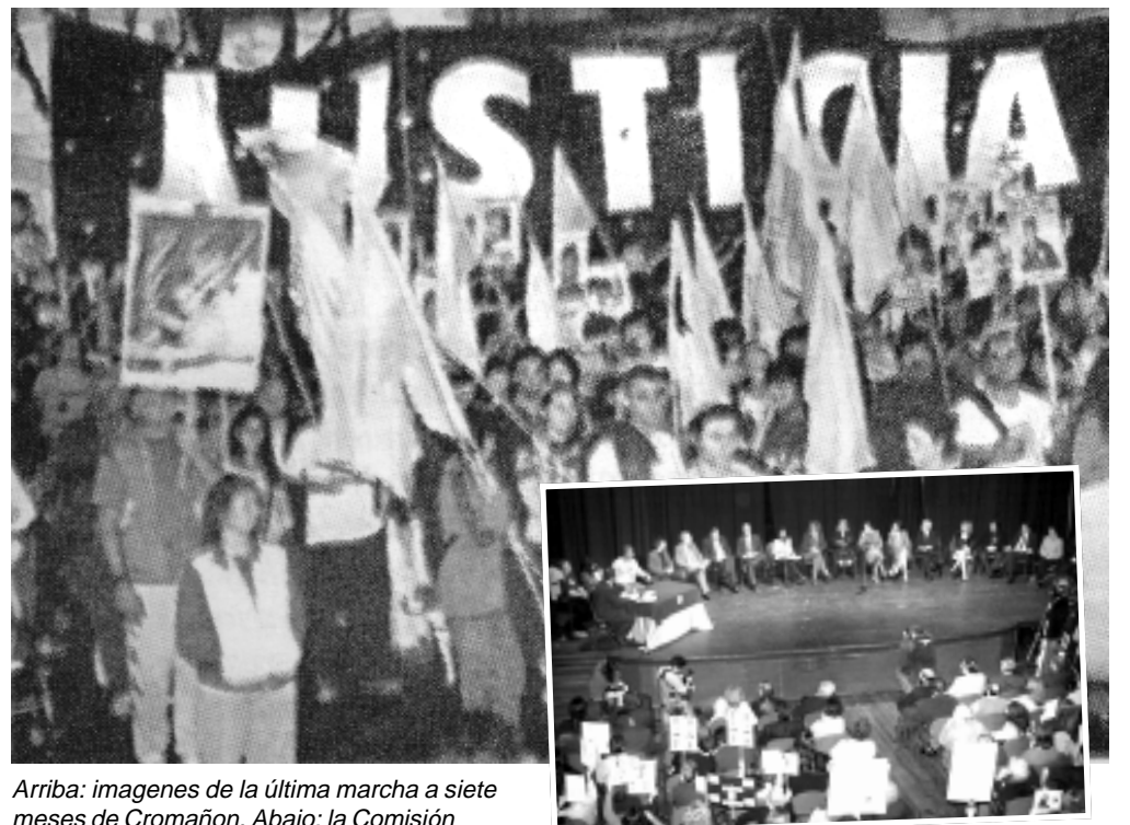
Arriba: imágenes de la última marcha a siete meses de Cromañón. Abajo: la Comisión Investigadora exponiendo su dictamen.

La crisis abierta en el régimen, con las movilizaciones del 19 y 20 de diciembre del 2001, en nuestro criterio, no se ha cerrado; la debili-