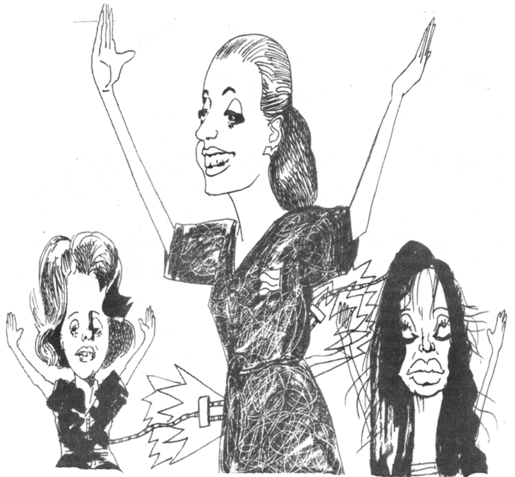
Chiche y Cristina se atan a Evita por conveniencia

Cuando en el 2000 llegó el fallo de Olmos sobre la ilegitimidad y fraude de la deuda comprendí que esa sí era la "madre de todas las batallas" y también que esa batalla era imposible darla dentro del PJ. Eran los momentos del pacto entre Cavallo y Duhalde- Ruckauf, no