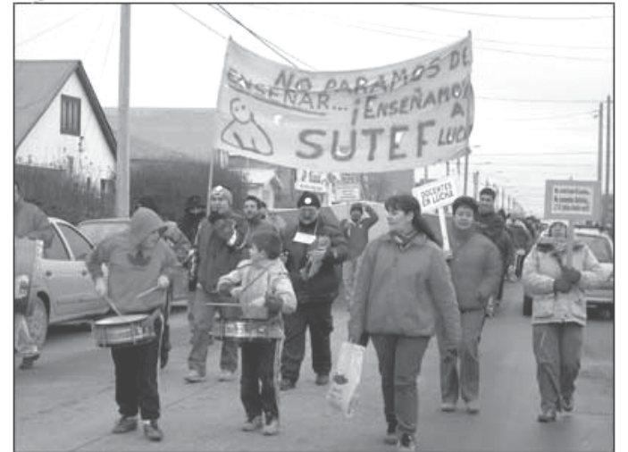
Conflicto docente en el titular del diario Hoy de La Plata

HOY Quieren que en 2006 haya 190 días de clase