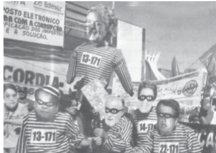
Manifestantes sostienen un muñeco de Lula con nariz de Pinocho

contra el imperialismo. En particular el apoyo a la UNT nueva central de los trabajadores venezolanos y al PRS. La solidaridad con los luchadores bolivianos de las organizaciones de la COB, COR el Alto, la Fejuve, el M17 que están construyendo una nueva herramienta política. Quedó fijado un próximo encuentro en ocasión del FSM temático que se realizara en Caracas en enero del 2006. Frente a la necesidad de: 1) colaborar en todo lo posible en actividades comunes. La próxima movilización antiguerra del 24-25 de septiembre, la movilización contra Bush en Argentina en ocasión de la Cumbre de las Américas que se realiza en el mes de Noviembre. 2) comenzar un intercambio más sistemá-