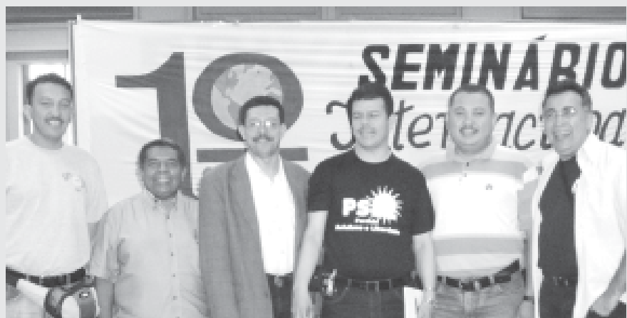
Delegación venezolana del Seminario