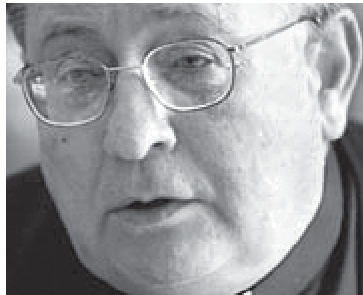
El Obispo Maccarone espiado por la mafia de Ick

Es necesario que terminemos de una vez por todas con estas prácticas en Santiago del Estero y por ello exigimos que todos los sectores políticos y sociales que intervienen en el escenario santiagueño se pronuncien y tomen cartas en el asunto. Sólo de esta manera continuaremos transitando el camino que comenzó