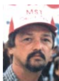
Gustavo Giménez, Senador Provincial