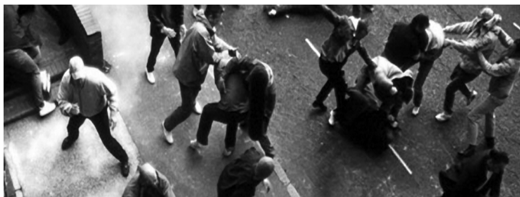
Enfrentamientos entre barrabravas

"Ustedes nunca me miraron durante décadas y antiguamente era fácil resolver el problema de la miseria. El diagnóstico era obvio: Migración rural, desnivel de renta, pocas villas miseria, discretas periferias; la solución nunca aparecía... ¿Qué hicieron? Nada. Ustedes sólo pueden llegar a algún suceso si desisten de defender la "normalidad". No hay más normalidad alguna. Ustedes precisan hacer una autocrítica de su propia incompetencia. Pero a ser franco, en serio, en la moral. Estamos todos en el centro de lo insoluble. Sólo que nosotros vivimos de él y ustedes no tienen salida. Sólo la mierda. Y nosotros ya trabajamos dentro de ella. Entiéndame, hermano, no hay solución. ¿Saben por qué? Porque ustedes no entienden ni la extensión