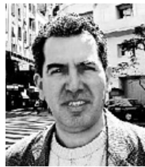
Escribe: Pablo Llanto Periodista

La palabra barrabrava da paso a un lugar común, y éste al siguiente y al siguiente. Usted sólo tiene que ordenarlos, a su gusto. ¿Listo?