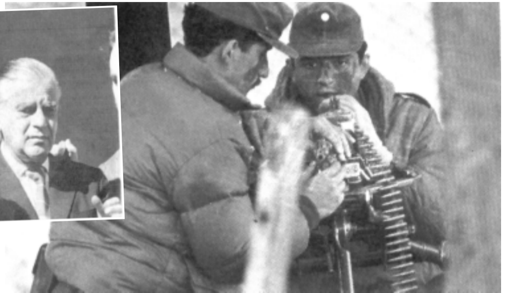
Militares «carapintas» durante la rebelión de Campo de Mayo

Serían días de tensión. Frente a una democracia amenazada, la movilización se hizo sentir. Familias enteras marchaban por las calles del país. Miles se concentraron espontáneamente en Plaza de Mayo y Campo de Mayo. Sin embargo, los principales