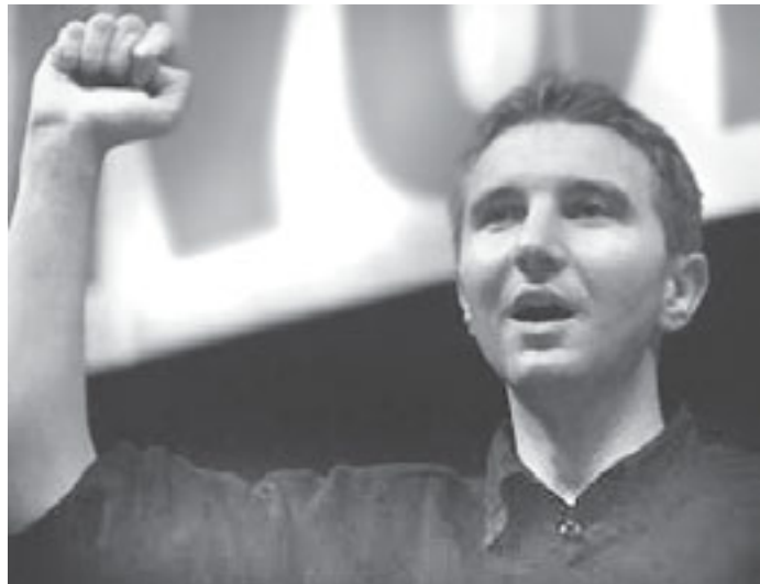
Olivier Besancenot, el candidato de la LCR

Esto es así porque las reformas estructurales, el avance privatizador, los despidos, el tratar de borrar el "estado benefactor" en un país imperialista que, como Francia se dio el lujo de sostener a costa de la explotación a otros países por sus multinacionales