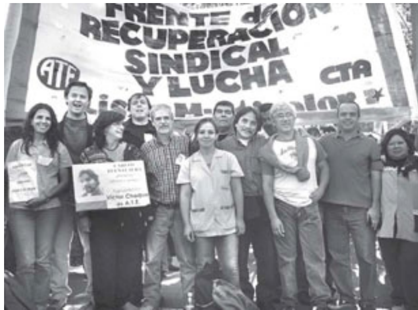
Candidatos de la Multicolor de Pcia de Buenos Aires

Desde la rebelión estatal del 2004, muchas fueron las peleas que dimos en todo el