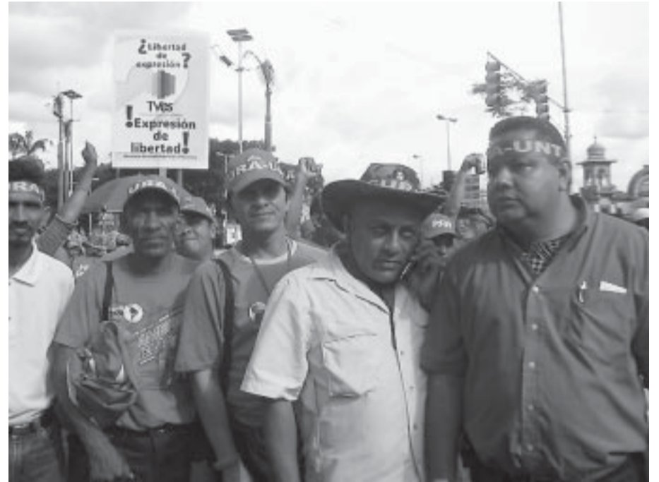
Dirigentes sindicales de la UNT (C-CURA) inscritos en el PSUV.

Caracas, 4 de junio de 2007.- Un plan de articulación entre el gobierno nacional y las organizaciones sociales y sindicales que apoyan el proceso revolucionario, para enfrentar la oleada golpista desatada luego de la no renovación de la concesión a RCTV, es la propuesta de un grupo de dirigentes sindicales pertenecientes al sector de la Corriente Sindical Clasista Unitaria Revolucionaria y Autónoma (C-CURA) de la Nacional de la Unión Nacional de Trabajadores (UNT), que optó por inscribirse en el PSUV.