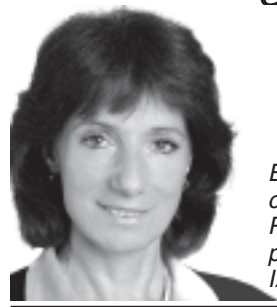
Escribe Vilma Ripoll , candidata a Presidenta por el MST-Nueva Izquierda

A Cristina le va bastante bien en las encuestas, pero no tanto en sus actos de campaña. En Río Grande, adonde fue como vocera del gobierno y candidata, se trenzaron las patotas del viejo sindicalismo. Antes, en Córdoba, su amigo Schiaretto se robó los votos. En Santa Fe, el PJ recibió una paliza. Y ahora, la elección de Chaco también permite algunas reflexiones.