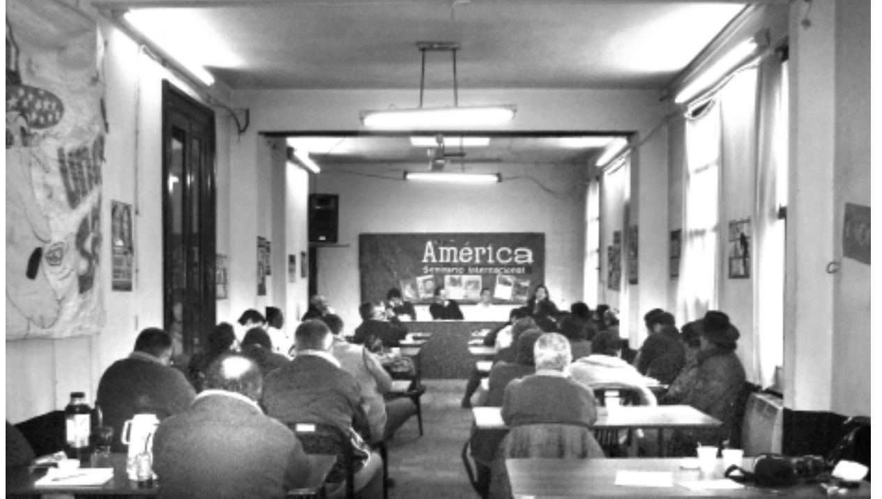
Seminario internacional de Revista de América 17 y 20 de Agosto de 2007

Ahora tiene elementos contrarrestantes. Es evidente que esto se da después de cua-