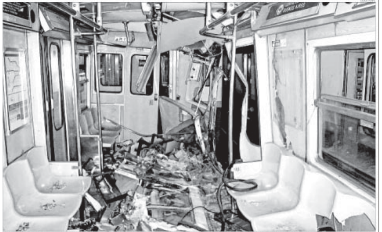
IMAGEN EXCLUSIVA. Así quedó el coche que el pasado miércoles 21 de junio descarriló y chocó en los túneles de la línea D. Viajaban pocos pasajeros. Hubo cuatro heridos.

Una muestra de la inseguridad en el Subte