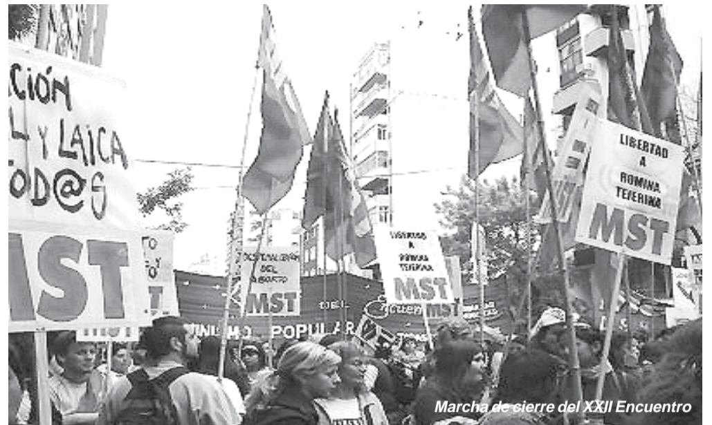
Marcha de cierre del XXII Encuentro

Una vez más, como viene sucediendo en los últimos años, la protagonista del encuentro fue la lucha por la despenalización del aborto. Y estos es así porque más allá de los credos particulares, nadie puede desconocer la terrible realidad de nuestro país: se estima que la cantidad de embarazos llevados a término es prácticamente la misma que la de abortos; aproximadamente 400 mujeres mueren por abortos infectados cada