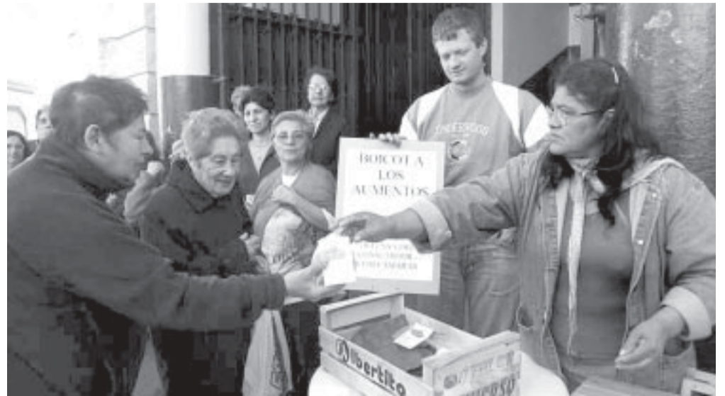
Protesta frente al Mercado de San Telmo

Nada dicen por supuesto de la especulación de los capitalistas que remarcan los precios por encima de la inflación para cubrirse, o de los intermediarios que cargan