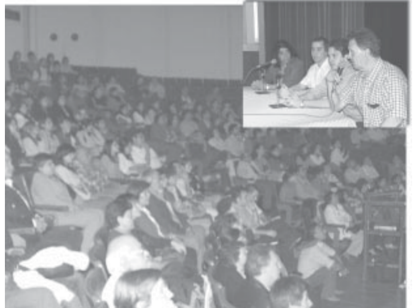
Anfiteatro lleno en la presentación del documental «El Tucumanazo».

El Tucumanazo se apoya en la tradición y militancia de los centros estudiantiles preexistentes, pero en el devenir de los acontecimientos estas estructuras, que se mantienen, son superadas por un todo nuevo. Un movimiento de democracia directa, que, con diferencias, veríamos luego en diciembre del 2001 en Buenos Aires. El eje determinante de las decisiones pasa a ser un movimiento asambleario permanente. Donde costaba mucho distinguir dirigentes de dirigidos. También aquí van a emerger dirigentes estudiantiles no sectarios, ni autoritarios. Dirigentes que más allá de sus convicciones respetan las deci-