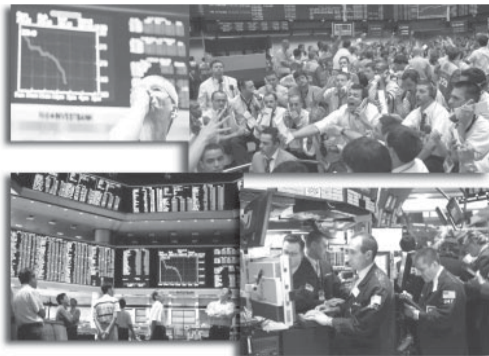
28 de Febrero y 15 de Agosto del 2007.

Esta afirmación que hemos hecho en un simple párrafo, ha generado discusiones desde hace décadas, no sólo con los economistas burgueses sino también con otros que se dicen de centroizquierda y aún algunos que se reclaman del marxismo. Que tienden a interpretar, algunos honestamente otros no tanto, que el problema es la sobre acu-