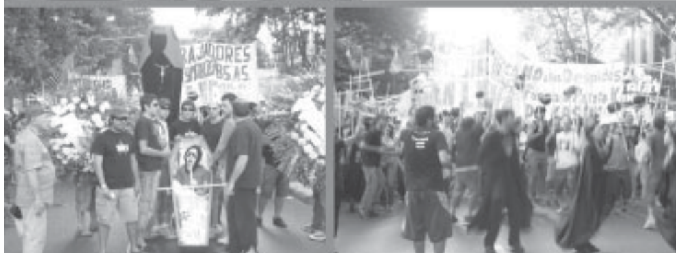
Martes 27/11: masiva marcha a la Legislatura Porteña y a Plaza de Mayo.