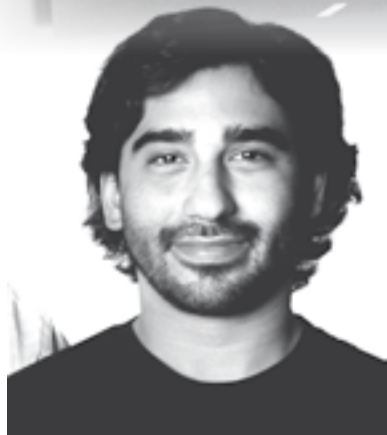
Escribe: Agustín Vanella

que la patronal -encarnada en el testaferro de los Kirchner, Cristóbal López- ha fracasado hasta ahora en su intento por derrotar la huelga. El Yabrán K, ha contado con un equipo de encumbrados colaboradores entre los que se encuentran la burocracia sindical de ALEARA y el SOMU (con el auxilio de su patota); jueces corruptos como Servini de Cubría y Oyarbide; las fuerzas represivas como la Policía Federal y la Prefectura; el silencio cómplice de los multimédios de comunicación y el infaltable apoyo de todo el gobierno.