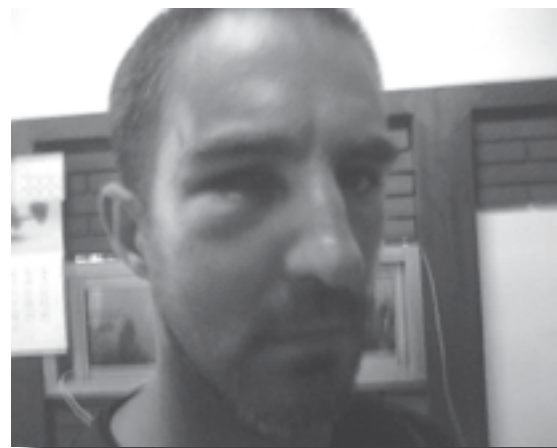
Trabajador del Casino brutalmente agredido

Más allá del reclamo por la reincorporación de los compañeros despe-