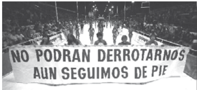
04/02/08: la lucha presente en el carnaval.