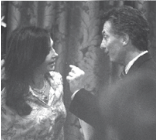
Arriba: Gabriela Michetti, Mauricio Macri y el gabinete de empresarios PRO. Izquierda: Cristina K y Macri... sonrisa para los negocios.

El tercer ingrediente político del gobierno del PRO es su autoritarismo. Como siempre, gobernar para las ganancias privadas e imponer ajustes antipopulares implica apelar a normas represivas. Eso busca Macri con