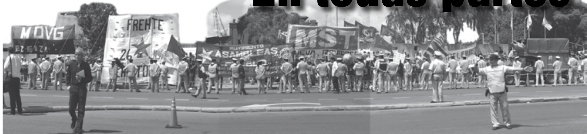
31/01: Assembleístas y organizaciones concentradas frente a la empresa Buquebús.

La Comisión Administradora del Río Uruguay (CARU), confirmó que se produjo una rotura en un sector de la planta de Botnia y que aparentemente provocó un derrame de pasta de celulosa, que podría haber llegado al