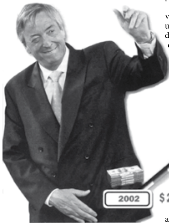
13.0515.021 de dólares, 19 casas, 14 departamentos, 6 terrenos y 2 locales. Declarado...

decir, se enriqueció cumpliendo una función que supuestamente tendría que estar al servicio del pueblo y no de hacer dinero.