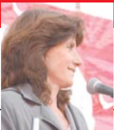
Escribe: Vilma Ripoll

Contra el gobierno, la oligarquía y los pools