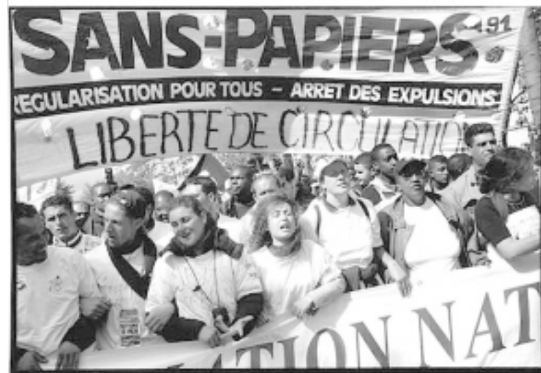
En Francia, marcha de inmigrantes sans papiers -sin papeles- exigiendo regularización para todos, basta de expulsiones y libertad de circulación.