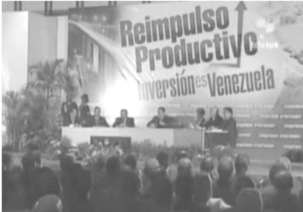
Imagen de un programa de TV venezolano. En el centro de la mesa, Chávez diserta a los empresarios.