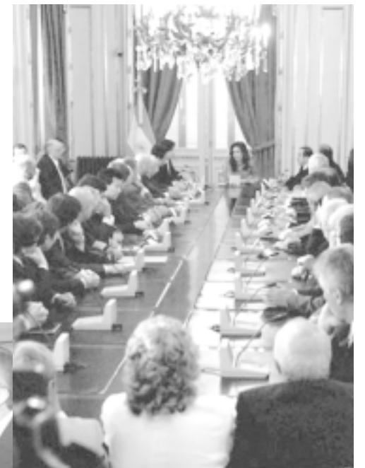
Néstor conduce y Cristina dignifica: Mientras Kirchner negocia en EE.UU. con empresarios multinacionales, Cristina lo hace en la Rosada con los conglomerados del poder económico nacional. Con y para ellos, gobierna el kirchnerismo.