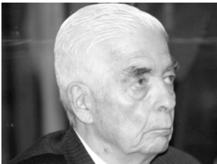
Luciano Benjamin Menendez.

Desde esta conclusión histórica es que debemos prepararnos para el 25 de julio, día en que será leída la sentencia, organizando una unitaria y masiva movilización a tribunales federales. Así, podremos garantizar que ese grito, que atravesó todas y cada una las audiencias, sea una realidad y nos refuerce y consolide para los próximos juicios: Cárcel, común, perpetua y efectiva a todos los asesinos!!!