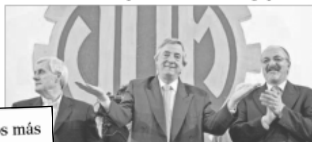
Nota publicada en La Nación, del 4 de julio.

Por Luis Lauque De la Redacción de La Nación