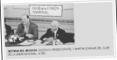
Clarín 8/7: en boca de Grobocopatel.

todo el país diciendo que las retenciones son para redistribuir la riqueza. En medio de la confrontación, Cristina incluso informó que con ese dinero se iban a construir nuevos hospitales, escuelas y demás. Al final, sale a la luz la verdad