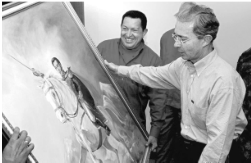
Militares del siglo XXI. De regalo, un cuadro de Bolívar...

El encuentro entre el presidente venezolano Hugo Chávez y el colombiano Álvaro Uribe, ocurrido en Venezuela, es un intento por cerrar la crisis abierta luego de la invasión de suelo Ecuatoriano por parte del ejército genocida de Colombia apoyada por Estados Unidos, y el fracaso del intercambio humanitario de retenidos por las FARC a cambio de prisioneros del gobierno de Bogotá. En la reunión terminaron de normalizar las relaciones diplomáticas y se buscaron nuevos acuerdos comerciales y políticos. La izquierda del proceso bolivariano rechazó de manera clara ese encuentro, mientras que gran parte de la población asistió perplejo a un evento que tiene como telón de fondo la profundización de la polarización social y política en América Latina.