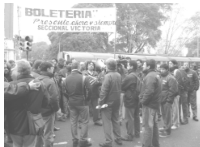
26/6: paro y movilización de los trabajadores de TBA

La directiva de la Unión Ferroviaria no se hizo presente durante el conflicto, con lo cual