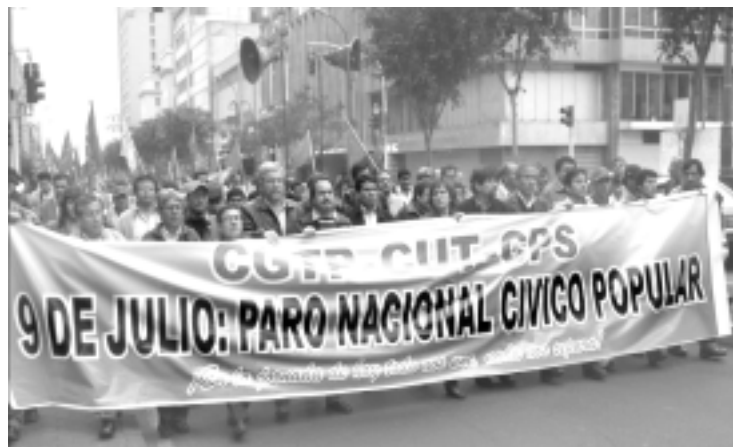
Masiva manifestación del pasado 9