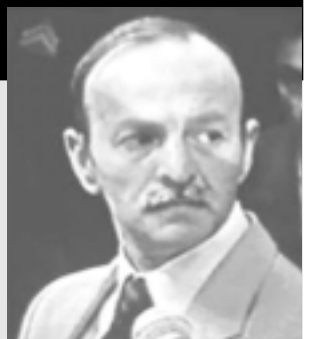
Julián "Laucha" Corres

El 3 de abril pasado, Interpol había atrapado al genocida, de 56 años, en la Capital Federal. Más temprano que tarde volvió a plantearse la necesidad de que los que venimos movilizándonos hace años continuemos haciéndolo. Sólo así podremos presionar a los jueces, fiscales y al gobierno para que este represor prófugo sea encontrado, juzgado y debidamente condenado.