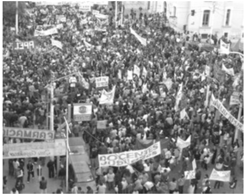
Movilización en Río Gallegos por salario y contra la inflación

en Santa Cruz. La UCR apenas propone "controlar" este modelo. Desde el MST-Nueva Izquierda proponemos cambiarlo completamente. Hay que recuperar nuestros recursos; hay que imponer a los grandes comercios y las inmobiliarias un verdadero control de precios; hay que anular la ley de lemas y discutir qué provincia queremos a partir de una Asamblea Constituyente donde el pueblo decida. Pero para impulsar este cambio de fondo hace falta una alternativa política amplia, unitaria y popular, que se juegue a fondo por esa salida. Desde nuestro partido, el Movimiento Socialista de los Trabajadores, hacemos una amplia