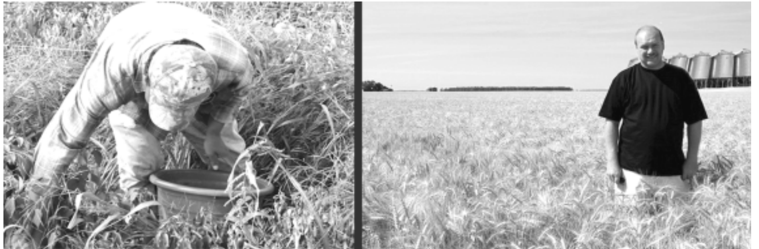
Los chacareros pagan los mismos impuestos que los dueños de los grandes pools de siembra, como Grobocopatel.

Con la tremenda derrota del gobierno, al no poder imponer la Resolución 125, terminó una etapa de la lucha agraria. Pero muchos problemas siguen y también reclamos legítimos que durante varios meses recorrieron el país. Al volver la situación al 10 de marzo, los pequeños productores lograron frenar un sistema de retenciones que los mandaba a la quiebra, y pueblos y ciudades enteras del interior pueden continuar con su vida, que en muchos casos estaba cuestionada. Lo que no cambia es que el 35% de retenciones que todos los productores deben pagar sigue manteniendo un injusto sistema tributario, donde los que tienen 15, 50 ó 100 hectáreas pagan el mismo nivel de retenciones que los grandes pools, la Sociedad Rural y las exportadoras. No casualmente, Eduardo Buzzi, presidente de la Federación Agraria, cuestionó esta política y dijo en la Marcha Federal: "No se trata igual a quienes son diferentes". Lo mismo repitió ni bien cayó la 125. Los representantes de los grandes productores se mostraron tendientes a no seguir ningún reclamo, mientras los representantes de los pequeños y medianos dijeron lo contrario. Estos últimos saben que necesitan un proyecto agropecuario distinto, que cuestione a fondo el corazón del modelo kirchnerista, que potencia la concentración en el agro. Desde el MST proponemos distintas medidas para atacar el poder de los poderosos del campo.