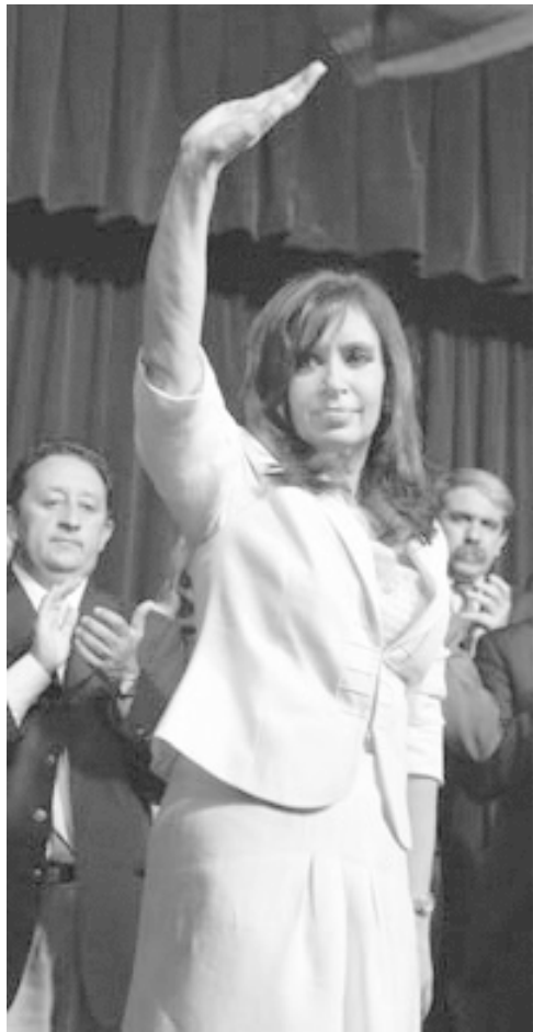
La representante política de la derecha hoy.

Nosotros opinamos que no. Esa versión del conflicto del campo la siembran, a su modo, Néstor, Cristina y todo el kirchnerismo. También varios periodistas y comentaristas afines. Y también algunos grupos de izquierda, cuyas políticas de "ni-ni" fueron de hecho funcionales al gobierno. Más allá de esos balances interesados, algunos compañeros y compañeras tienen algunas dudas sobre los primeros resultados de este conflicto tan complejo. Para aportar a la respuesta, señalamos aquí cuatro primeras reflexiones.