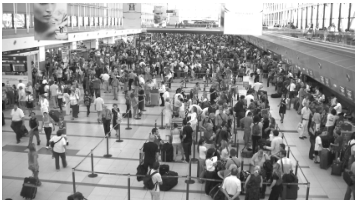
Miles de pasajeros utilizan la aerolínea para sus viajes.