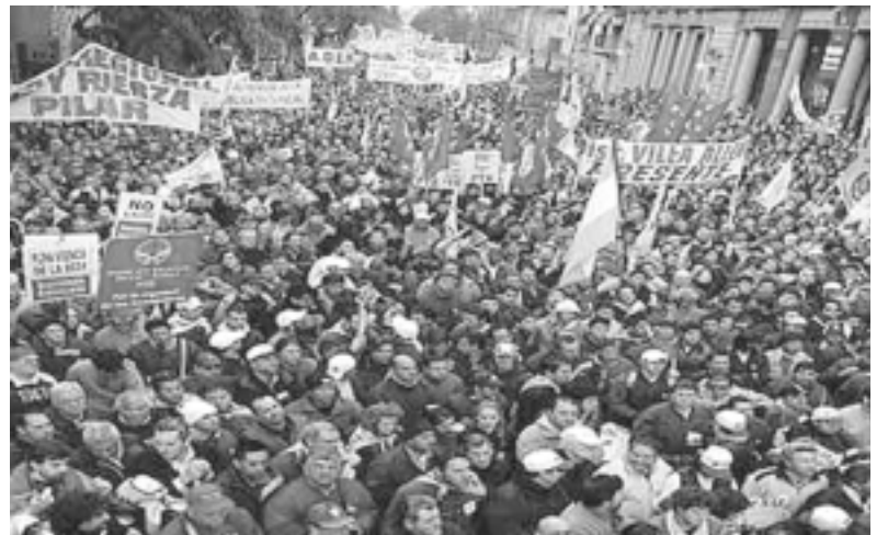
Multitudinaria movilización rechazó el ajuste

luntades "dudosas" el PJ dice tener todos los votos para lograr la aprobación del proyecto.