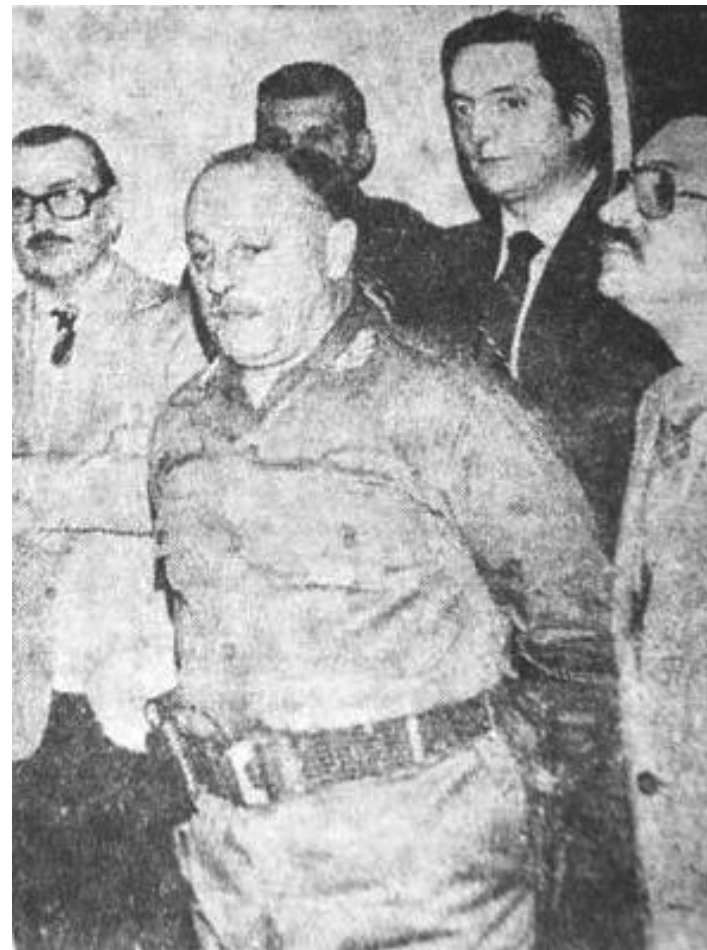
El represor Guerrero, secundado por Kirchner. Foto de 1982 ( http://bloccdeperiodista.com/2007/03/denuncian-al-general-represor-guerrero.html )

Ejemplo de esto han sido la brutal represión y encarcelamiento a los trabajadores petroleros en el norte de Santa Cruz (Las