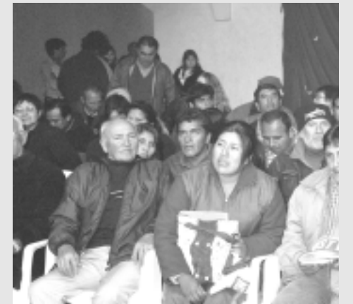
Foto de archivo - agosto del 2006 - Lázaro en el 5º Congreso del MST (el primero de la izquierda)

Jueves 18 de septiembre, a dos años de la desaparición de Julio López