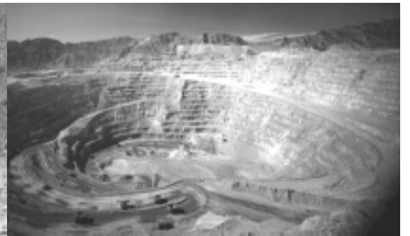
Marcha contra la contaminación de la minera La Alumbra

minería a cielo abierto más grande del país.