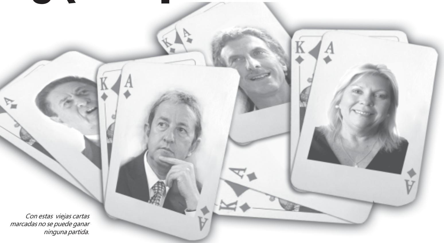
Con estas viejas cartas marcadas no se puede ganar ninguna partida.

En el reciente tratamiento de la estatización de Aerolíneas Argentinas también se vio reflejada la incapacidad (o mejor dicho la falta de voluntad) para trabajar en pos de los intereses de los ciudadanos, y no de los grandes empresarios. Ante el evidente vaciamiento de Aerolíneas y el debate acerca de qué hacer con ella, el bloque formado por el Pro, la Coalición Cívica, la UCR y algunos diputados del PJ solamente propusieron crear una comisión (que hace 20 años in-