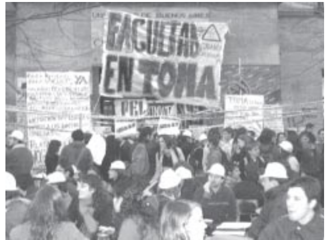
Sociales tomada y los estudiantes con cascos porque el edificio se cae a pedazos

Vuelven a parar lo docentes y junto a ellos, redoblar la exigencia de aumentar el presupuesto educativo y los salarios docentes. No parar hasta conseguir el compromiso firmado y que se retomen las obras del