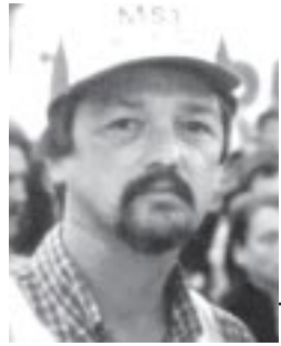
Escribe Gustavo Giménez

El INDEK de Guillermo Moreno viene anunciando que sigue creciendo el empleo, reduciéndose la pobreza y la indigencia. Pero con alrededor de 30 puntos de inflación anual en los alimentos, la pobreza y la indigencia crecen en forma alarmante. Para dar respuesta a la emergencia, los planes sociales deben cubrir como mínimo la canasta de alimentos básicos, que hoy es de $ 560.