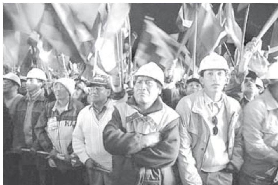
Marcha de Mineros

Ante la provocación golpista el pueblo no espero directivas ni consignas, sus organizaciones comenzaron a movilizarse contra los reductos fascistas. Estos son básicamente las ciudades capitales de las 5 regiones, ya que en el campo los prefectos de la «media luna» también habían perdido en el referéndum revocatorio. La capital de la noroesteña prefectura de Pando, Cobija, fue escenario de una de las más terribles masacres que la historia perpetuará en la memoria del pueblo latinoamericano. Una movilización campesina que se dirigía a Cobija fue interceptada por sicarios a las ordenes del prefecto de Pando, Leopoldo Fernández. Primero abrieron zanjas para que no puedan pasar los vehículos de los