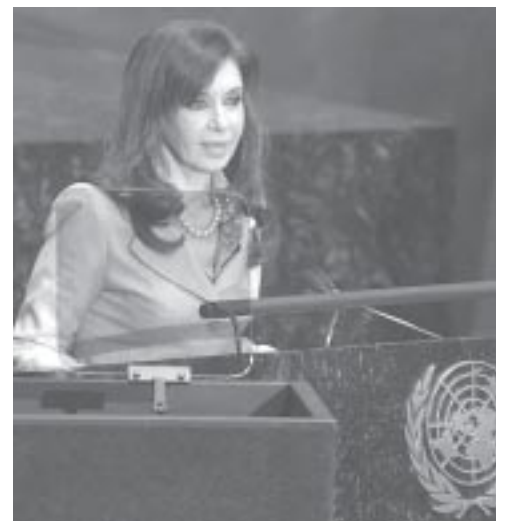
La presidenta de la Argentina, Cristina Fernández anunció la voluntad de hacer una nueva oferta a los tenedores de bonos que el país emitió en el 2001, algo que había rechazado anteriormente. Otra vez bajándose los pantalones.