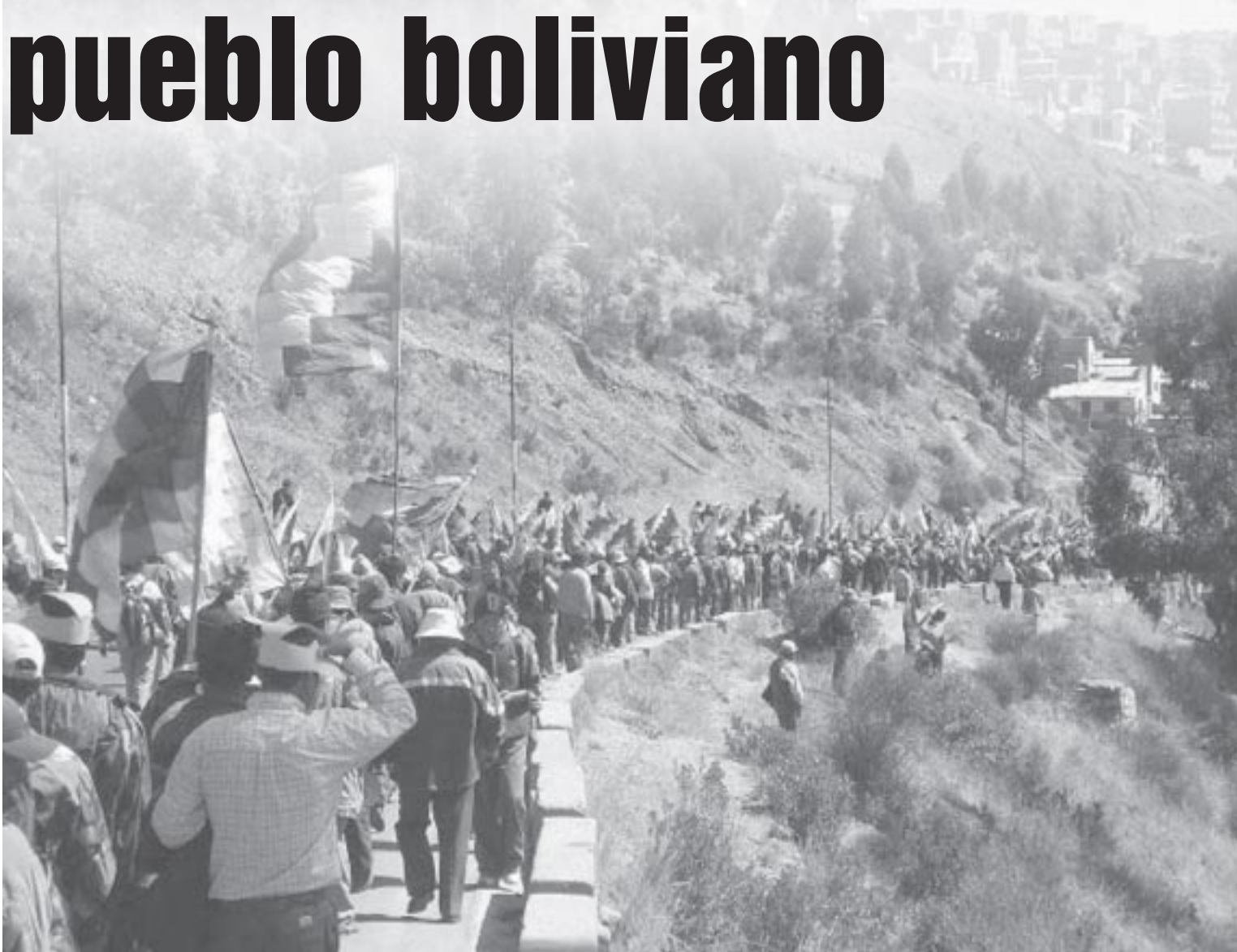
Marcha de campesinos en La Paz

do a cabo en Cochabamba entre el gobierno y los 8 prefectos supervisadas por el secretario general de la OEA, José Miguel Insulza y el canciller de Chile. Esta mesa busca hacer perder con la negociación las conquistas que el pueblo boliviano consiguió con su movilización: la nacionalización de los hidrocarburos y la nueva constitución.