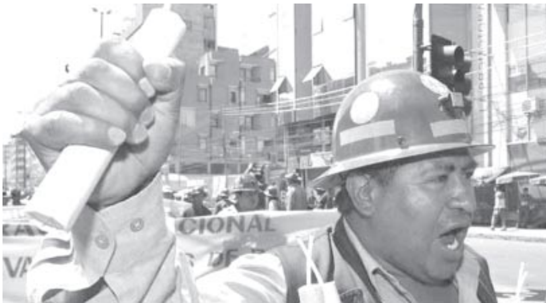
Mineros en La Paz

Luego de obtener un rotundo 67% en el referéndum, el gobierno de Evo Morales enfrentó el más duro contragolpe de la derecha reaccionaria y el imperialismo. La derecha inició una violenta toma de las sedes del gobierno nacional en los estados del oriente y se declaró en rebeldía, provocando la masacre de Pando del 11 de septiembre, donde fueron asesinados salvajemente 30 campesinos y aún permanecen desaparecidos cerca de 100. El imperialismo mueve los hilos detrás de la escena. Para estar a la altura de las circunstancias los gobiernos latinoamericanos deberían haber expulsado a los embajadores yanquis en sus respectivos países, como hicieron Evo y Chávez, pero no lo hicieron. Más que nunca hay que estar al lado de nuestro pueblo hermano.