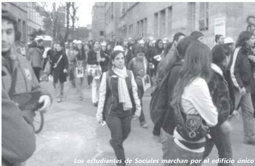
Los estudiantes de Sociales marchan por el edificio único