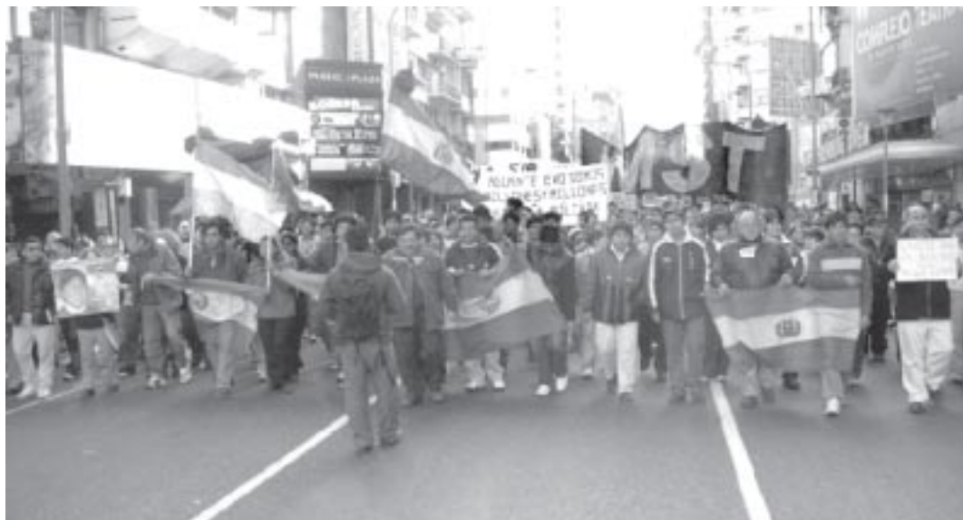
Marcha en Buenos Aires en repudio al intento de golpe de la derecha boliviana y los EE.UU.

el mundo. Solidaridad que merece también un apoyo económico, social, político y militar. La expulsión del embajador norteamericano en Venezuela es una medida ejemplar, lo mismo que la advertencia del presidente Chávez que se podría llegar al punto de cortar el suministro petrolero a ese país. Después de la expulsión del embajador norteamericano de nuestro país y las advertencias formuladas al imperialismo, sería ingenuo no prepararnos para enfrentamientos militares. El reclamo de los jóvenes del PSUV de recibir los fusiles y el entrenamiento correspondiente es una buena señal del reflejo que hay en nuestro pueblo. Creemos que las milicias obreras y juveniles, las milicias populares deben tener un entrenamiento profundo y permanente y, no sólo en los cuarteles, sino en sus lugares naturales de trabajo, de vivienda, de estudio».