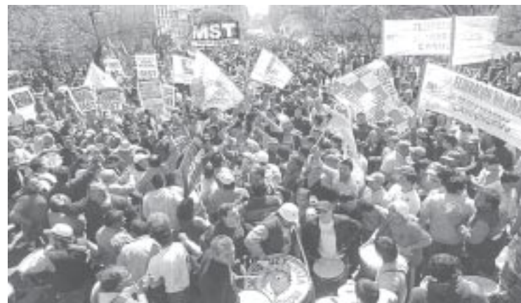
Más de 20 mil trabajadores estatales marcharon el pasado 16/9.

Hay que retomar el plan de lucha porque el gobierno no quiere dar el brazo a torcer. En todas las dependencias de EPEC, Municipalidad, tribunales, ministerios y escuelas, los trabajadores y delegados combativos tienen que dar batalla por la convocatoria a asambleas para que sea la base la que garantice que nada interfiera en la