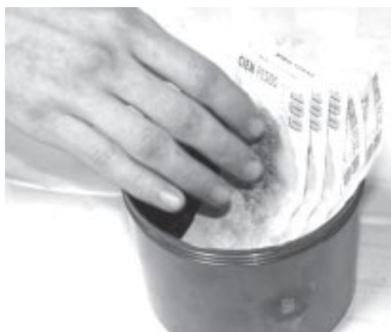
Los políticos patronales con la mano en la lata

Es sabido que quien aporta estas sumas en una campaña electoral no lo hace en forma desinteresada. Los favores se cobran y caro. Si los fondos que recibió Cristina tienen una