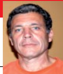
Escribe: Gerardo Uceda

Hace apenas dos años los analistas burgueses cantaban loas al crecimiento de la economía mundial. Desde entonces las malas noticias se suceden poniendo en vilo al sistema financiero internacional: crack en Shangai, crisis bursátiles en la capital del imperio... Con la quiebra de Lehman Brothers la cuestión tomó ribetes de abismo, comparándose con la devastadora crisis del 30. Hay quienes tratan de minimizarla o relativizarla. ¿Cuál es la verdad? ¿Tocaron fondo las crisis bursátiles? ¿Nos debemos preparar para una pronta recuperación? Más allá de los interrogantes surgen certezas: el estado capitalista sale a salvar los grandes negocios privados e intentará descargar la crisis sobre la espalda de los trabajadores y el pueblo.