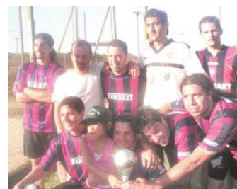
«El Furgón», equipo campeón con la copa "Lázaro Duarte"

El domingo 14 se realizó el Campeonato de Fútbol "Lázaro Duarte" en las instalaciones de la Ciudad Universitaria de la UBA. Más de 20 equipos de la Juventud Socialista, de clínicas y hospitales de la Capital, de los abogados del CADHU y de las regionales de San Martín, Norte, Oeste y San Miguel disputaron la copa que lle-