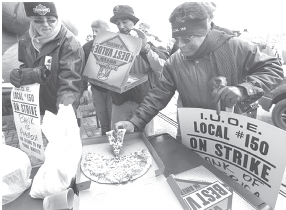
Trabajadores de la Republic Windows and Doors en Chicago

La presidenta de un comedor de Texas le comentó al Associated Press que cuando abrió el comedor pensaba atender "gente con carteles diciendo 'trabajo por co-