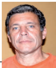
Escribe Gerardo Uceda

Con 129 legisladores sentados y gracias al quórum brindado por el nuevo kirchnerista Borocotó, diputados aprobó el paquete "anticrisis" de Cristina. La oposición tradicional se quejaba en los pasillos acusando al gobierno de querer hacer caja y favorecer el blanqueo de capitales truchos. Según el gobierno este paquete beneficia a los trabajadores. Sin embargo es aplaudido por los grandes empresarios y funcionarios del kirchnerismo. ¿Cuál es la verdad? ¿Qué nos traerá este paquete?