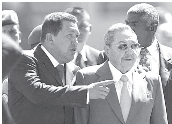
Raúl Castro junto a Chávez

isla acechan pero la presencia de los procesos revolucionarios de Venezuela, Bolivia y Ecuador abren un camino esperanzador. Para los que tenemos más de 40 años de trotskismo, vivir esta crisis que está haciendo tambalear al mundo, reaviva nuestra esperanza al recordar la