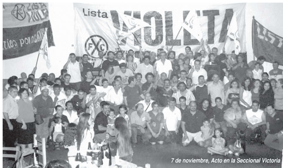
7 de noviembre, Acto en la Seccional Victoria

Pese a todo ello, para estas elecciones desde la Lista Violeta les hicimos una pro-