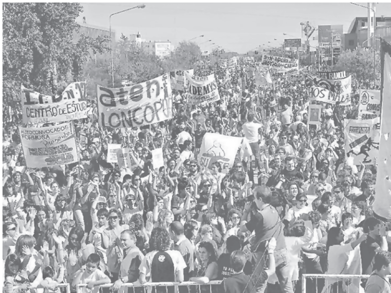
Marcha y paro del 4 de abril por Fuentelba

bio de dirección al conquistarse nuevos gremios y cargos en las Juntas o Tribunales de Clasificación y los Consejos de Educación. Avanzando significativamente los sectores de la Lila y siendo castigados las corrientes oportunistas como el PC que acompañan a la Celeste en AGMER o La Rioja. También los proyectos sectarios como el de PO, al salir últimos y sin representación en las elecciones de Santa Cruz, Neuquén y Capital.