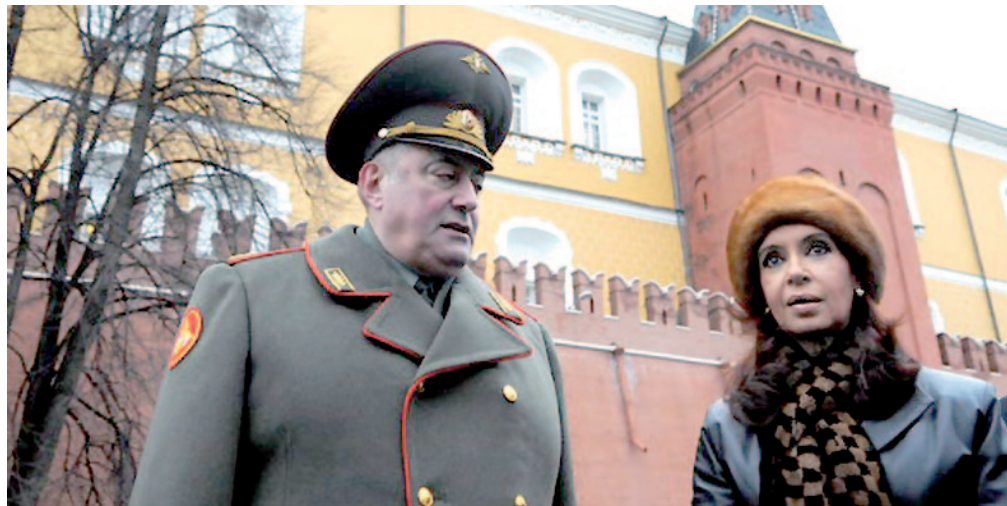
Cristina en Rusia, buscando nuevos mercados

Pero no nos dejemos engañar por falsos discursos y movilizaciones pagas, para desengañarse basta escuchar el discurso de Néstor Kirchner en la conmemoración del primer año de gobierno de la presidenta, cuando dijo que "la Argentina garantizará la totalidad de los pagos de la deuda para este 2009" y que invertirá "todos los recursos necesarios para hacerlo". Más clarito échele agua.