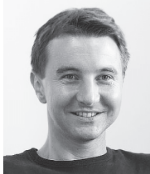
Olivier Besancenot, dirigente del nuevo partido

Mientras prepara su congreso fundacional, las muestras de simpatía hacia el Nuevo Partido Anticapitalista se hacen sentir. Crecen las adhesiones y se incorporan nuevos militantes y simpatizantes. Su principal figura es un joven