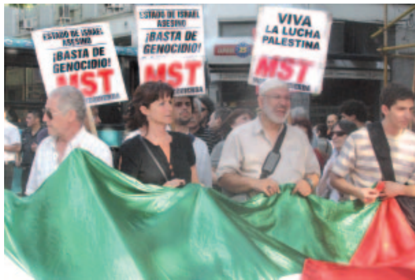
El viernes 16, «zapatazo» convocado por el Comité de Solidaridad ante la embajada israelí