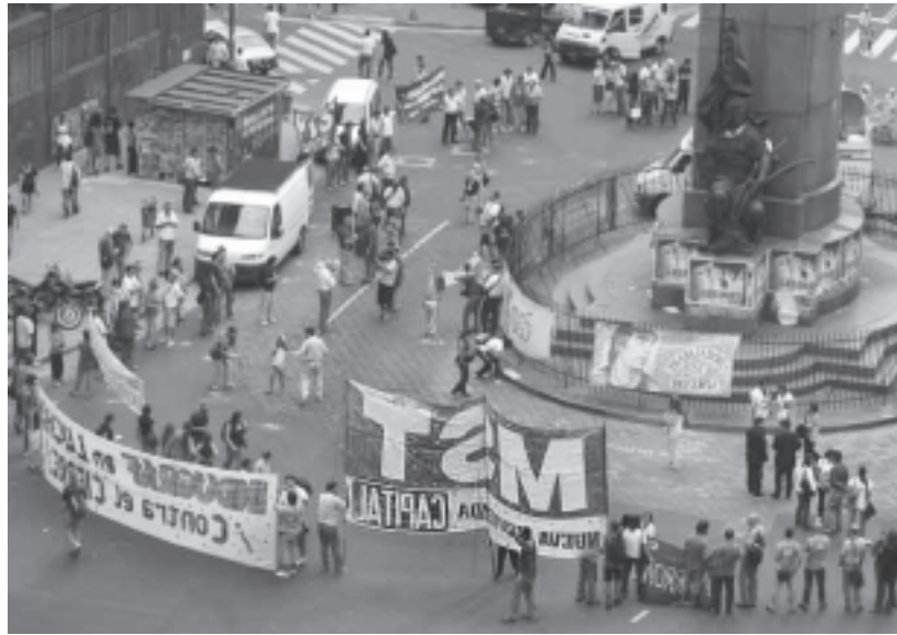
Abrazo al INDEC de los trabajadores

Datos ciertos de cuánto se precisa realmente para vivir, de cuánto se han deteriorado los salarios, jubilaciones y planes so-