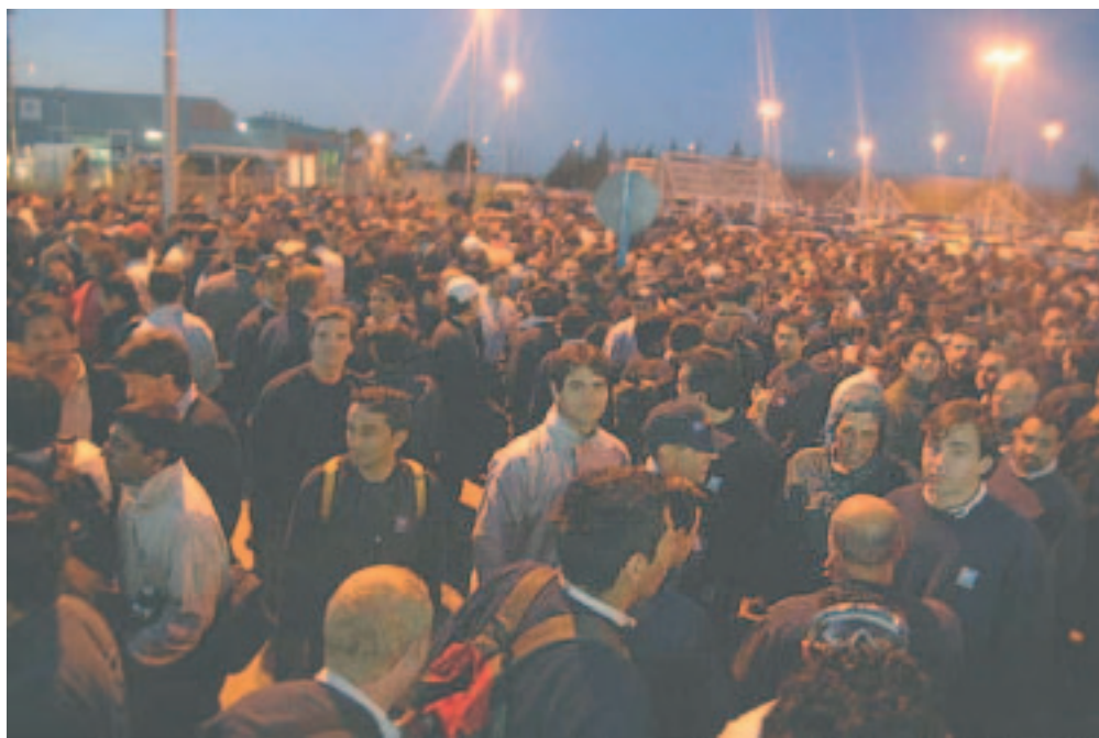
Trabajadores de General Motors ocupando la fábrica.

Va a ser importante cómo se responda durante el mes de marzo a los intentos de rebaja salarial. Una prueba de que los trabajadores están dispuestos a seguir dando batalla fue que ante el intento de la empresa de utilizar contratados para cubrir las tareas