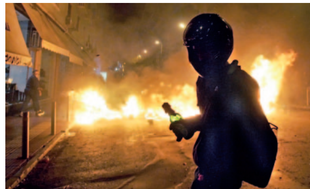
Revuelta en Grecia

En segundo lugar, por primera vez en la historia contemporánea de Lituania y Letonia contra el acuerdo de los gobiernos de los lituanos y los letones han actuado de una manera organizada no sólo la minoría rusa, sino en gran medida la población radical, habiendo corrido las contradicciones nacionales al fondo. Por eso, la probabilidad de la aparición en la región de una fuerza política capaz de superar las contradicciones étnicas y la costumbre de seguir en el paso del capitalismo europeo ahora como es más alta que nunca.