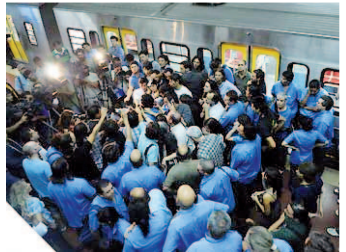
Los trabajadores de la línea D votan el paro (05/02/09)

Pero es necesario saber que nadie va a regalarnos nada. La nueva organización la tenemos que conseguir con la lucha, la unidad y la más profunda democracia sindical. Con total independencia del gobierno y de la empresa. Hay que exigirle al Ministerio