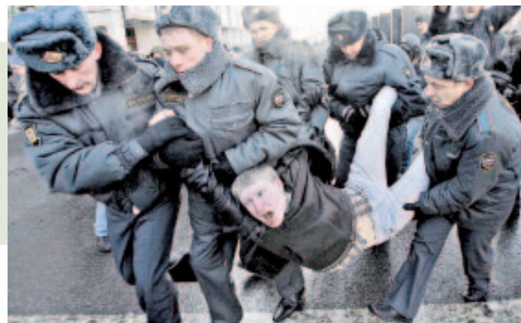
Manifestante detenido en Rusia