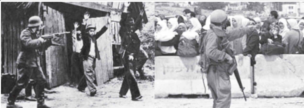
Ayer los nazis... hoy Israel.: los puestos de control no permiten el libre tránsito de la gente

tifundio; la propiedad agrícola no podrá ser mayor a 5.000 hectáreas, aunque se respetan propiedades mayores pre-existentes si cumplen funciones productivas determinadas por ley; los recursos naturales renovables y no renovables son declarados de carácter estratégico (su propiedad no podrá ser concedida a empresas ni a particulares, salvo extensiones limitadas de tierra para fines agrícolas); como recursos estratégicos, los hidrocarburos y los minerales sólo podrán ser explotados bajo la dirección del Estado, directamente o con participación de empresas privadas nacionales o extranjeras mediante contratos de prestación de servicios; se proteja a la coca como patrimonio y recurso natural; se prohíben bases militares extranjeras.