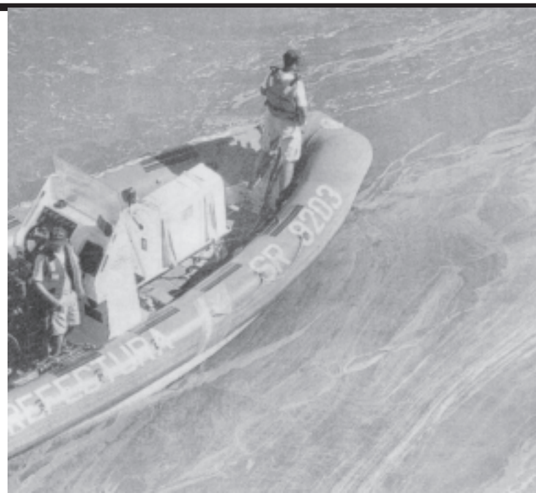
Una enorme mancha en el Río Uruguay

Por eso, el 8/02 los vecinos se autoconvocaron en el puente internacional