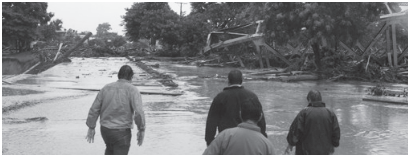
Así quedó Tartagal después del aluvión donde muchas familias perdieron sus casas

Lamentablemente, Tartagal vuelve a ser noticia, llenando las pantallas de TV y medios nacionales, donde se puede ver el desastre de miles de personas que perdieron sus viviendas, evacuadas, en un panorama dantesco. Mientras tanto, el gobernador Urtubey, Alicia Kirchner y el jefe gabinete Sergio Massa, hablan de "tragedia o catástrofe natural", prometiendo ayuda y cambios de fondo.