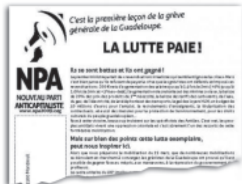
Volante nacional del NPA, hacia la huelga general del 19.