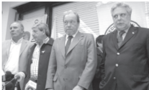
Integrantes de la Mesa de Enlace

Por eso no se puede confiar en la Coalición Cívica, la UCR, Cobos, Solá, el Pro o Binner. Algunos de ellos plantean eliminar las retenciones para todos o desestiman la