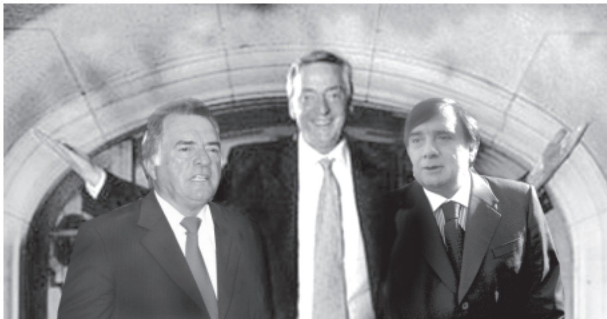
La juntucha existió, esta es la foto que evitaron sacarse.

Pasan de una vereda a la otra como quien cruza la calle, representando un espectáculo lamentable, a cuyo elenco Borocotó podría sumarse como un actor más, pasando desapercibido.