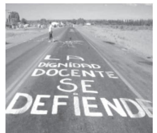
Dignidad docente en la ruta

Al cierre de esta edición ya había repercusiones. El diario "Río Negro" tituló: "Maestros intensificaron el corte en Chichinales". Destacando que "cerca de las 19 el corte se levantó para dar comienzo a los preparativos de un acto conjunto con delegaciones de docentes de las provincias de Santa Cruz, Entre Ríos, Santa Fe, Neuquén y Buenos Aires en solidaridad con el reclamo de los maestros rionegrinos". Además de señalar que "se publicará una solicitada en un diario de alcance nacional para dar a conocer la situación al resto del país" y que hubo volanteadas y cortes en otras localidades.