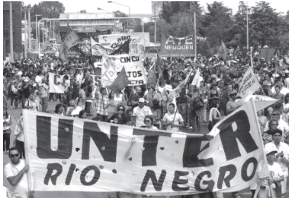
ATEN y UNTER marchan al puente el 2/3

La docencia tiene dos tareas: dar la espalda a los viejos partidos del sistema, sumándose a construir esa nueva izquierda que lucha por el salario y la educación. Y dar la espalda a la dirigencia claudicante y ser parte de la rebeldía con las conducciones de oposición -en gran medida de la Lila- que pelean por unir lo diverso como plantea la declaración de Chichinales. Un nuevo mapa gremial se va configurando. Con Adosac, ATEN y el sur combativo, Entre Ríos o Jujuy, con una Celeste inexistente en Salta o Santiago y en crisis en Mendoza... Siguiendo a un go-